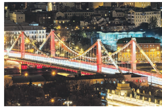
29 октября 2019 года. Ночью украшенный яркой иллюминацией Крымский мост выглядит торжественно

■ Станции метро «Севастопольская» и «Нахимовский проспект» и станция Крымская на МЦК.