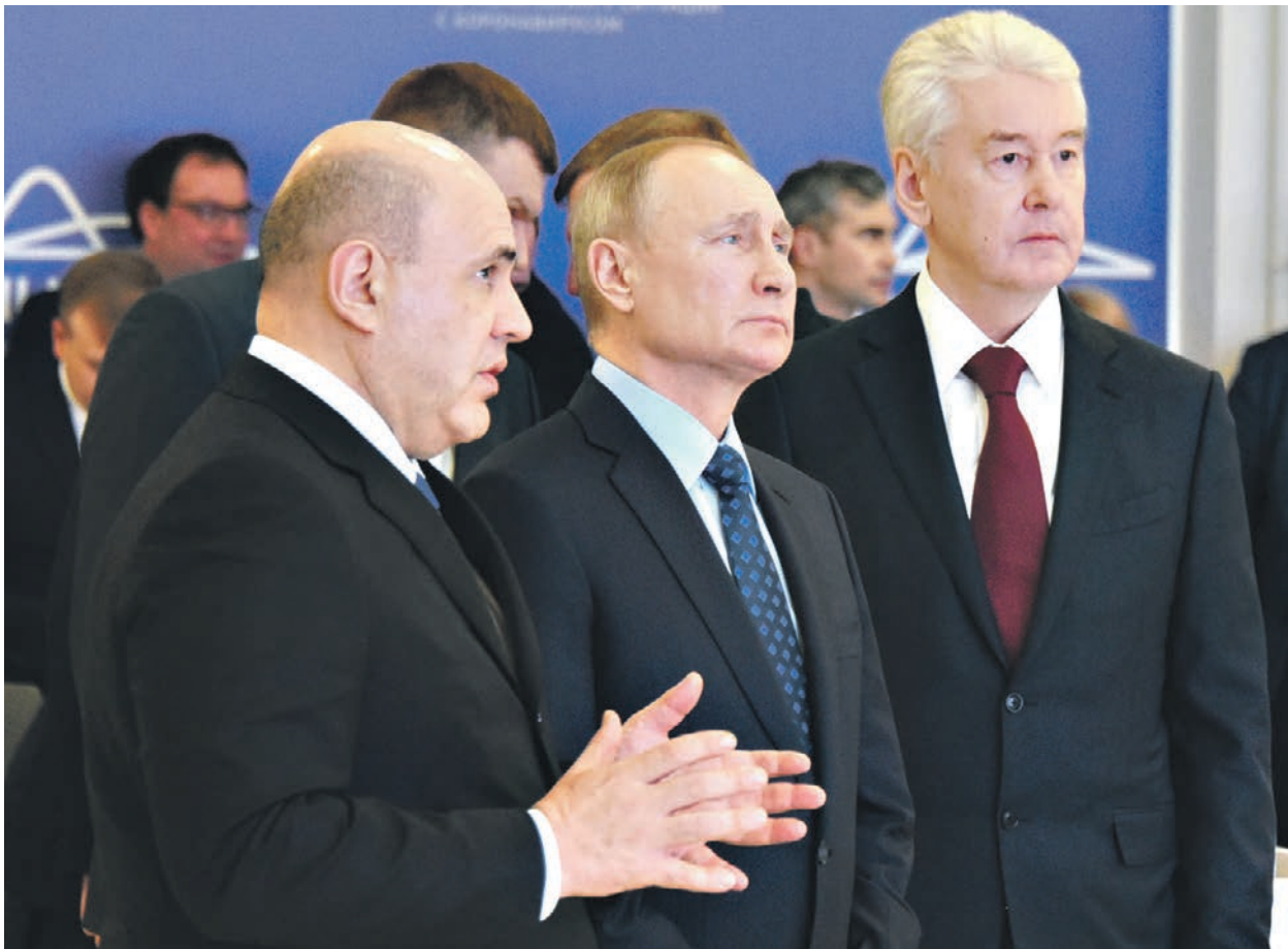
17 марта 2020 года. Премьер-министр РФ Михаил Мишустин, президент России Владимир Путин и мэр Москвы Сергей Собянин знакомятся с работой информационного центра по мониторингу ситуации с коронавирусом

Ситуация с коронавирусом остается под контролем