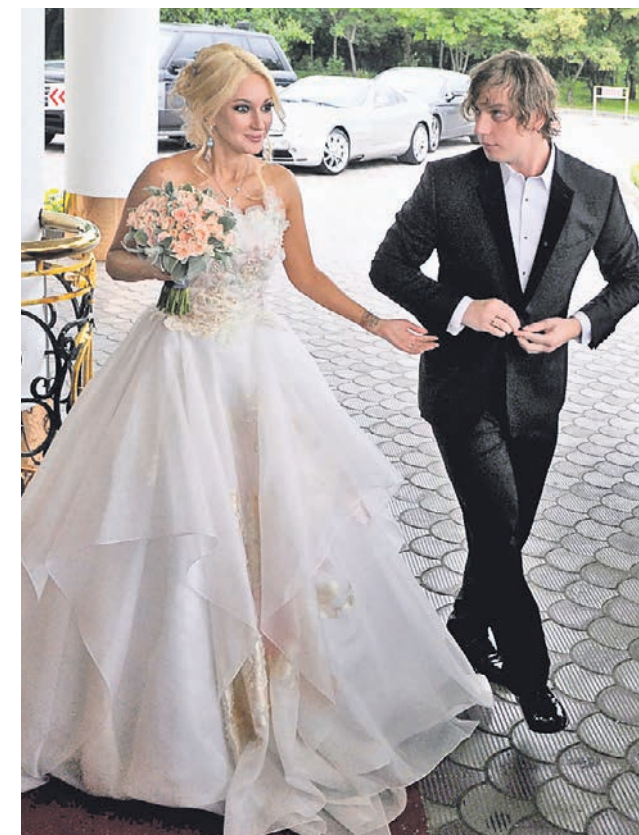
Сергей Бобылев / ТАСС