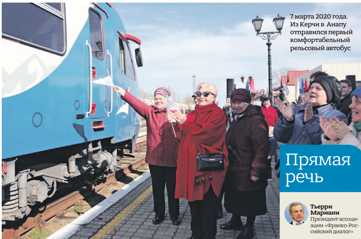
7 марта 2020 года. Из Керчи в Анапу отправился первый комфортабельный рельсовый автобус