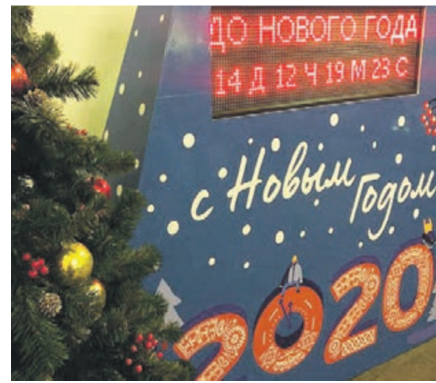
В общей сложности в метро появится 30 часов обратного отсчета времени до Нового года