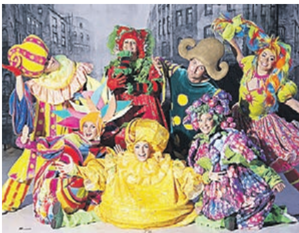
Артисты цирка — призеры международных соревнований — выполняют все трюки без страховки