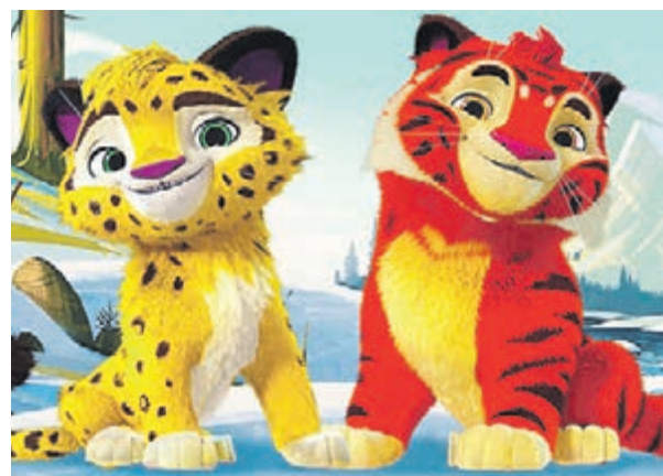
Мультгерои Лео — маленький леопард и тигренок Тиг — сойдут на сцену и подарят ребятам новогоднее чудо

■ Представьте, что существует волшебный народ, который даже не подозревает о существовании такого праздника, как Новый год?