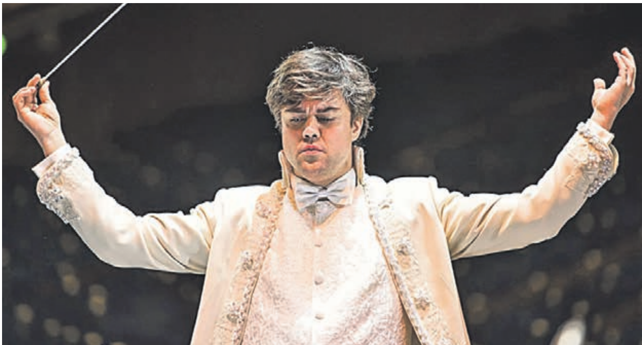
Музыканты Симфонического оркестра Concord Orchestra исполняют произведения венского композитора под руководством итальянского дирижера Fabio Pirola

■ Открываем наш обзор волшебным мероприятием для родителей — ведь сказки хочется вне зависимости от возраста. Вдохновиться перед встречей Нового года можно будет на настоящем балу.