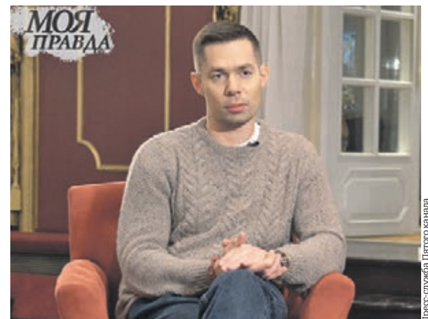
Стас Пьеха в программе «Моя правда» предельно откровенно рассказывает о преодолении зависимости

— Я наркоман, и моя сущность изначально там... Периодически передозировки случались, периодически они были настолько сильными, что приходилось вызывать скорую. Пару раз была реанимация... Так вспоминает Стас о самом себе, так признается в грехах, пытается остановиться от ошибок других. Запредельная по откровенности программа — совсем скоро, не пропустите.