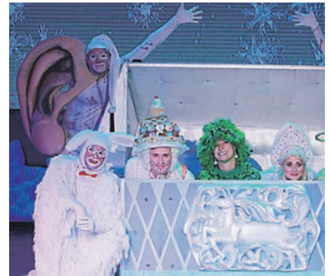
Финалом шоу станет настоящая новогодняя дискотека с участием всех сказочных героев!

Конгресс-центр имени Плеханова 21.12 — 07.01