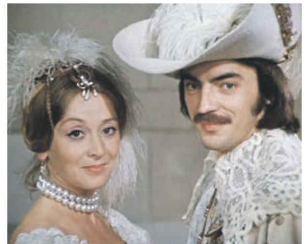
Маргарита Терехова и Михаил Боярский в фильме «Собака на сене», 1977 год

тя изначально не прошла первые пробы? Правда ли, что Маргарита Терехова избила Михаила Боярского до крови во время работы над «Собакой на сене» и был ли у них роман? А как поладили Никита Михалков и Нонна Мордюкова и за что Андрей Кончаловский просил прощения у Беаты Тышкевич? Зрители канала «ТВ Центр» получат ответы на эти вопросы, посмотрев 26 декабря в 23:05 новый документальный фильм «Звезда с гонором».