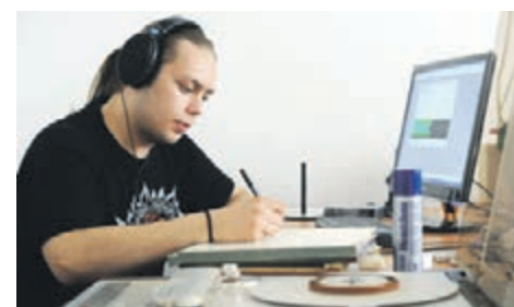
Сергей Фадеев / ТАСС

8 июля 2012 года. Рабочий процесс сотрудников фирмы «Мелодия»