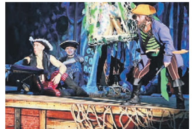
На каникулах дети и родители смогут принять участие в поисках затерянных сокровищ

Дворец гимнастики Винер-Усмановой 29.12 — 08.01