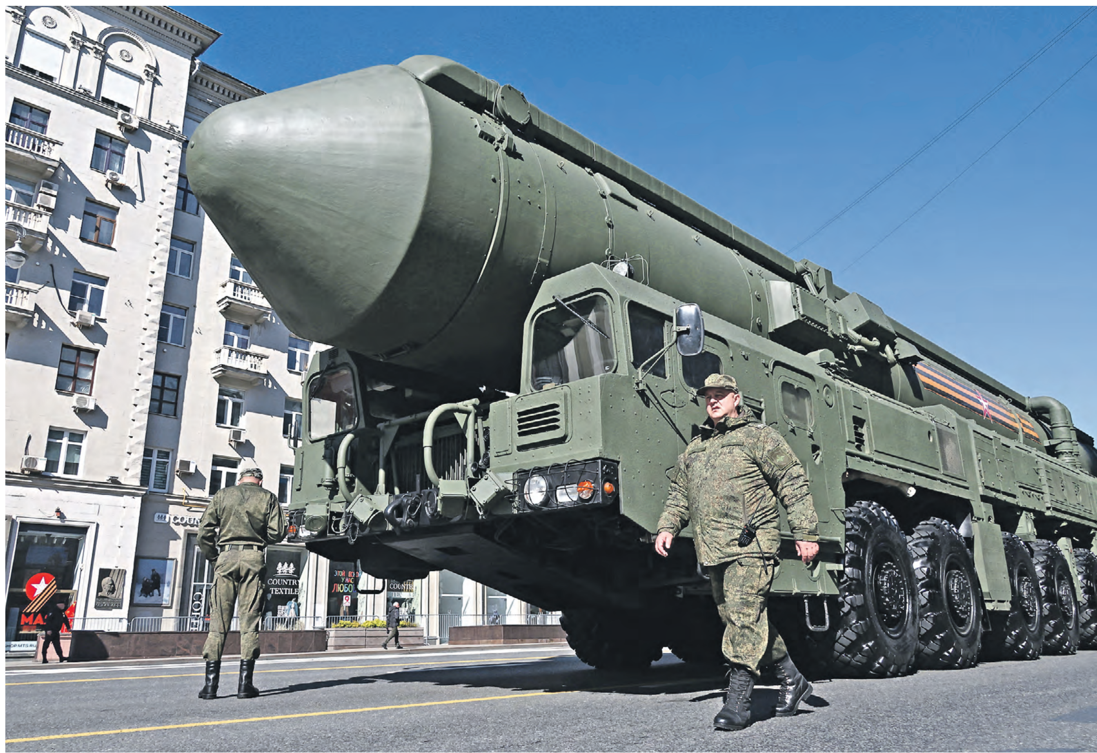
9 мая. Москва. Ракетный комплекс «Ярс» по пути на парад Победы на Красной площади, посвященный 78-й годовщине Победы в Великой Отечественной войне

Даже не надо гадать, кому Столтенберг этот сигнал послал. Так же не скрывают намерений и политики теряющего влияние мирового «гегемона». Соединенные Штаты Америки должны качественно и количественно наращивать свой ядерный арсенал, чтобы одновременно сдерживать Россию и Китай. Этот однозначный вывод содержится в опубликованном в октябре 2023 года докладе спецкомиссии Конгресса