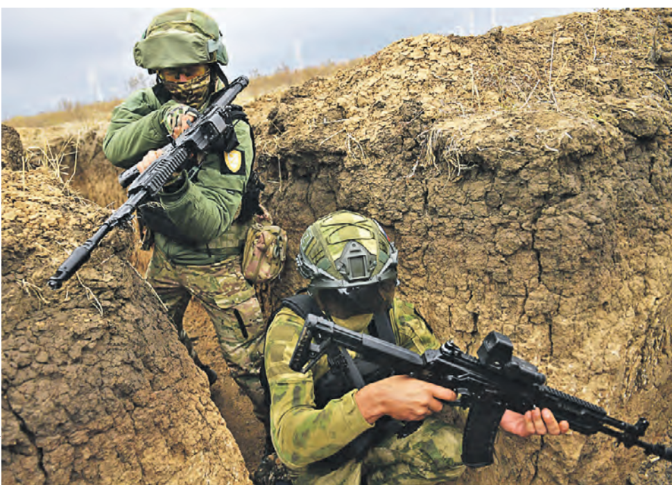
23 октября. Военнослужащие отдельной казачьей бригады «Днепр» во время подготовки подразделений на полигоне в Запорожской области в зоне СВО. Добровольческая бригада «Днепр» была основана весной 2023 года для выполнения специальных боевых задач на запорожском и херсонском направлениях. В состав бригады вошли казаки и добровольцы со всех регионов России, в том числе из Запорожской и Херсонской областей.