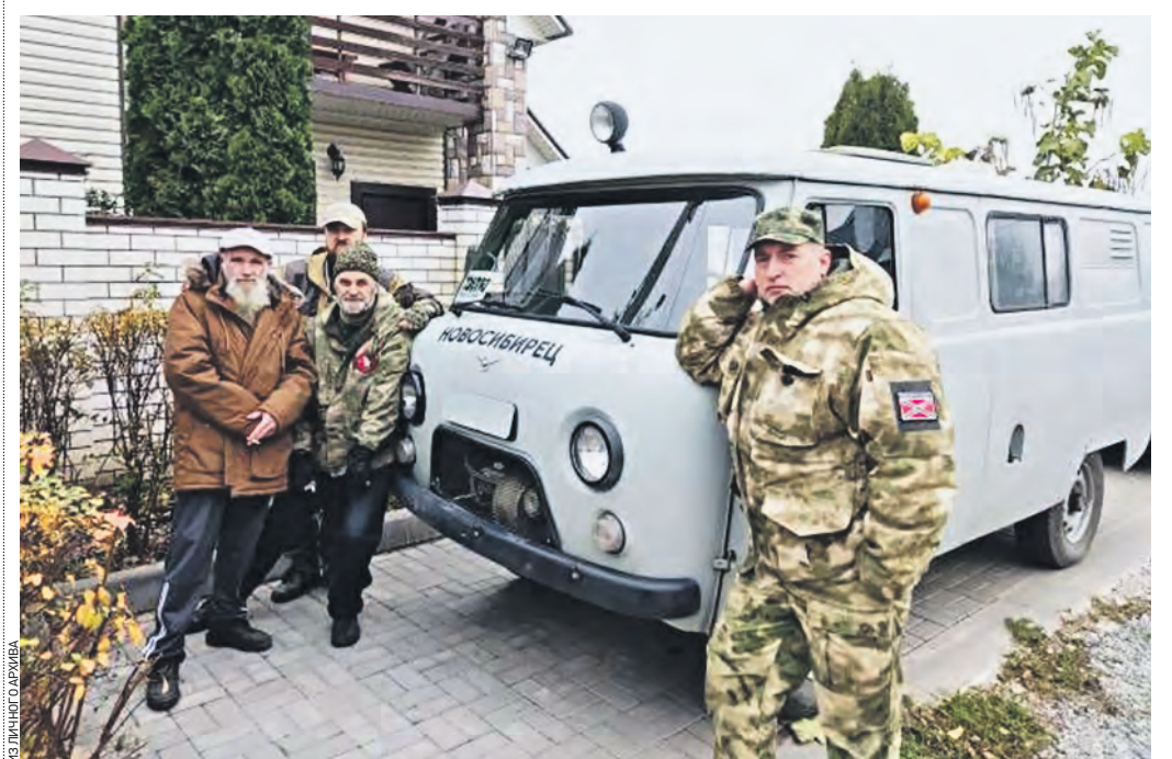
20 октября. Военнослужащие в зоне спецоперации принимают машину УАЗ, которую для них приобрели волонтеры в рамках акции «Буханка» для Донбасса