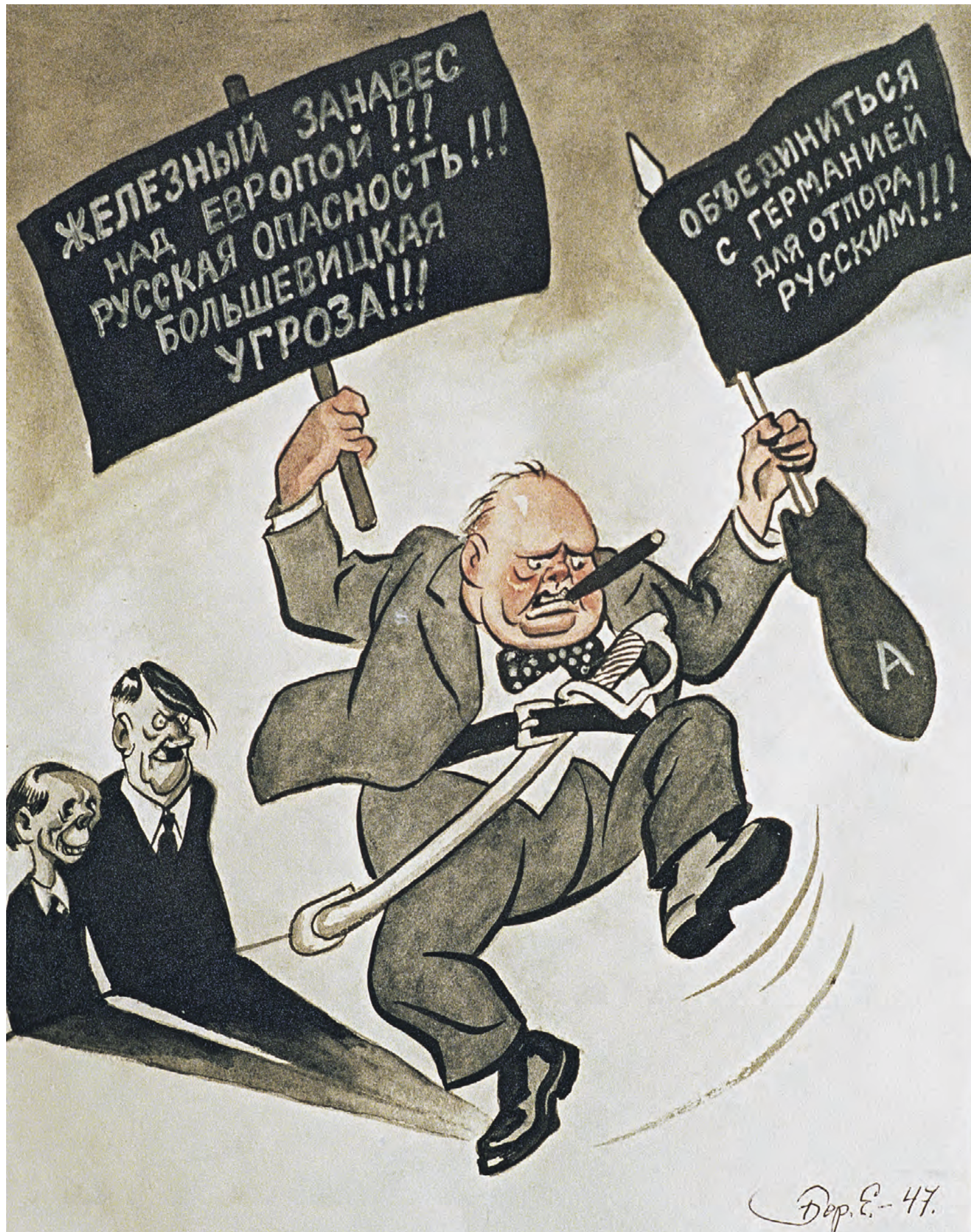
7 декабря 2000 года. Карикатура «Выступление в Фултоне» художника Бориса Ефимова на выставке «Сатирическая летопись века»

— Это коснется также США и всех, кто входит в их сферу влияния. Уровень потребления, еще недавно возведенного в культ, как говорят экономисты, упадет примерно до показателей 1970-х годов. Трансграничная мобильность людей за пределы их родной сферы жизни существенно снизится, а случаи перемещения во враждебную сферу влияния сойдут практически на нет. Все вышеописанное — уже реальность, вне зависимости от исхода военной опе-