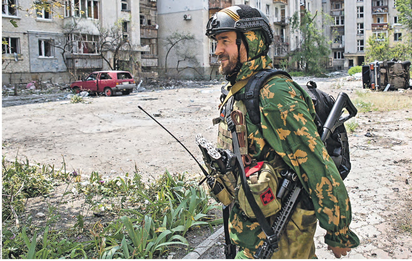
29 мая 16:25 Военнослужащий спецподразделения «Ахмат» Росгвардии около одного из жилых домов, поврежденных в результате обстрела Северодонецка. Силами подразделения Чеченской Республики уже освобождено 85 процентов территории города, в том числе частный сектор

Помимо этого, росгвардейцам удалось предотвратить взрыв в Харьковской области. Местный житель сообщил им, что в одном из домов лежит неразорвавшийся снаряд. — Спецназовцы Росгвардии эвакуировали местное население и обследовали район. При детальном осмотре боеприпаса было установлено,