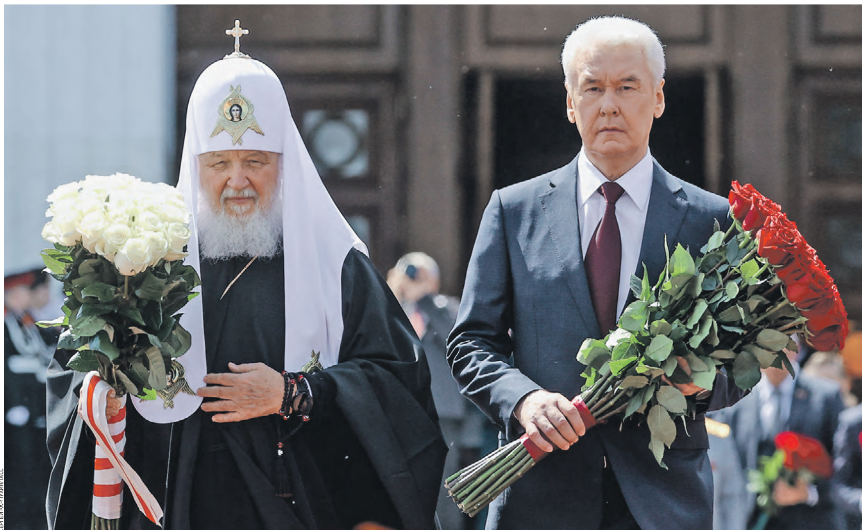
Вчера 13:02 Патриарх Московский и всея Руси Кирилл и мэр Москвы Сергей Собянин посетили парад кадетского движения «Не прервется связь поколений!». После торжеств состоялась церемония возложения венков к Вечному огню, монументу героям Великой Отечественной

На Поклонной горе, возле Музея Победы состоялся ежегодный парад кадетского движения Москвы «Не прервется связь поколений!», посвященный 77-й годовщине Победы в Великой Отечественной войне и 350-летию со дня рождения основателя регулярной Русской армии и флота императора Петра I. В торжествах приняли участие свыше 2,8 тысячи ребят. Ровный строй, четкий шаг, форма со сверкающими пуговицами. Ослепительно белые банты у девочек. Сосредоточенность во взгляде у мальчиков. Ответственность за свой выбор — у каждого из ребят. Торжественный парад кадетов — это всегда яркое и зрелищное мероприятие. Всего в нашем городе насчитывается 30 тысяч кадетов, и каждый десятый из них пришел на Поклонку в этот особый майский день. Все они сегодня, гордо неся свое звание, прошли серьезный конкурсный отбор. За пока хрупкими плечами — хорошие отметки и успехи в спорте, стремление стать лучше, а в будущем служить на благо Родине. Для этого приходится каждый раз до-