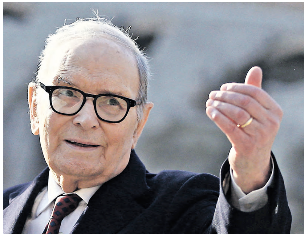
6 июня 2019 года. Итальянский композитор и двукратный обладатель премии «Оскар» за написанные им композиции к фильмам Эннио Морриконе в Риме