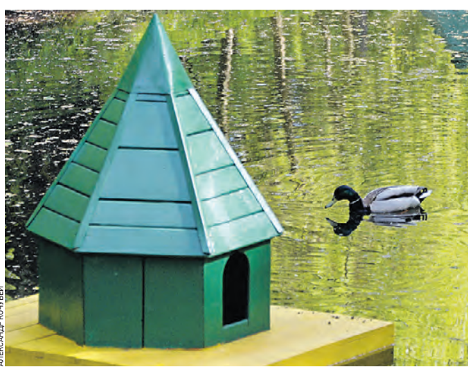
Вчера 16:17 Новые домики для уток установили в столичном парке «Кузьминки-Люблино»

Вчера, после четырех лет реставрации, в Третьяковскую галерею вернулась картина «Иван Грозный и сын его Иван 16 ноября 1581 года» художника Ильи Репина. Корреспондент «ВМ» узнала, как специалисты возвращали полотно к прежнему виду, используя новые технологии.