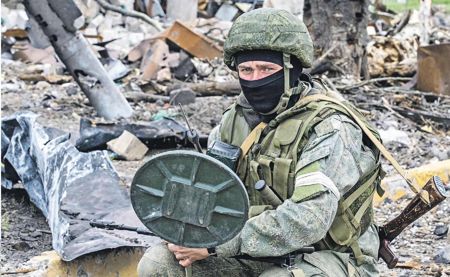
22 мая 14:32 Российский сапер проводит разминирование на территории завода «Азовсталь». С комбината уже вывезли всех сдавшихся в плен украинских националистов. Они находятся на территории ДНР

— За сутки высокоточными ракетами воздушного базирования поражены четыре пункта управления, узел связи оперативно-тактической группы «Север», а также шесть складов боеприпасов, — заявил Игорь Конашенков. Российскими средствами ПВО за сутки сбиты три самолета Су-25 воздушных сил Украины. Перехвачены две украинские баллистические ракеты «Точка-У», восемь реактивных снарядов системы залпового огня «Смерч», уничтожены 13 вражеских беспилотников. — Оперативно-тактической и армейской авиацией поражены 39 районов сосредоточения военной техники, а также уничтожен склад боеприпасов в районе Красный Лиман ЛНР, — уточнил Игорь Конашенков.