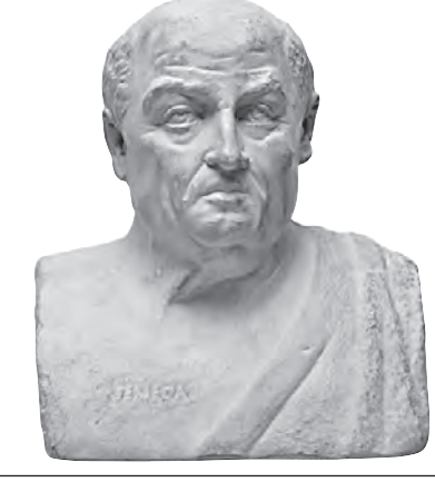
ЛУЦИЙ АННЕЙ СЕНЕКА (4 Г. ДО Н. Э. — 65 Г. Н. Э.) ФИЛОСОФ

Всякий разумный человек наказывает не потому, что был совершен проступок, но для того, чтобы он не совершался впредь. Первое условие исправления — сознание своей вины.