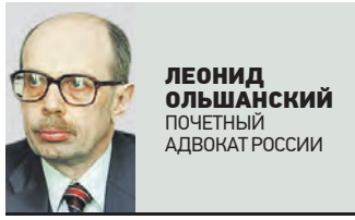
ЛЕОНИД ОЛЬШАНСКИЙ ПОЧЕТНЫЙ АДВОКАТ РОССИИ