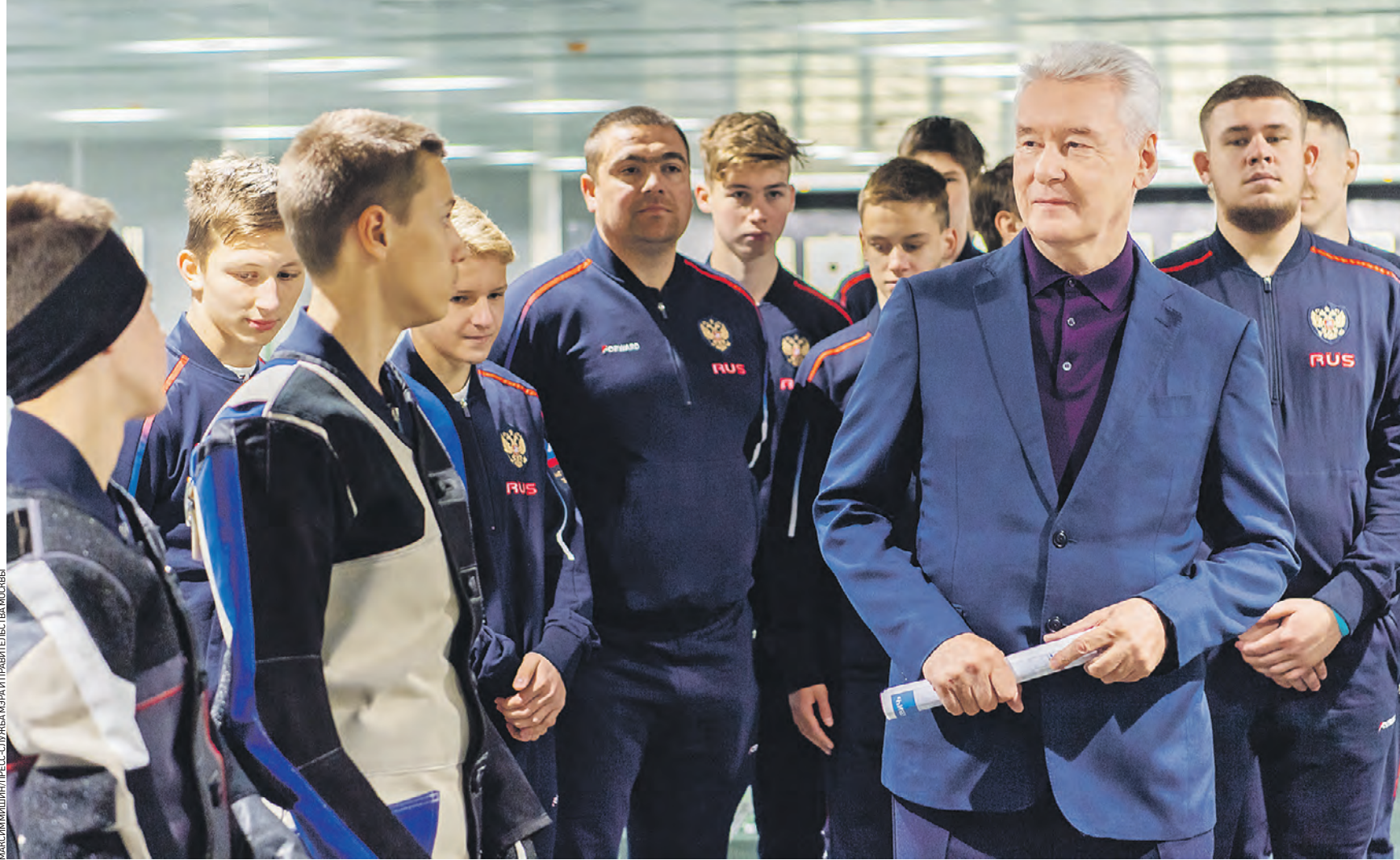
Вчера 13:09 Мэр Москвы Сергей Собянин (справа) общается со спортсменами во время осмотра хода реконструкции стадиона «Москвич». Объект готов уже на 98 процентов и откроется в сентябре этого года

— Завод «Рено» ушел из Москвы, теперь он переименован и вернул свое историческое название — Московский завод «Москвич». Исторически к этому заводу примыкал и принадлежал целый комплекс учреждений, зданий культурных, спортивных. Все они сегодня находятся в стадии обновления, — сказал Сергей Собянин. — Сегодня стадион и его капитальные сооружения увеличились в 5 раз — почти с 2 тысяч до 10 тысяч квадратных метров. По итогам реконструкции здесь будет новая современная спортивная площадка. — Создан стрелковый комплекс, новое поле с подогревом, увеличилось количество подтрибунного и надтрибунного пространства, мест на