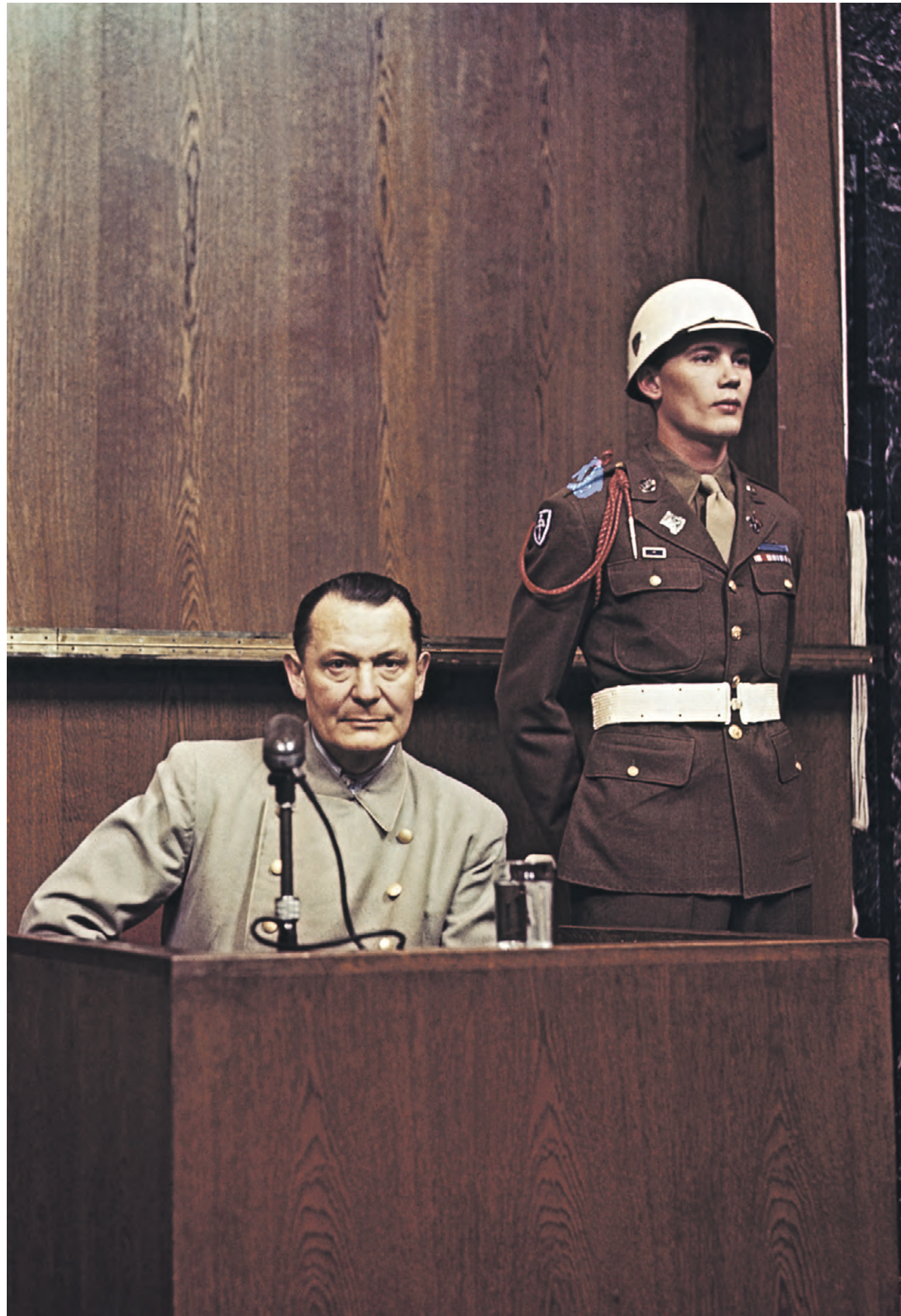
Март 1946 года. Нюрнберг. Подсудимый Герман Геринг на заседании Международного военного трибунала в Нюрнберге. До самоубийства ему остается семь месяцев. У украинских неонацистов пока еще есть возможность избежать подобной участи

Одновременно в лагерях шла работа по идеологической «перековке» военнопленных. На первом плане стоял вопрос антифашистской агитации. Ею занимался целый штат сотрудников НКВД: замполит, пропагандист, завклубом, завбиблиотекой. Они проводили с пленными беседы по материалам советских газет и сообщений Совинформбюро. Ежедневно! Немцам рассказывали о преимуществе социалистической системы. «Для души» вечерние враги занимались в кружках по интересам — по изучению русского языка, шахматам, хоровому пению. Думаете, смешно все это? Напрасно улыбаетесь. Многие бывшие военнопленные затем сделали блестящие карьеры в ГДР. Долгий срок плена и доброе партийное слово перевоспитали даже фельдмаршала Паулюса. Десять лет чтения под присмотром советских чекистов газеты «Правда» и трудов классиков марксизма-ленинизма превратили убежденного нациста в пламенного антифашиста. Есть ли у нас сейчас что-то подобное сталинскому ГУПВИ на оболваненной неонацизмом Украине?