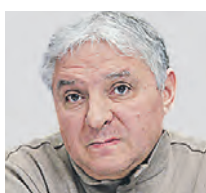
ИГОРЬ БУХАРОВ ПРЕЗИДЕНТ ФЕДЕРАЦИИ РЕСТОРАНОВ И ОТЕЛЕЙ РОССИИ

Я думаю, что для начала нужно понять, каким образом будут работать турецкие рестораны и кафе. С одной стороны, все понимают, что большинство иностранных компаний, особенно крупных, приостановили на неопределенное время свою деятельность в России. Некоторые передали бизнес под управление местных офисов, другие же навсегда ушли из