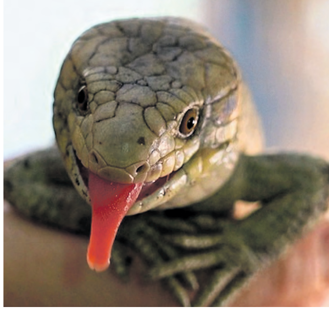
18 октября 18:36 Детеныш гигантских цепкохвостых сцинков родился в Московском зоопарке

Гигантские цепкохвостые сцинки обитают во влажных лесах. Часто эти рептилии встречаются в зарослях финусов. Большую часть времени они проводят в укрытии. Питаются листьями и побегами различных растений, в том числе и тех, которые считаются ядовитыми для других животных. Если сцинк чувствует угрозу, он начинает шипеть. А хвост они используют для того, чтобы висеть вверх тормашками. Живут цепкохвостые сцинки до 22 лет.