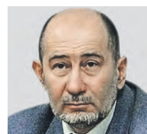
АЛЕКСАНДР БУЗГАЛИН ДОКТОР ЭКОНОМИЧЕСКИХ НАУК

Я думаю, сейчас не самый лучший момент для выхода иностранных компаний на российский рынок. Нашему малому бизнесу в данный момент и так сложно. Особенно в последние два года. Сначала «ударил» пандемия, потом СВО, частичная мобилизация и многочисленные санкции. Чтобы полностью не потерять те позиции, которые они заняли, нужно показать, что их продукция намного лучше, чем у иностранных производителей. Нам просто необходима независимость от иностранных партнеров. И надо сказать, что проблема была отнюдь не в качестве. Все дело в том, что потребители чаще всего «голосовали рублем» в пользу более брендовых ресторанов, кафе, марок одежды и так далее, пропуская мимо глаз наших производителей.