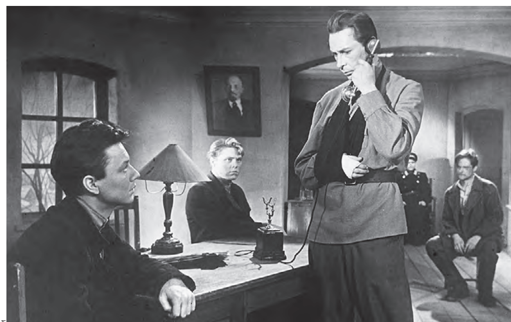
Кадр из фильма «Испытательный срок» 1960 года. Олег Табаков в роли Саши, Вячеслав Невинный в роли Виктора и Олег Ефремов в роли Жура (на первом плане слева направо)

Вчера в кинотеатре «Иллюзион» прошла ретроспектива фильмов с участием великого советского актера и режиссера Олега Ефремова, посвященная 95-летию со дня его рождения.