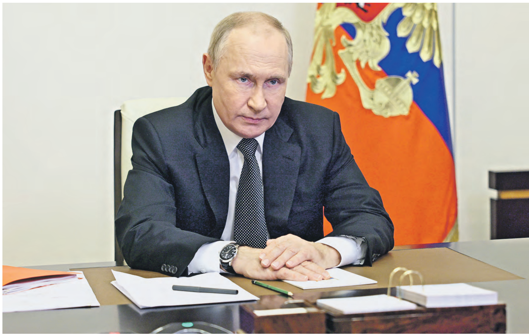
19 октября 2022 года. Президент РФ Владимир Путин проводит оперативное совещание с постоянными членами Совета безопасности РФ в режиме видеоконференции. На совещании приняты решения, позволяющие в полной мере защитить нашу страну от посягательств на ее безопасность и территориальную целостность

— Также речь идет об усилении охраны общественного