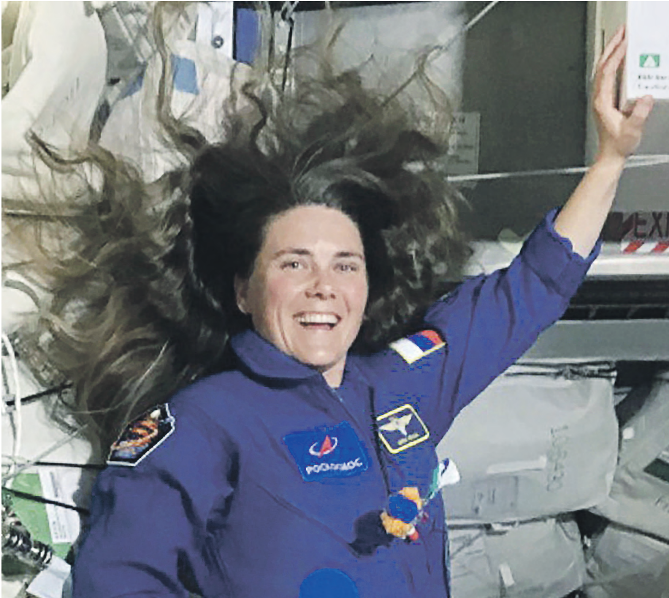
7 октября 2022 года. Космонавт Анна Кикина на Международной космической станции. Кикина прибыла на МКС в составе международного экипажа частного космического корабля Crew Dragon компании SpaceX

Проект первого автоматического полета к Юпитеру может стать реальностью через 10 лет