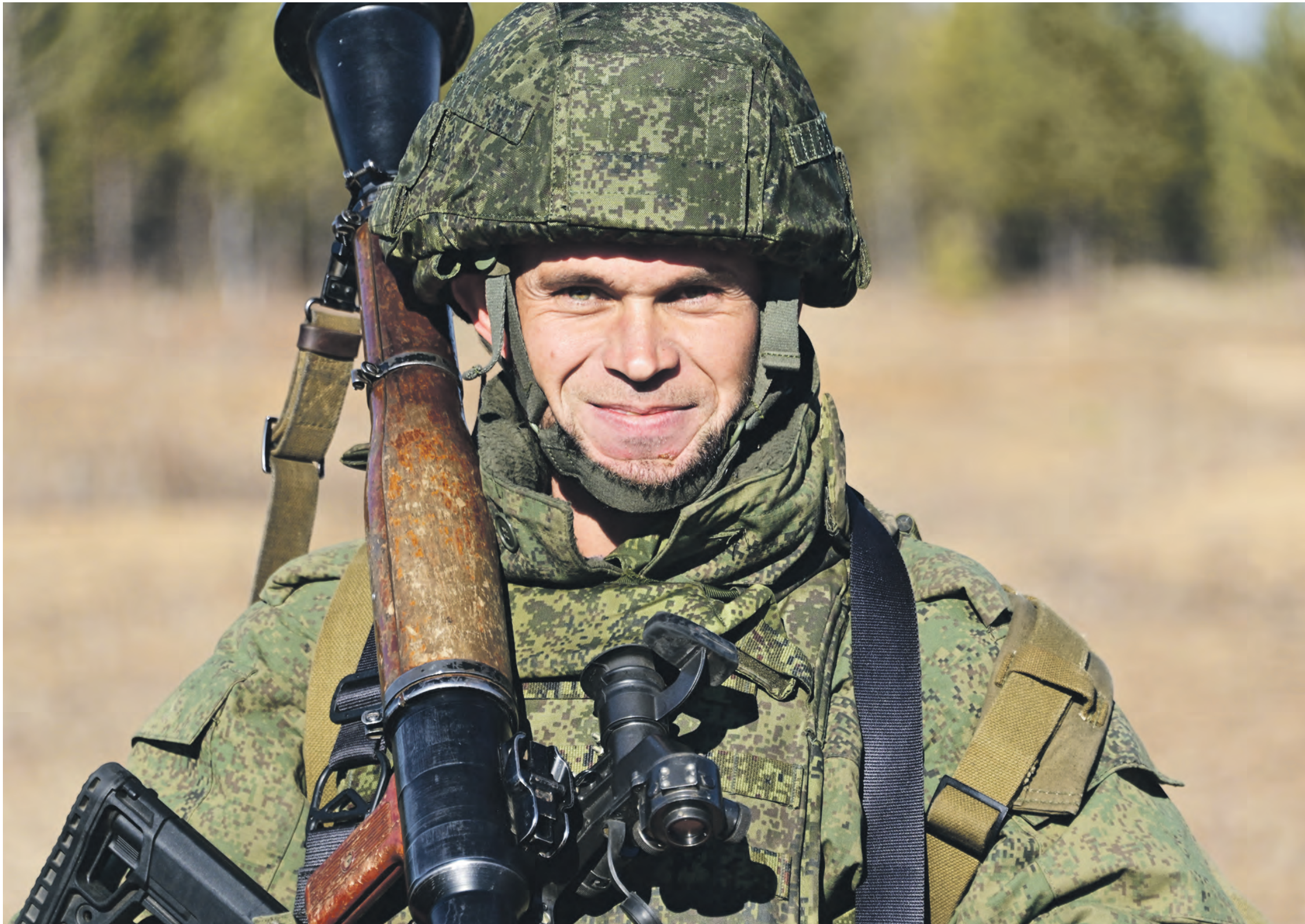
13 октября 2022 года. Военнослужащий из числа мобилизованных на занятиях по военной подготовке на полигоне Восточного военного округа в Забайкальском крае. После боевого слаживания бойцы поедут на фронт

Спецоперация выходит на новый этап. Возможно — решающий