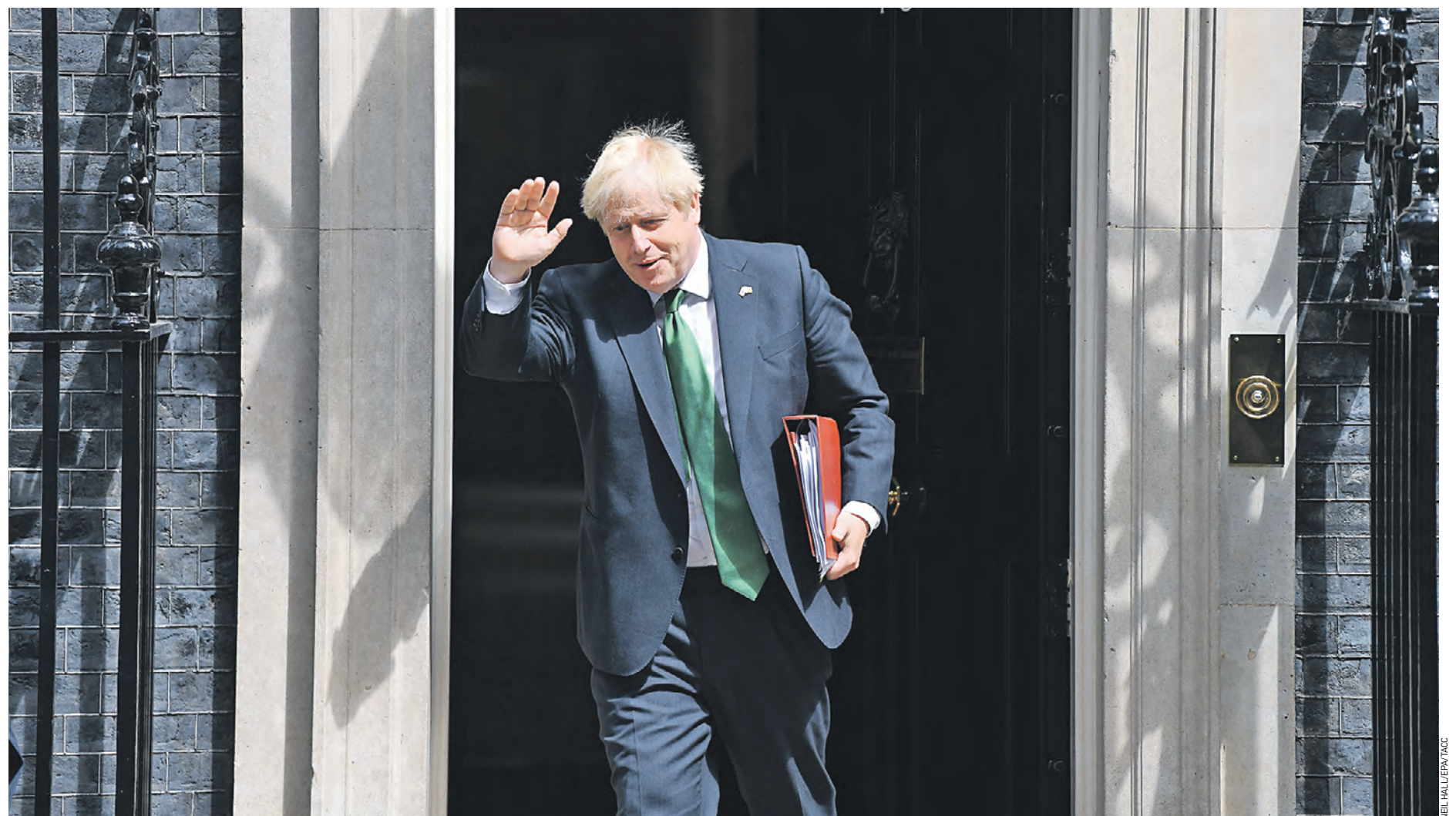
13 июля 2022 года. Премьер-министр Великобритании Борис Джонсон выходит из здания на Даунинг-стрит, 10, чтобы ответить на вопросы журналистов. Скоро Джонсону, кресло под которым зашаталось в том числе из-за антироссийских санкций, предстоит передать эту миссию своему преемнику на посту премьера