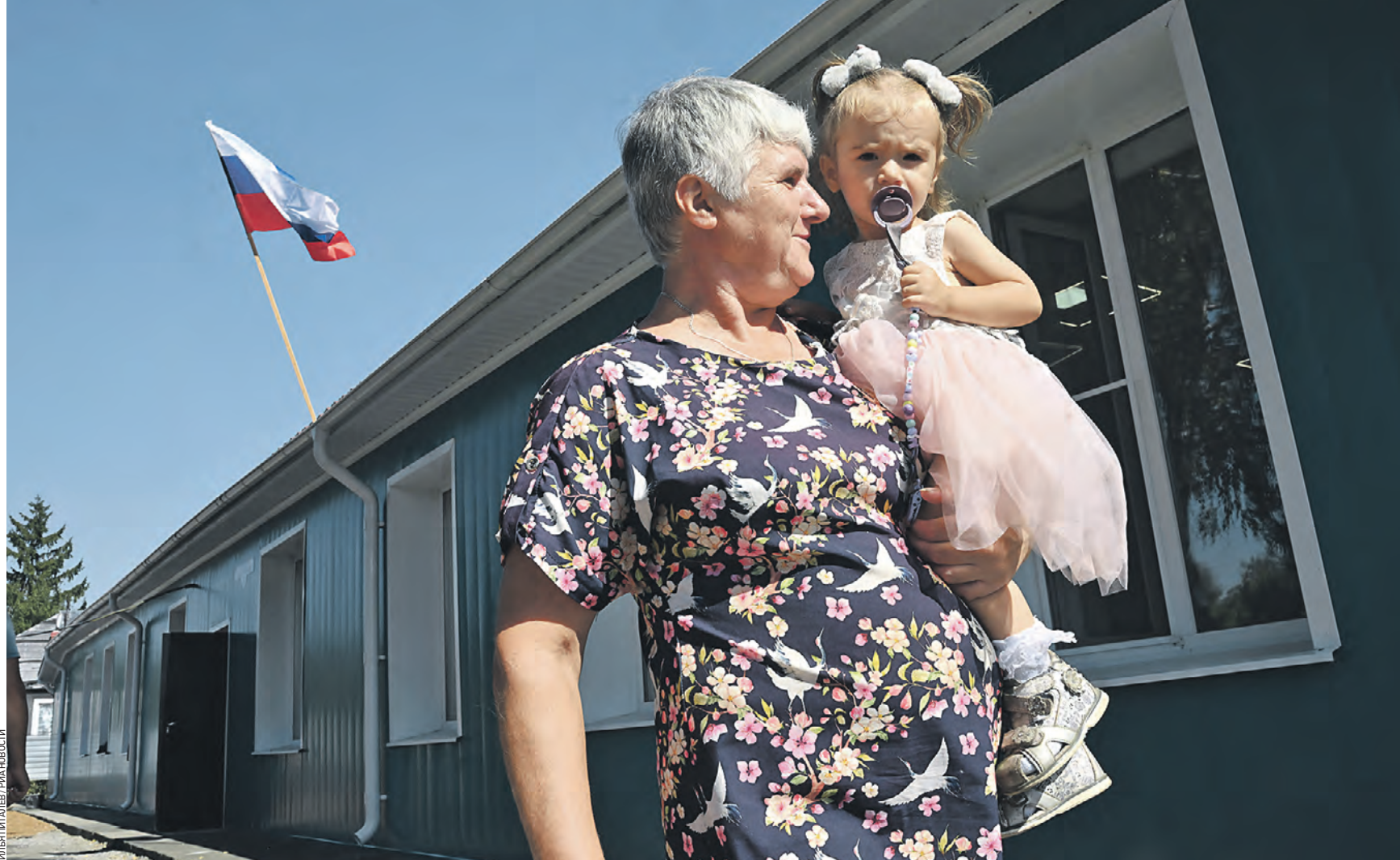
29 августа 14:47 Женщина несет на руках девочку в детский садик, открывшийся в Волноухе ДНР. На Донбассе продолжают готовиться к 1 сентября, несмотря на продолжающиеся атаки со стороны ВСУ. Союзные войска и главы администраций обеспечат детям безопасность

— Большая часть этих домов не подлежит восстановле-