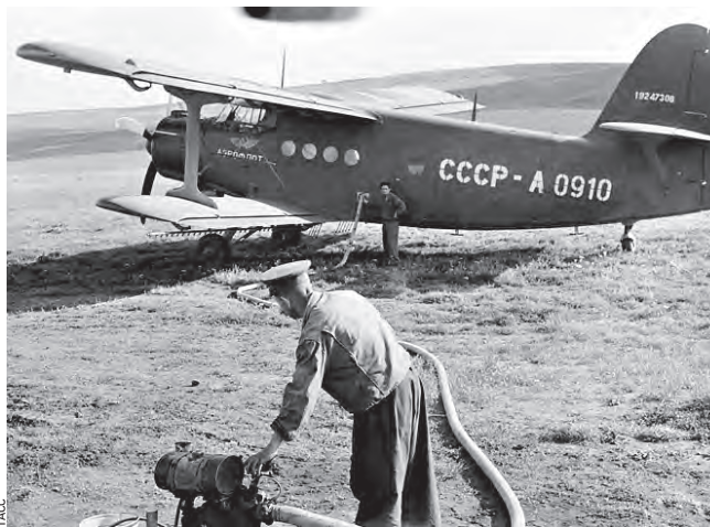
1958 год. Сельскохозяйственный самолет Ан-2СХ заправляют перед опрыскиванием полей от вредителей

1925 год. В Советском Союзе приняли декрет о введе-