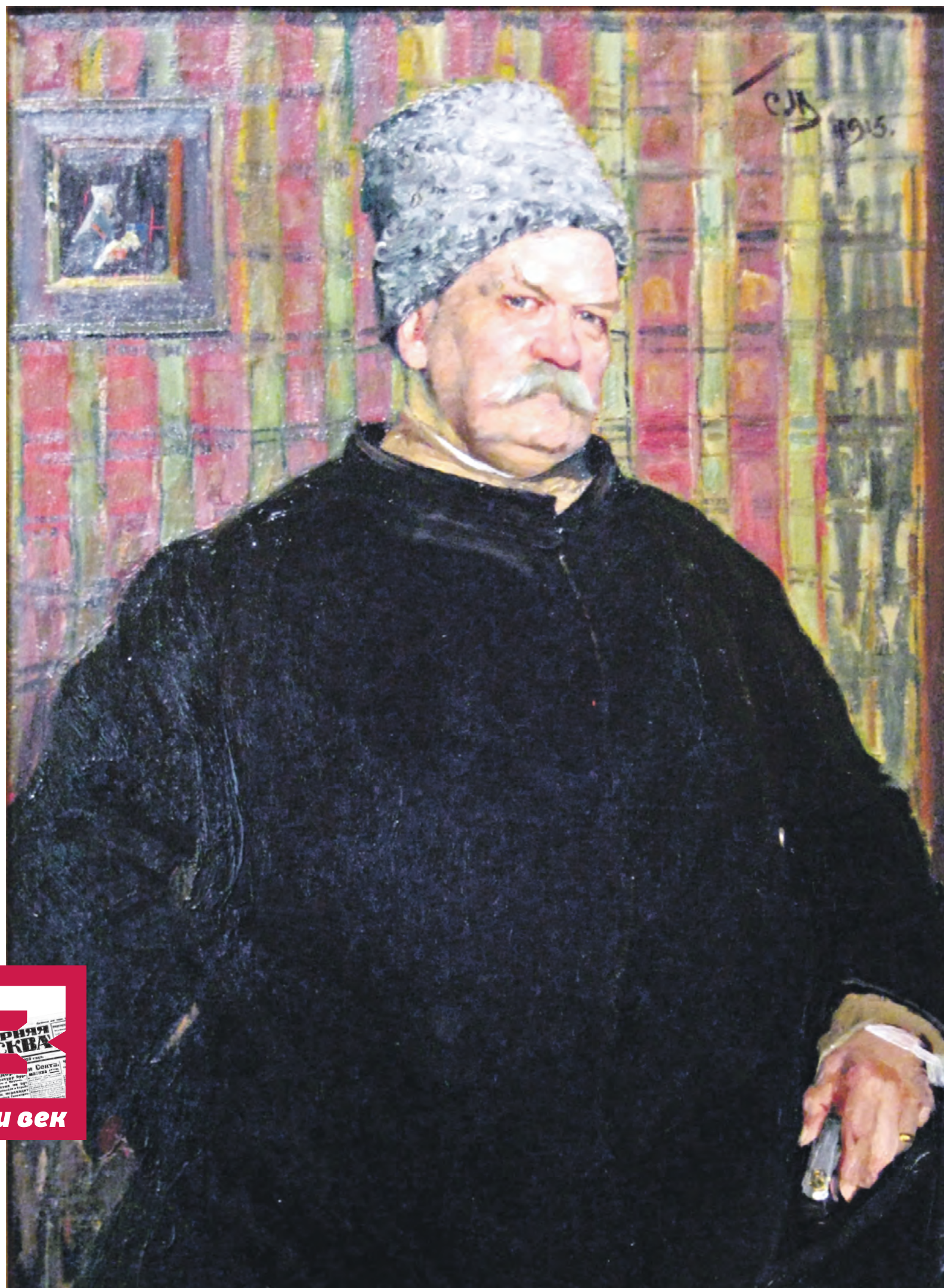
Портрет «короля репортеров» Владимира Гиляровского работы художника Сергея Малютина. 1915 год

Например, материал в номере от 28 апреля 1925 года под названием «Последняя Троя» был посвящен открытию Дома крестьянина на ме-