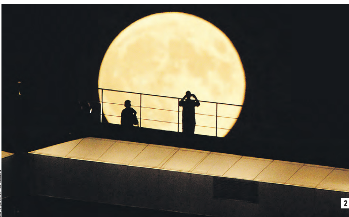
24 августа 2019 года, Судан. Отдыхающие наблюдают в любительский телескоп за природными явлениями в бухте Напсель, чьи пейзажи (почти пустынные равнины) напоминают поверхность другой планеты (1) 27 июля 2018 года, Грозный. Луна во время затмения на фоне высотного комплекса «Грозный-Сити» (2)