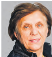
ТАТЬЯНА ОВЕЧКИНА ДВУХРАЗНАЯ ОЛИМПИЙСКАЯ ЧЕМПИОНКА ПО БАСКЕТБОЛУ

Мнение колумнистов может не совпадать с точкой зрения редакции «Вечерней Москвы»