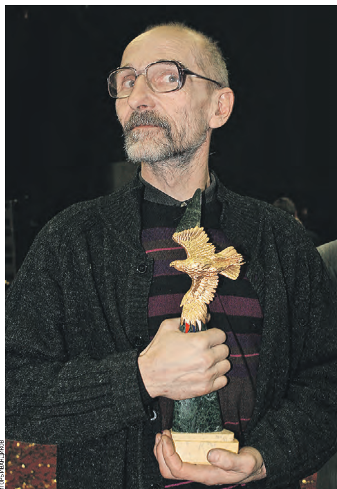
27 января 2007 года. Петр Мамонов получает «Золотого орла» за роль в фильме «Остров»

А вот учеба в Полиграфическом институте для Мамонова оказалась скучна. Лет десять он перебивался разными работками, но музыку не бросал никогда. Он будто пробовал ее на вкус, такую разную, и продолжил искать ее и потом, уже основав в 1983 году рок-группу «Звуки Му». Поклонники у коллектива появились сразу: он был необычным, пели о том, что видели за окном, о себе, о нас, и делали это с невероятным драйвом. Состав групп тасовался, как колода карт, но Мамонов не уходил из нее никогда. Его команда играла рядом с такими «бригадами», как «Аквариум», «Кино» и «Браво», но всегда занимала какую-то особую нишу. После распада коллектива Мамонов выступал сначала с братом, а потом один, все так же успешно. Количество фанатов музыканта возросло в разы после его актерских работ. Уже сыграв в культовой «Игле», Мамонов принял предложение сняться в фильме «Остров» Павла Лун-