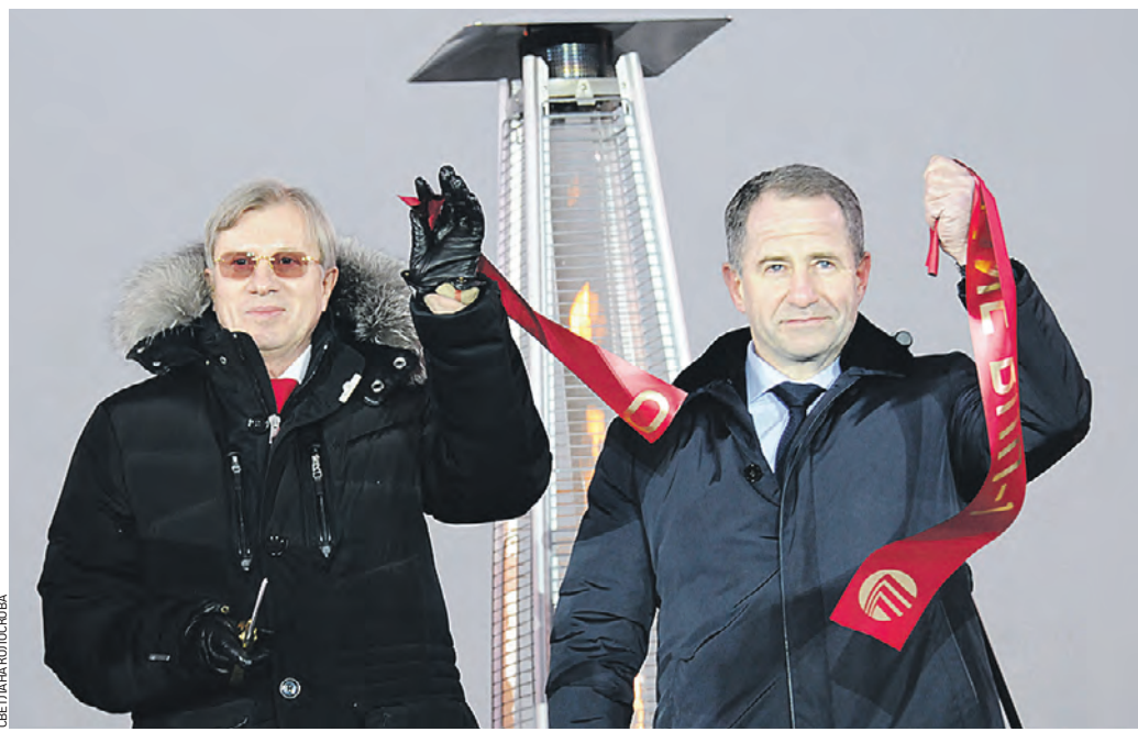
Вчера 15:32 Министр транспорта РФ Виталий Савельев (слева) и первый заместитель министра экономического развития Михаил Бабич открыли взлетную полосу № 1

Вчера в аэропорту Шереметьево после реконструкции открылась взлетно-посадочная полоса № 1. Строительные работы выполняли за десять месяцев.