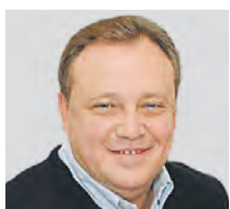
ЮРИЙ БАРЗЫКИН ВИЦЕ-ПРЕЗИДЕНТ РОССИЙСКОГО СОЮЗА ТУРИНДУСТРИИ

В Великобритании вирус мутировал, его заразность увеличилась на 70 процентов. Может увеличиться и смертность от заболевания. И нам необходимо принимать решительные меры. Для нас приоритетом всегда будут жизнь и здоровье наших граждан. Ведь без людей Россия — просто красивая территория с огромными природными пространствами. Я считаю, что временное приостановление авиасообщения с другими странами поможет уберечь здоровье граждан. Такая мера позволит не допустить распространения нового штамма коронавируса на территории страны.