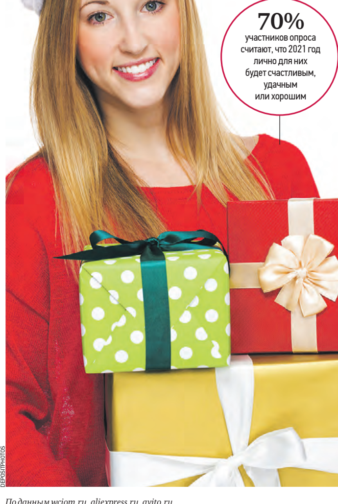
По данным wciot.ru, aliexpress.ru, avito.ru