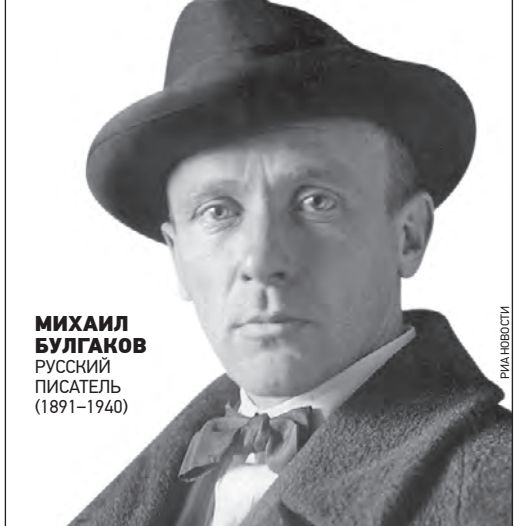
МИХАИЛ БУЛГАКОВ РУССКИЙ ПИСАТЕЛЬ (1891–1940)

Есть нужно уметь, и представлять, большинство людей вовсе есть не умеют. Нужно не только знать, что съест, но и когда и как.