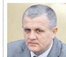
НИКОЛАЙ КОЛОМОЙЕВ ДЕПУТАТ ГОСУДЫ РОССИИ

Отношусь к этому плохо. В основном данный закон принимают и пишут те люди, которые в свое время были членами коммунистической партии или Всесоюзного Ленинского коммунистического союза молодежи. Это особенно неприятно. Я понимаю, если бы они были диссидентами, закаленными лагерями. Но в данном случае это совсем другое дело, когда все так переворачивается. В конце концов, сейчас мы живем по-другому, но когда подобное происходит, это выглядит недостойно. О приравнивании коммунизма к фашизму можно долго говорить и философствовать, но это не так, это неправда. И они сами знают это. Они хотят расстаться со своим советским прошлым не потому, что люди как-то от него пострадали, а потому, что, по их мнению, таким образом они смогут по-прежнему уйти от России и по-прежнему утащить Украину. Уже сейчас мы видим, что даже в условиях очень жесткого и незаконного режима, который держит людей в заточении без суда и следствия, сопротивление все же существует. Бюст маршала Жукова в Харькове, например, снова водрузили на место. А его сняли еще в рамках закона о денонмунизации. Так что все это позорные действия.