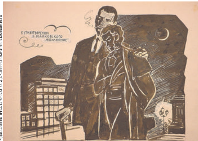
«Бойтесь пушкинистов!» — говорил Маяковский. Почему он говорил так, но бился за Пушкина, узнаем в этот уик-энд