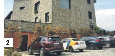
12 июля 14:00 Клиентов борделя таксисты возят мимо школы (1) Заведение, судя по числу припаркованных автомобилей, пользуется популярностью (2)

в управу района Строгино, чтобы там повлияли на ситуацию. — Поднимем этот вопрос на совещании, — заверили в ведомстве, порекомендовав гражданам обратиться с соответствующей жалобой и в правоохранительные органы.