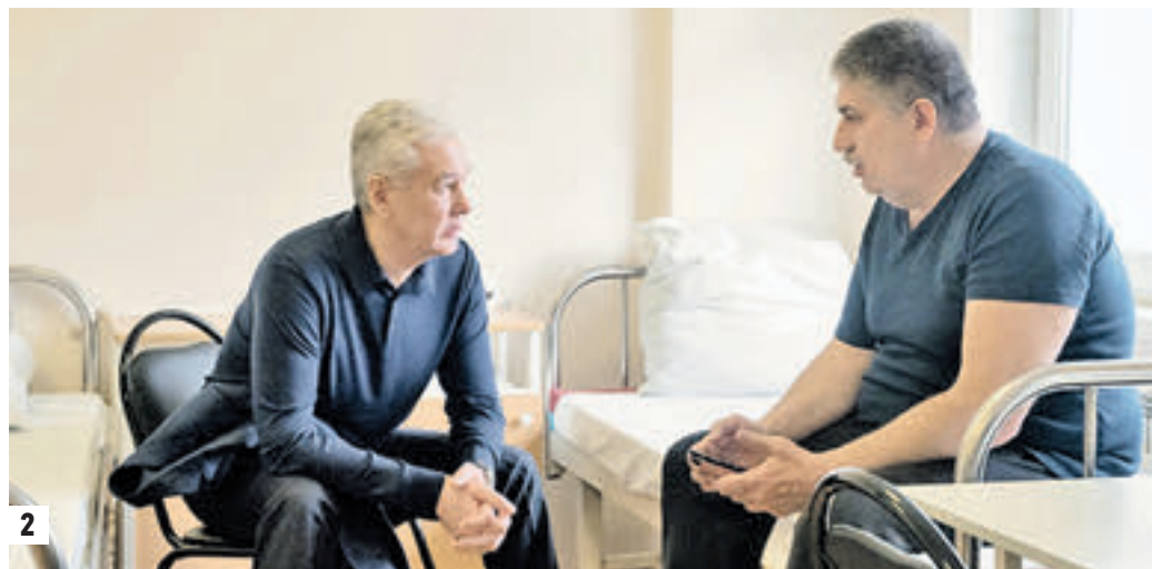
Вчера 09:32 Пересечение улиц Бибиревской и Костромской. Сотрудник ГБУ «Жилищник» распиливает поврежденное штормом дерево (1) 14:20 Мэр Москвы Сергей Собянин (слева) навестил пострадавшего во время урагана Игоря Придачина в Больнице имени Юдина (2)

Вчера мэр Москвы Сергей Собянин навестил пострадавших. В Больнице имени Юдина остаются те, кого штормовой ветер настиг в минувшие выходные на улицах города.