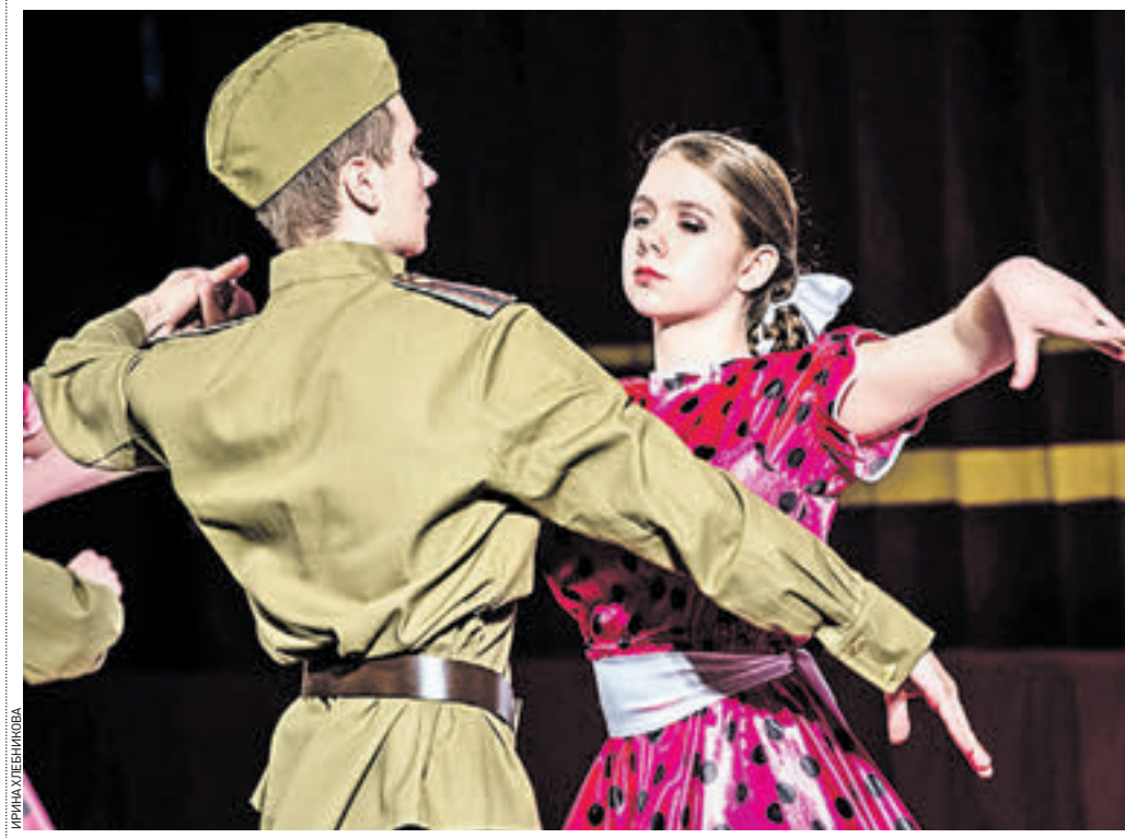
21 апреля 18:01 Ансамбль спортивного балетного танца «Дилайт» исполняет композицию «Мирное небо» на фестивале «Вальс Победы»

В этом году мы первый раз провели свое мероприятие на Поклонной горе. Это знаковое место не только для москвичей, но и для всех граждан нашей страны. Надеюсь, что это станет традицией. Ведь фестиваль не просто так получил свое название. Вальс — это танец почти народный, его знают и танцуют везде, особенно в нашей стране. И победа в Великой Отечественной войне тоже касается каждого.