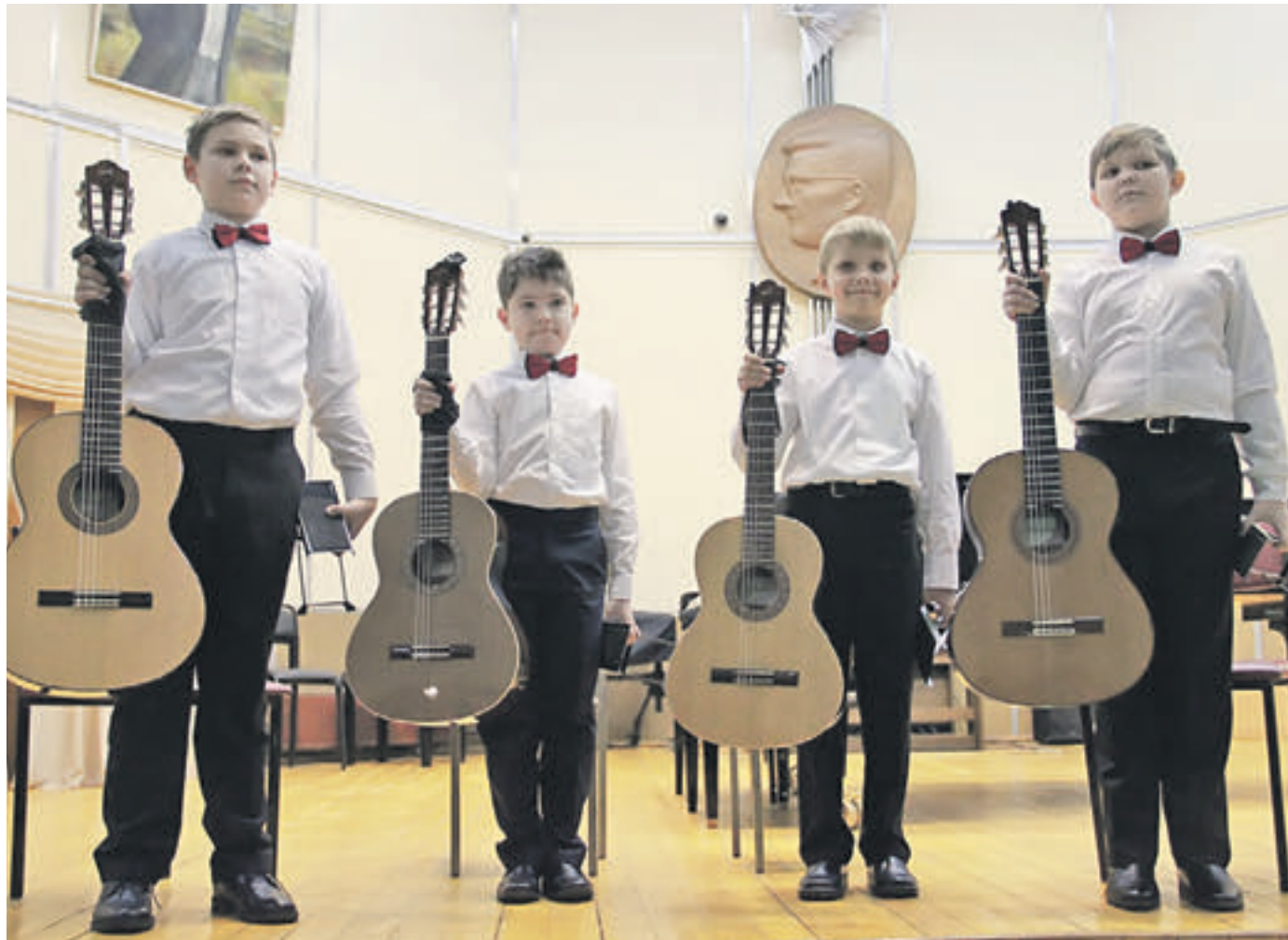
24 ноября 2017 года 12:48 Ученики Детской музыкальной школы имени Шостаковича на концерте, посвященном Дню матери. В ближайшее время в этой школе по поручению Сергея Собянина проведут ремонт и обновят музыкальные инструменты

Сергей Собянин рассказал о создании программы «Искусство — детям», в рамках