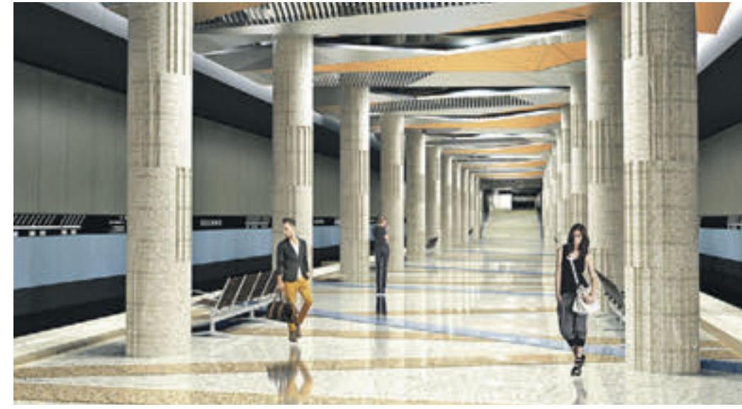
Проект станции «Косино» Кожуховской линии метро. Пересадку с нее можно будет сделать на Таганско-Краснопресненскую ветку

Второй участок Кожуховской линии — до «Авиамоторной» — запустят в следующем году. Его построят проходческий щит диаметром десять метров, которого окрестили «Лилия». Всего щит-гигант преодолеет под землей семь километров из 16. Он соорудит три перегона. После соединения двух отрезков линии строителям предстоит интегрировать классические однопутные тоннели, которые сооружают проходческие щиты диаметром шесть метров, двухпутными. Напомним, что отрезок от «Косино» до «Некрасовки» строят традиционным способом — тоннели располагаются по бокам платформ. Сооружение Кожуховской линии позволит облегчить движение по перегруженной Таганско-Краснопресненской ветке. Сократится и время пассажиров в пути, в среднем на 15–20 минут. Всего на ветке возведут восемь станций — «Нижегород-