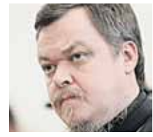
ВСЕВОЛОД ЧАПЛИН ПРОТОНАБЕР

зинформацию в российское информационное пространство. И ведь он смог в одиночку посеять панику в целой стране. Это заставляет задуматься о глубине проблемы.