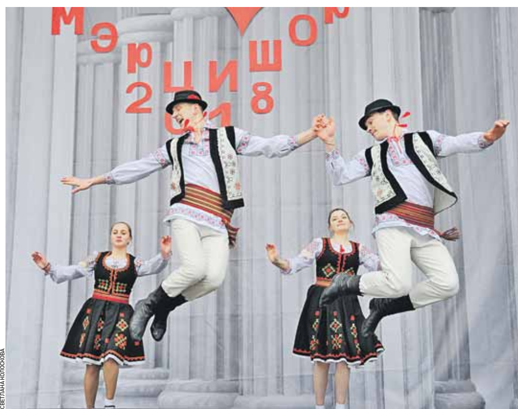
31 марта 14:15 На открытой сцене Екатерининского парка выступает ансамбль народного танца «Арзулугу»