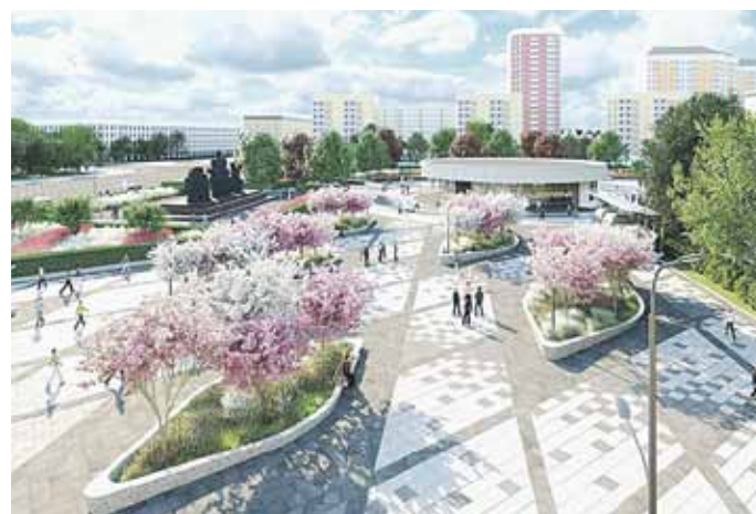
Проект благоустройства сквера у станции метро «Улица 1905 года», за который проголосовало большинство активных граждан

В пресс-службе «АГ» в минувшие выходные рассказали, что, согласно проекту благоустройства, площадь рядом со станцией разделит на три части. Через первую — транзитную — москвичи смогут попасть непосредственно в метро. Вторая часть — зеленая. На ней высадят деревья, кустарники, обустроят клумбы и газоны. Третья часть площади будет предназначена для отдыха и торговли. Помимо этого, на новой площади полностью заменят покрытие, установят лавочки и урны. Всего в голосовании за проекты благоустройства приняли участие более 11,5 тысячи человек.