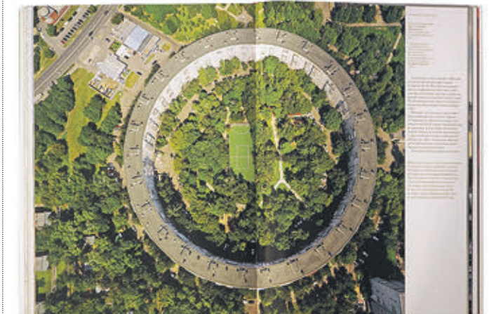
Иллюстрация из книги. Вид сверху на дом-кольцо, построенный к Московской олимпиаде