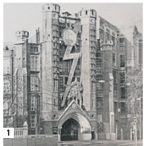
Иллюстрации из книги с изображением прошлого и настоящего Московского электростанции. Так здание выглядело в середине 1920-х годов (1) Современное здание электростанции. Около него начинается узкоколейная дорога, протяженность которой несколько километров (2)

«Мы привыкли, что московская мистика — театрализованная экскурсия по Хитровке и Грачевке, попытки найти пресловутое «Метро-2», прогулки вокруг Патриарших с надеждой встретить незнакомца в костюме. Массовая культура давно приватизировала слово «мистика», дав список из пятнадцати каноничных московских привидений, и чувство холода по спине успешно коммерциализировала, как и многое в нашем непростом веке. Но Яков Брюс по-прежнему рассекает небо, а в западной части Филевского парка находится «проклятое место», привлекавшее исследователей еще в XIX веке». — «Какими бы древними ни казались археологические артефакты, появление поселений датируется по письменным упоминаниям. Началом столицы считается 1147 год, когда в летописи появилось сообщение про «пир силен», который был устроен в городе «Москов» Юрием Долгоруким и его союзником, князем Святославом Ольговичем». — «С нашествием Наполеона прямо или косвенно связан столичный пожар, такой крупный, что его обычно упо-