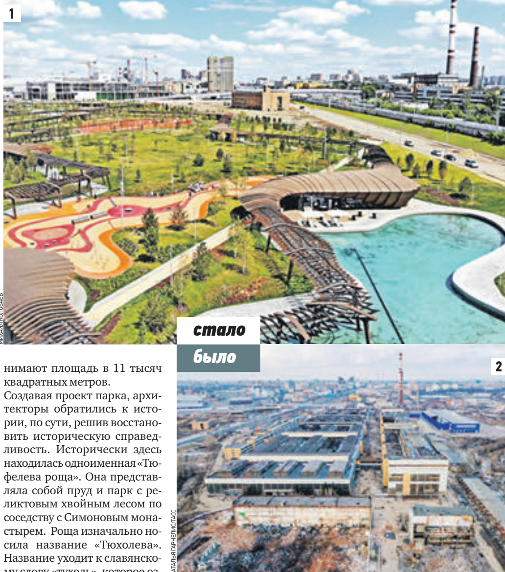
СТАЛО 26 июня 2018 года. Съемка созданного парка «Тюфелева роща» с прудом за несколько недель до его открытия (1) БЫЛО 18 марта 2017 года. Механосборочный цех № 6 на территории бывшего завода имени Лихачева (2)

нимают площадь в 11 тысяч квадратных метров. Создавая проект парка, архитекторы обратились к истории, по сути, решив восстановить историческую справедливость. Исторически здесь находилась одноименная «Тюфелева роща». Она представляла собой пруд и парк с реликтовым хвойным лесом по соседству с Симоновым монастырем. Роща изначально носила название «Тюхолева». Название уходит к славянскому слову «тухоль», которое означает «затхлость». Историки объясняют это тем, что парк находился в низинной, болотистой территории рядом с Московской-рекой. В XVII веке территория входила в состав царских угодий. Поохотиться сюда приезжали русский царь Алексей Михайлович и императрица Екатерина II. «Тюфелева роща» появилась и в повести «Бедная Лиза» писателя Николая Карамзина. После публикации роща стала одним из знаковых мест для прогулок, а пруд стали называть Лизинным.