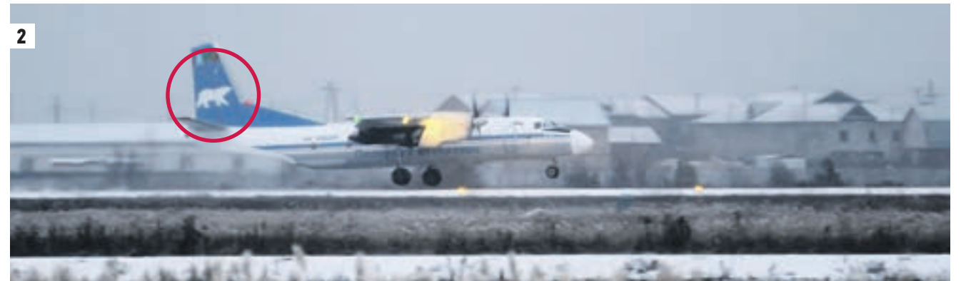
4 октября 2017 года. Медвежонка перевезли в клетке на военный аэродром Мигалово. В ногах зверя — тот самый кусок брезента (1) Зверя из Среднеколымска в Якутск перевозил самолет с изображением полярного медведя (2) Во время перевозки Медвежонка просовывала любопытный нос (3) Медведь лакомится куском мяса (4)