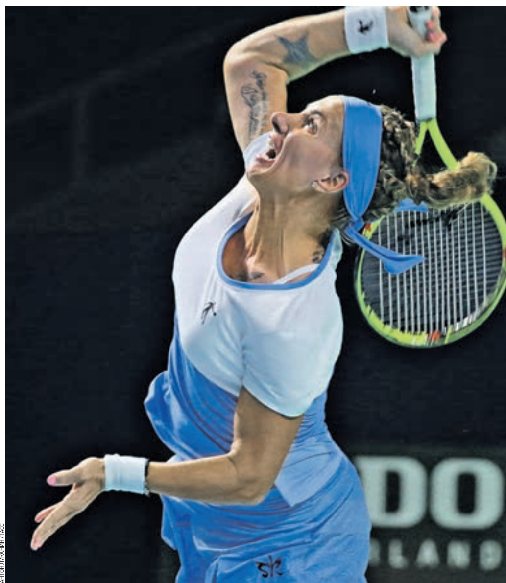
20 октября 2016 года 14:00 В прошлом году «Кубок Кремля» второй раз подряд выиграла столичная теннисистка Светлана Кузнецова. В этом году она вновь поборется за трофей