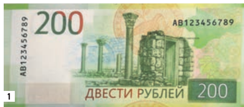
На обороте 200-рублевой банкноты — вид на Херсонес Таврический (1). Новые деньги сделают наличные расчеты более удобными и, по словам главы Центробанка, потеснят купюры смежных номиналов — 100 и 1000 рублей