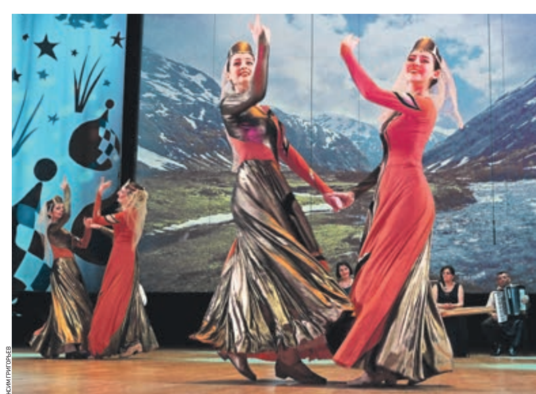
29 октября 15:45 Хореографический ансамбль «Айаса» исполняет армянский народный танец «Сарери овин мернем» («Жизнь отдаю за тени наших гор») на сцене Московского дворца пионеров