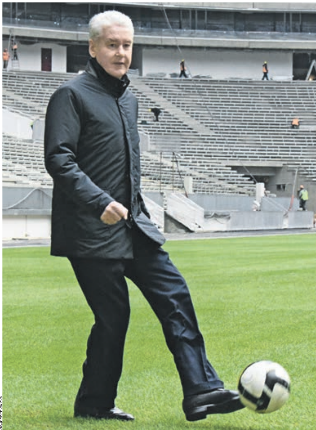
28 октября 11:03 Мэр Москвы Сергей Собянин первым опробовал новый уникальный газон на стадионе «Лужники». На ровном поле мяч катится по той траектории, по которой его направил футболист

Всего в 2018 году, во время чемпионата мира по футболу, Москва примет 12 матчей, 7 из которых, включая один из