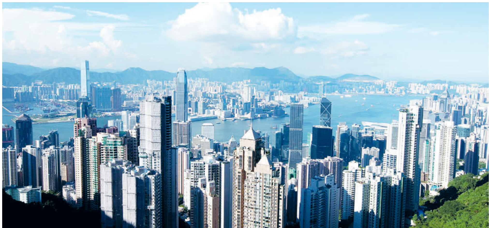
Современный Сянган устремлен в будущее.

На самом деле в ст. 23 Основного закона Сянгана, вступившего в силу еще в 1997 году после создания специального административного района, четко предусмотрено, что Сянган должен принять локальный закон, карающий любые деяния против государства, включая государственную измену, сепаратизм, подстрекательство к мятежу, подрывную деятельность в отношении Центрального народного правительства КНР и незаконное получение сведений, составляющих государственную тайну. В нем должен был быть запрет зарубежным политическим организациям и объединениям осуществлять политическую деятельность в Сянгане, а также запрет политическим организациям и объединениям Сянгана контактировать с зарубежными