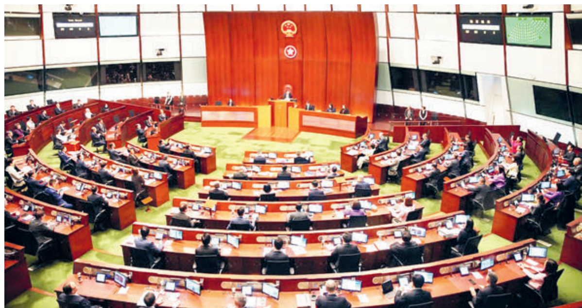
19 марта, Сянган, Китай. Законодательный совет САР Сянган единогласно принимает в третьем чтении Закон «О национальной безопасности».

политическими организациями и объединениями. Однако ввиду постоянного противодействия со стороны внешних враждебных сил и локальных антикитайских сил, стремящихся пошатнуть политическую стабильность Сянгана, приняты ст. 23 Основного закона САР Сянган раз за разом переносило и в итоге так и не было завершено. И уже после волнений, потрясших Сянган в 2019 году, пришло осознание, что защита государственного суверенитета и безопасности, интересов дальнейшего развития специального административного района – это высочайшие принципы политики «Одна страна – две системы» и без обеспечения защиты государства о процветании и стабильности в регионе не может быть и речи. Лишь с принятием Закона КНР «О защите государственной безопасности САР Сянган» специальный административный район смог вернуться на трек мирного и гармоничного существования.