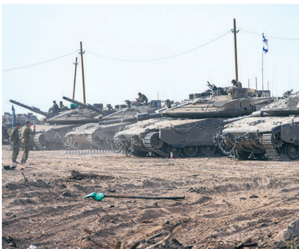
Израильские танки в Газе остановились. Надолго?

На территории Газы после отъезда основной части войск Израиля останется лишь 933-я пехотная бригада «Нахаль» и 162-я дивизия на севере. В круг обязанностей первой входит защита «коридора Нецарим» от границы Газы с Израилем до побережья Средиземного моря. Согласно новой тактике, самыми эффективными признаны точечные рейды после получения разведанных, а ЦАХАЛ будет возвращаться в Хан-Юнис только «по мере необходимости». Как заявлено, похожие операции продолжатся в других районах, в том числе в Рафахе.