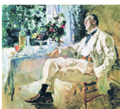
К.А. Коровин. Портрет Федора Шаляпина, 1911 год.

В Париже скончался Федор Шаляпин, певец, принесший всемирную славу русскому оперному искусству. В дни прощания с прославленным басом его голос звучал по всем радиостанциям мира, кроме советских. «Известия» тог-