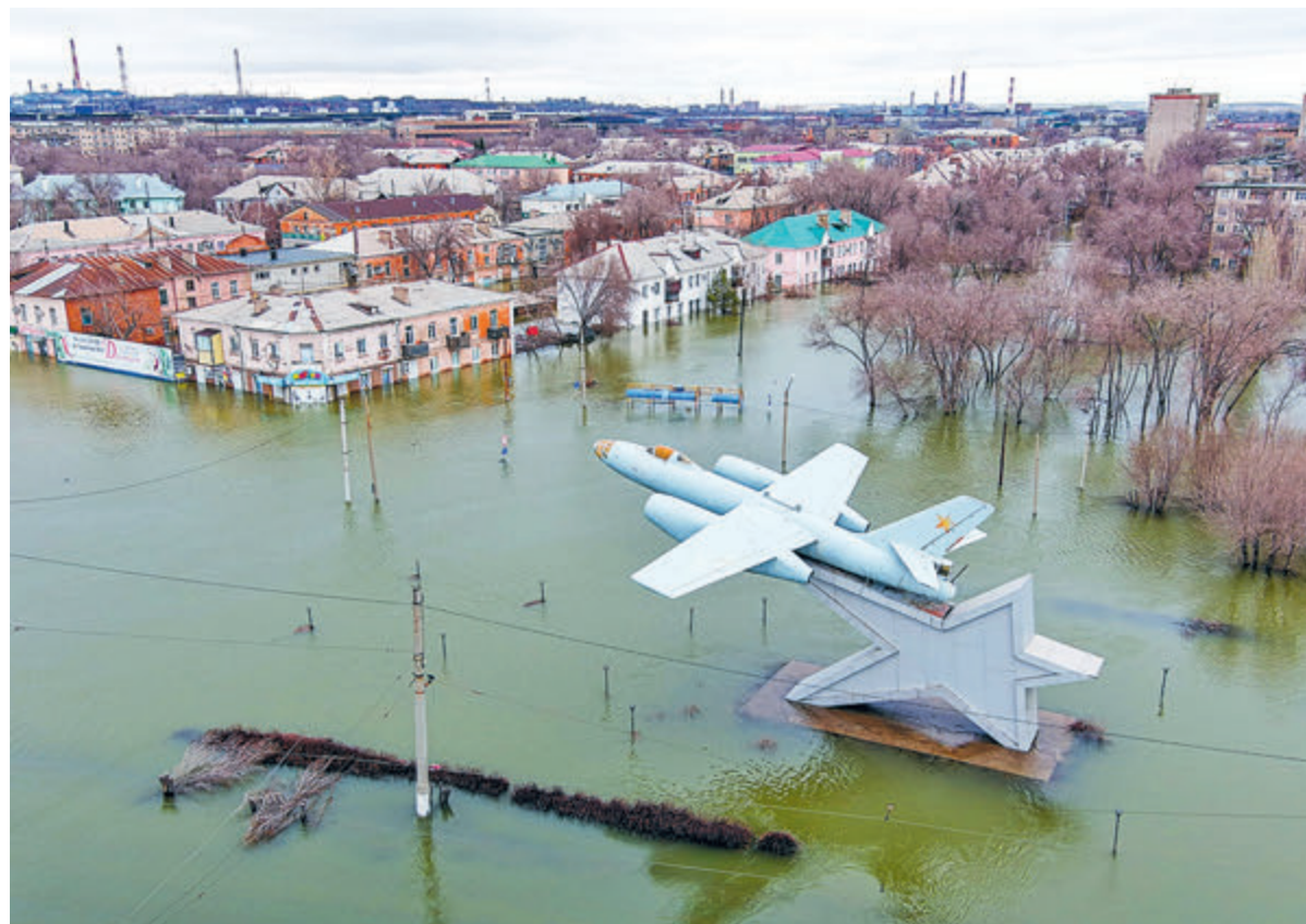
Орск. Вид на затопленную площадь Гагарина.

А ведь бедствие прогнозировалось. Еще в июне 2020-го Ростехнадзор выявил 38 нарушений при содержании дамбы и нало-