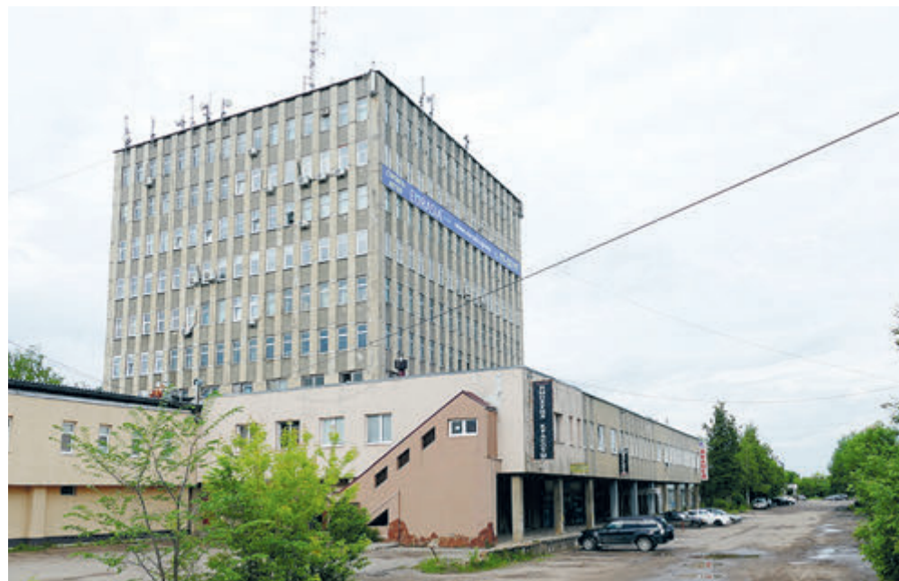
В заводууправлении ИЗТС теперь хозяйничают коммерсанты.

После 2014 года выяснилось, что купить все, что стране необходимо, невозможно даже за дорого. Для обеспечения суверенитета нужна собственная промышленность, тем более станкостроительная – основа основ любого производства. Сейчас, когда идет война, в России, увы, нет современных станков в достаточном количестве и по приемлемым ценам. Закупки в недружественных странах затруднены или экономически невыгодны. Китайское оборудование или так же дорого, или недостаточно качественное.