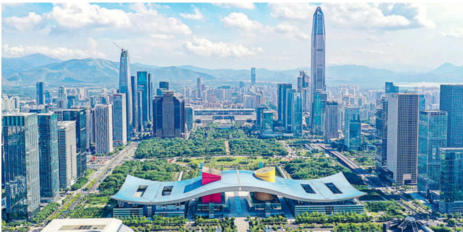
Специальная экономическая зона Шэньчжэнь – полигон высоких технологий.

Постоянное очернение других не делает лучше самих себя, тем более не сможет помешать ходу стабильного и здорового развития экономики Китая и развитию взаимовыгодного делового сотрудничества Китая и России. Перед лицом фактов «экономический коллапс Китая» снова превратится в фейк. Выдумки о кризисе большего числа российских потребителей. Сотрудничество по крупным проектам в области