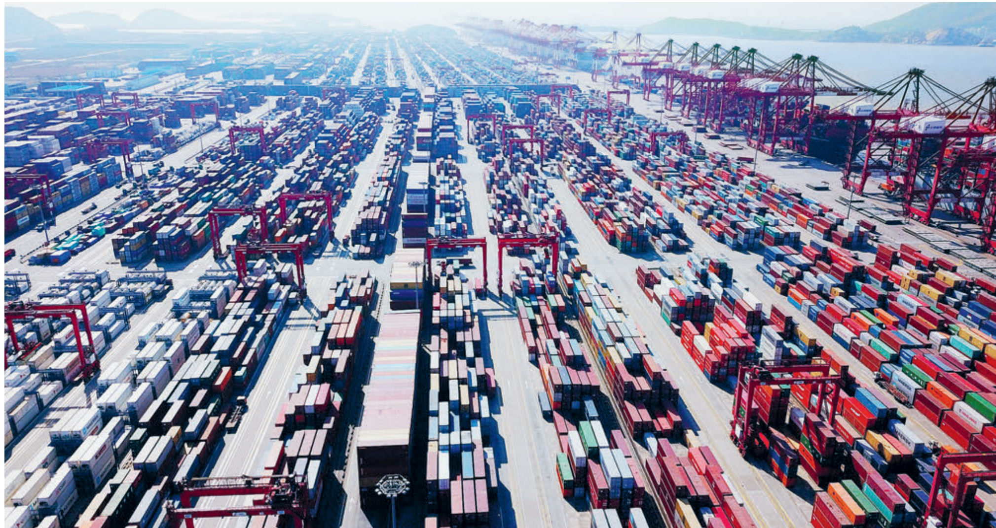
Так выглядит крупнейший в мире автоматизированный контейнерный глубоководный порт Яншань в Шанхае.

Прошедший, 2023 год стал первым годом, когда экономика Китая возобновила свой рост после принятия новых мер по профилактиве и контролю эпидемии. В этом году, столкнувшись с хаотичной и переплетенной международной обстановкой и многочисленными трудностями и вызовами в процессе восстановления внутренней экономики, Центральный комитет КПК во главе с товарищем Си Цзиньпином и повел всю партию и представителей всех этнических групп к всестороннему претворению в жизнь духа XX съезда