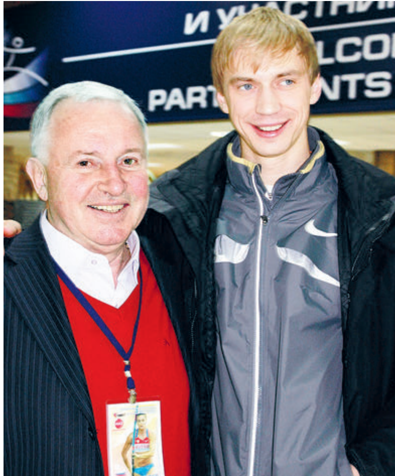
Между этими снимками более 30 лет. Вверху: старейшина тренерского цеха с олимпийским чемпионом Андреем Сильновым.