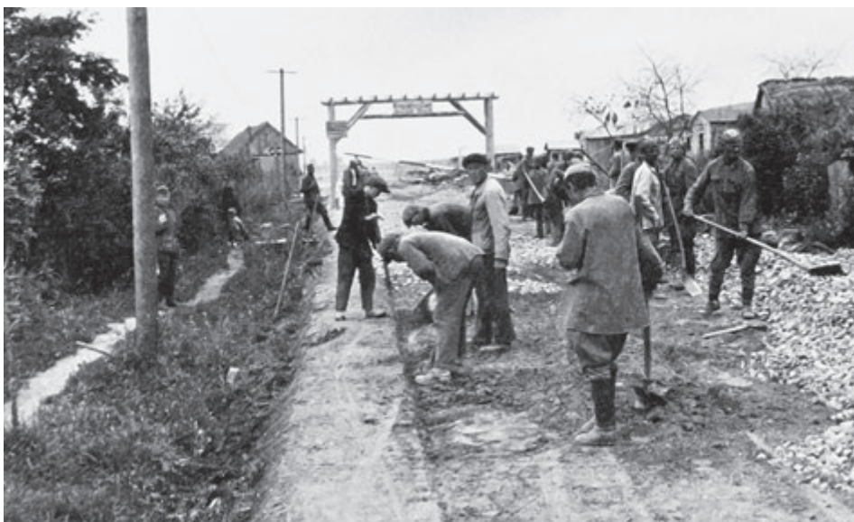
К советским пленным здесь относились как к скотообразной массе. Их даже хоронили не по-людски – закапывали во рвах. Сколько красноармейцев нашли здесь последний покой, не установлено. Неизвестны и их имена.

Потомука нашедших здесь свой конец иностранцев все еще приезжают в Калининград и даже кого-то находят.