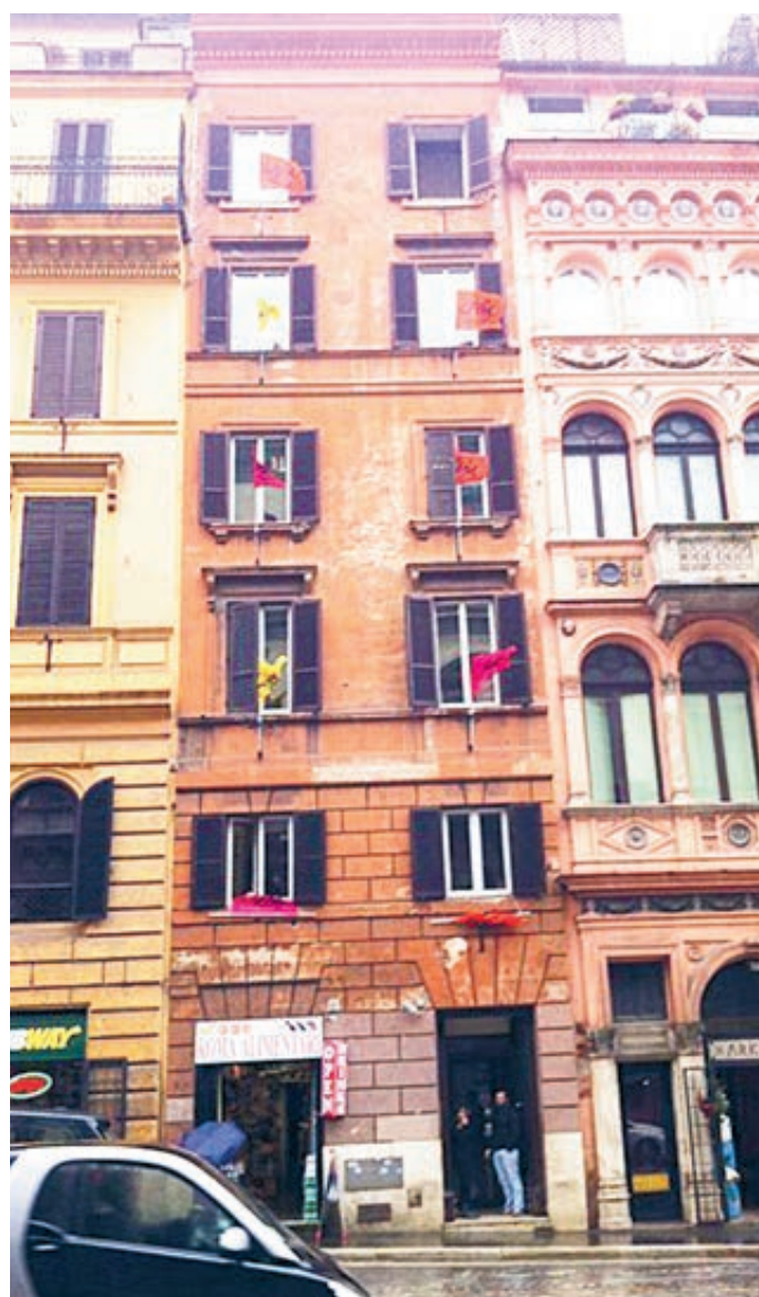
В здании, где уже больше 10 лет базируется крупнейшая в Италии антимафиозная организация, располагался... бордель. Но дом был отобран у мафии и используется по другому назначению.

сий, в ПФР. «В целом объем таких средств в 2019–2024 годах может составить 1,8 млрд рублей», – говорится в записке со ссылкой на данные Федерального казначейства. Речь шла о «конфискованных средствах, полученных в результате совершения коррупционных правонарушений, а также вырученных от реализации конфискованного имущества».