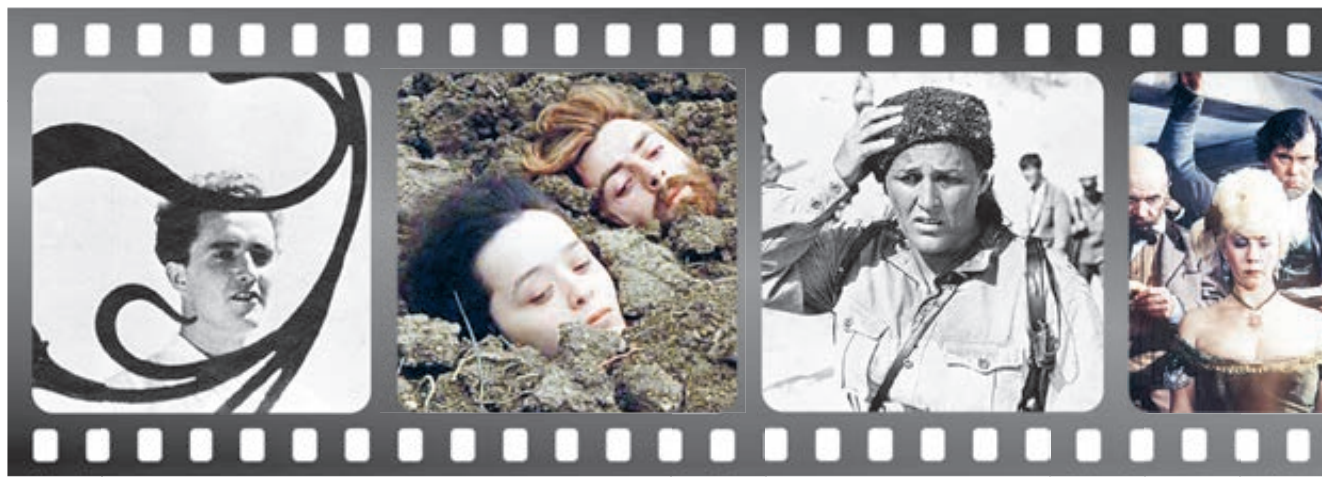
Кадры из фильмов: «Строгий юноша», «Покаяние», «Комиссар», «Интервенция».

Легенды в основном куются на материале советской и глубокой российской истории – сегодня властям гордиться особенно нечем. И о том, что горстка олигархов и высокопоставленных чиновников владеет основными материальными ресурсами страны, а половина населения живет в униженной бедности, вы из нашего кино (не только игрового, но и документального) не