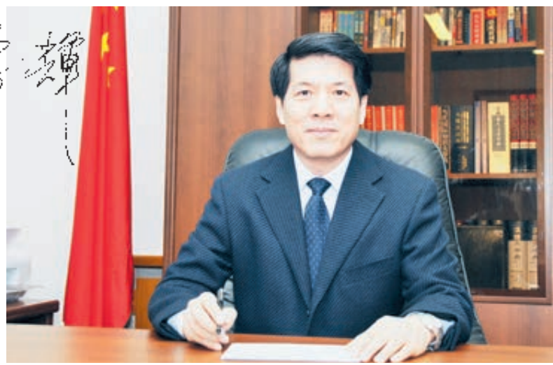
Посол Ли Хуэй.

кументов, касающихся двустороннего сотрудничества в сферах торговли, энергоресурсов, науки, техники, космонавтики, сельского хозяйства, образования и т. д. «Совместное заявление Российской Федерации и Китайской Народной Республики о развитии отношений всеобъемлющего партнерства и стратегического взаимодействия, вступающих в новую эпоху», подробно и пол-