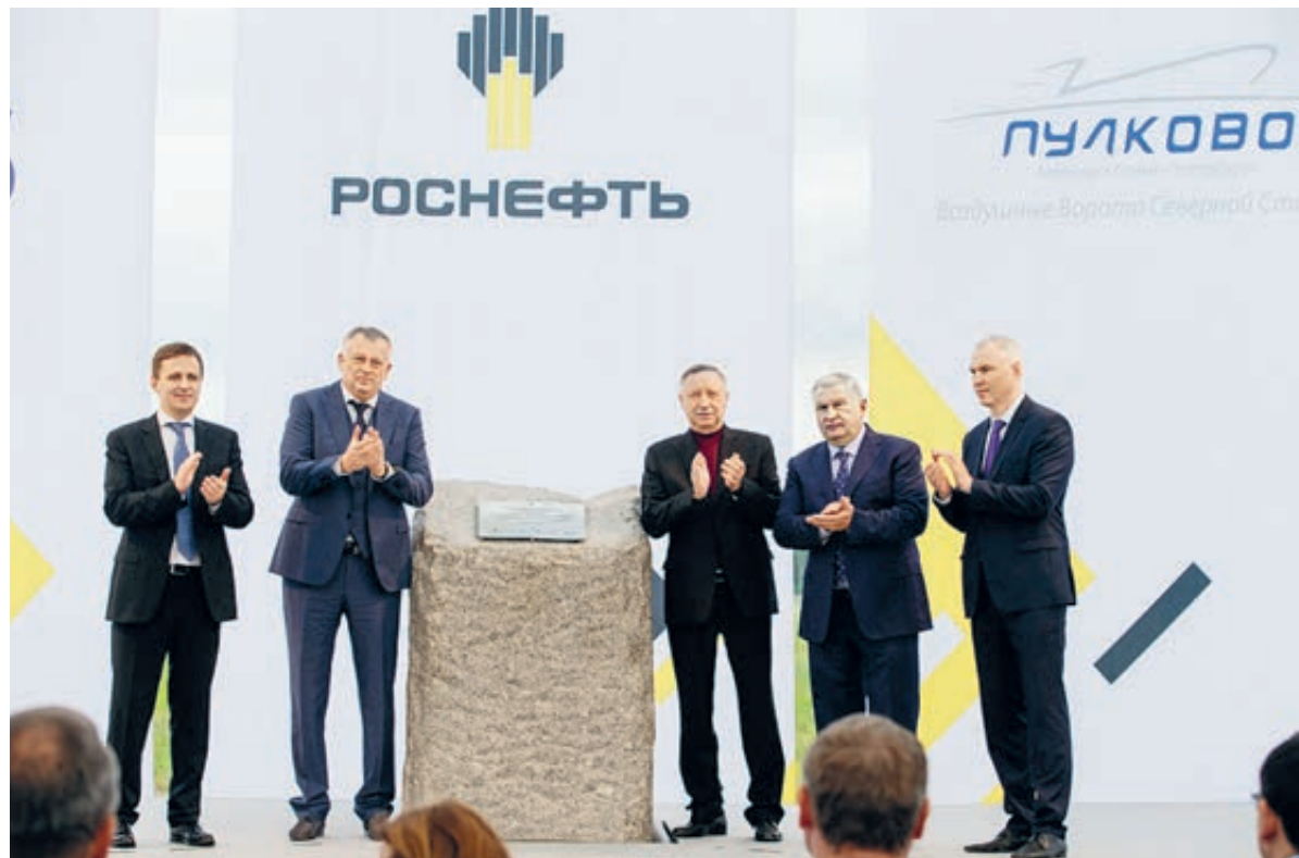
Торжественная закладка первого камня в фундамент ТЗК «Роснефти» в аэропорту Пулково.

«Строительство ТЗК Пулково – продолжение проектной работы компании по развитию транспортной региональной инфраструктуры, – заявил на торжественной церемонии глава «Роснефти» Игорь Сечин. – Инвестиции в данный проект составят более 3 млрд рублей. Новый ТЗК мощностью 300 тысяч тонн авиакеросина в год будет полностью соответствовать современным мировым стандартам и значительно повысит привлека-