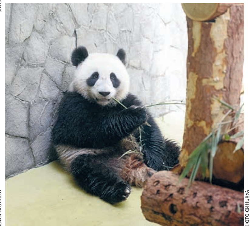
Китайская панда в Московском зоопарке.

Оглядываясь в прошлое, можно сказать, что китайско-российские отношения переживали трудные времена, а теперь они вернулись на правильный путь развития. Глядя в будущее и двигаясь вперед бок о бок, Китай и Россия рисуют красивую схему развития и возрождения двух стран. Сосредоточив внимание на мире, совместными усилиями Китай и Россия внесли важный вклад в региональное экономическое развитие и обеспечение мира и стабильности во всем мире. Мы надеемся, что под руководством председателя КНР Си Цзиньпина и президента РФ Владимира Путина китайско-российские отношения всеобъемлющего партнерства и стратегического взаимодействия, вступающие в новую эпоху, будут и далее укрепляться, прагматичное сотрудничество между двумя странами приобретет новые проорывы и принесет больше пользы народам двух стран и всего мира.