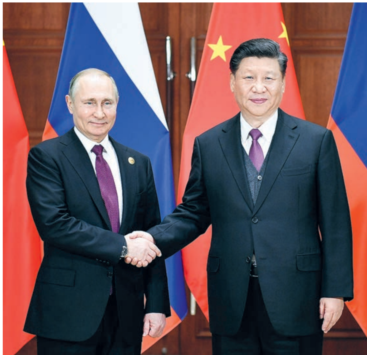
Встречи председателя КНР Си Цзиньпина и президента РФ Владимира Путина стали регулярными.

Сустановления китайско-российских отношений «равноправного доверительного партнерства, направленного на стратегическое взаимодействие в XXI веке», до «китайско-российских отношений всеобъемлющего партнерства и стратегического взаимодействия, характеризующихся взаимным доверием, поддержкой, совместным процветанием и дружбой из поколения в поколение», «нового этапа китайско-российских отношений всеобъемлющего партнерства и стратегического взаимодействия в новую эпоху», в этом процессе мы с удовлетворением заметили, что двусторонние отношения твердым шагом продвигаются вперед и уже поднялись на новую беспрецедентную высоту. Это также стало наиболее важным политическим достижением визита председателя КНР в Россию. Си Цзиньпин подчеркнул: «Как раньше, в настоящее время, так и в будущем Китай и Россия являются добрыми соседями и неразделимыми настоящими партнерами», «мы имеем уверенность и способность на основе 70-летнего опыта и результатов продвинуть китайско-российские отношения в новую эпоху на более высоком уровне и с большим развитием». Президент Владимир Путин отметил, что за 70 лет с момента установления дипломатических отношений российско-китайские отношения испытали очень непростой путь развития, две стороны взаимно поддерживают и помогают друг другу, стимулируют развитие двусторонних отношений и добились высочайшего уровня в истории. Путин заверил, что российская сторона готова вместе с китайской сто-