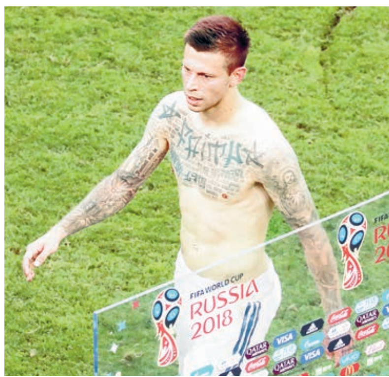
Таких ученых у нас еще не было.

А Влад Дракула? Нет, не книжный вампир, придуманный Брэмом Стокером, а реальный правитель Валахии в XV веке. В молодости он выиграл престижный турнир в Нюрнберге, превзойдя всех в умении владеть мечом и тупым копьём. Был лучшим наездником и пловцом – и при этом