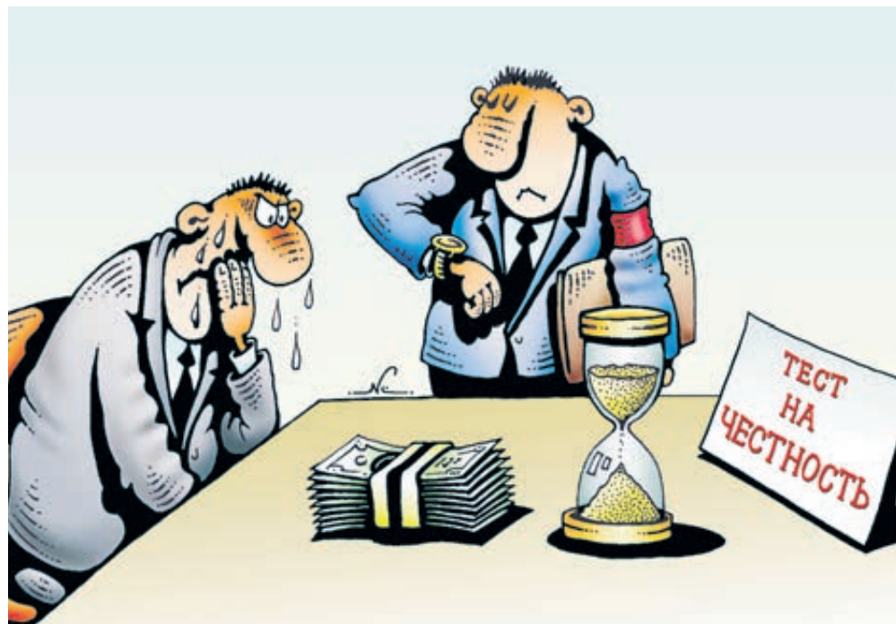
ИЛЛЮСТРАЦИЯ ИГОРЯ КИЙКО/CARTOONBANK.RU