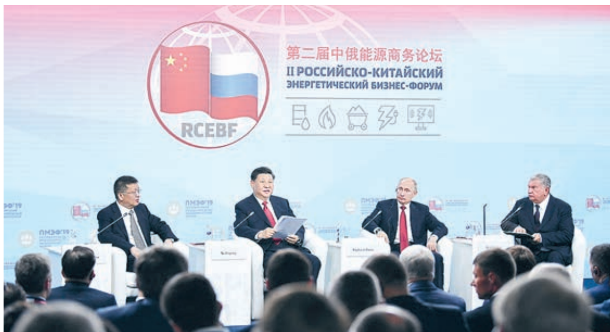
Лидеры КНР и РФ приняли участие в энергетическом форуме.