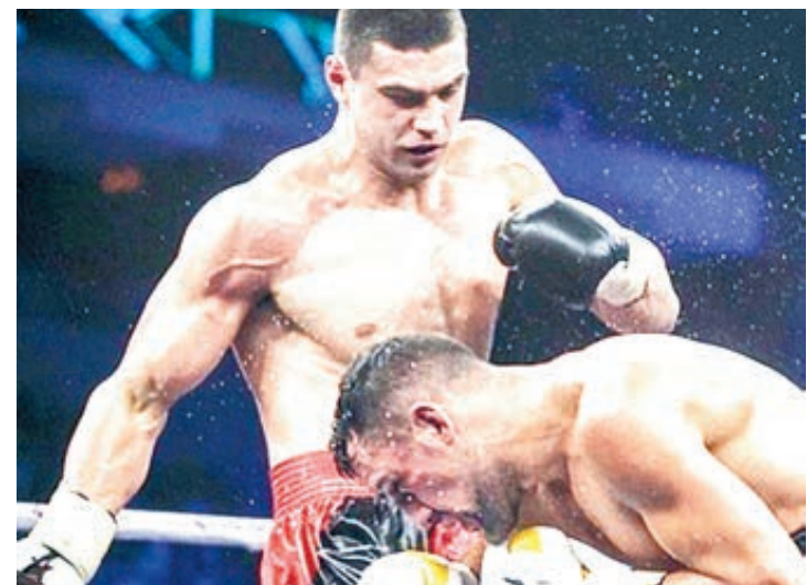
Евгений Тищенко идет по победному графику.