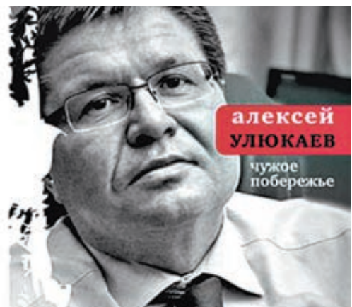
алексей УЛЮКАЕВ чужое побережье

То есть предложение министра признали как минимум заслуживающим обсуждения. Но с поправками: мол, господин Улюкаев, видимо, имел в виду сокращение зарплат лишь в бюджетном секторе экономики (а это 14 млн россиян), поскольку руководить частным бизнесом министр не уполномочен.