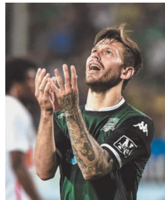
Лидер гонки бомбардиров Федор Смолов.

Чемпионат России по футболу достиг своего апогея. Помимо интриги в борьбе за золото не вполне предсказуемой выглядит и гонка бомбардиров. Сразу четверо претендуют на звание лучшего голеадора: Федор Смолов из «Краснодара» (20 голов), голландец из «Спартак» Промес (16) и зенитовцы Халк (16) и Дзюба (14). Причем Смолов и Халк серьезно пополнили свои голевые запасы на этой неделе, забив соответственно три и два мяча. «Труд» попросил лучших бомбардиров прошлых лет сделать свои ставки.