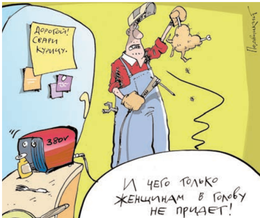
ИЛЛЮСТРАЦИЯ ПОДАВИЧНОГО ВИТАЛИЯ/CARTOONBANK.RU

Между прочим, тут мы и по части технологий от Запада не отстаем. В самых развитых секторах российской промышленности – космос, атомные станции, системы