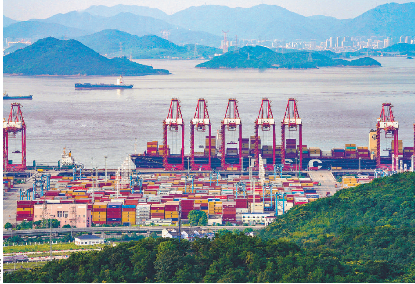
Контейнерный терминал порта Чжоушань в городе Нинбо (провинция Чжэцзян, Юго-Восточный Китай). Порт связан 301 маршрутом с более чем 600 портами в более чем 100 странах и регионах мира, 125 маршрутов ведут к странам и регионам вдоль «Пояса и пути».

народные грузовые железнодорожные маршруты Китай—Европа, новый международный сухопутно-морской торговый коридор, железная дорога Китай—Лаос и греческий порт Пирей. Эти проекты заложили прочную основу для развития торгово-экономического со-