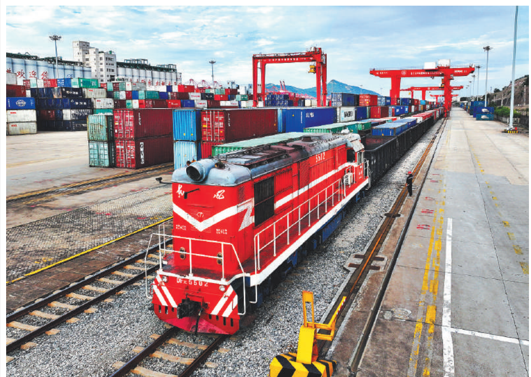
Загруженный товарами поезд, курсирующий по маршрутам Китай — Европа, готовится к отправке на Базе китайско-казахстанского логистического сотрудничества в портовом городе Ляньюньган (провинция Цзянсу, Восточный Китай).

В рамках инициативы «Один пояс, один путь» уже были подписаны соглашения о реализации более трех тысяч проектов сотрудничества на общую сумму около одного триллиона долларов США и построены многие национальные знаковые сооружения, объекты общественной инфраструктуры и памятники сотрудничества. Совместное строительство «Одного пояса, одного пути» открыло новую модель