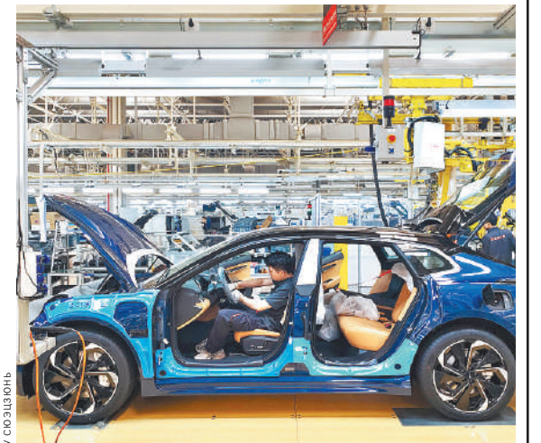
Рабочие собирают автомобили на новых источниках энергии на интеллектуальном заводе Zeekr, премиального электроавтомобильного бренда китайской компании Geely, в городе Нинбо (провинция Чжэцзян, Восточный Китай).

Таким образом, NEV одновременно являются конечными пользователями и посредниками. Взаимная интеграция и синергетическое развитие «умных» транспортных средств и надежной энергии способствуют энергетической революции.