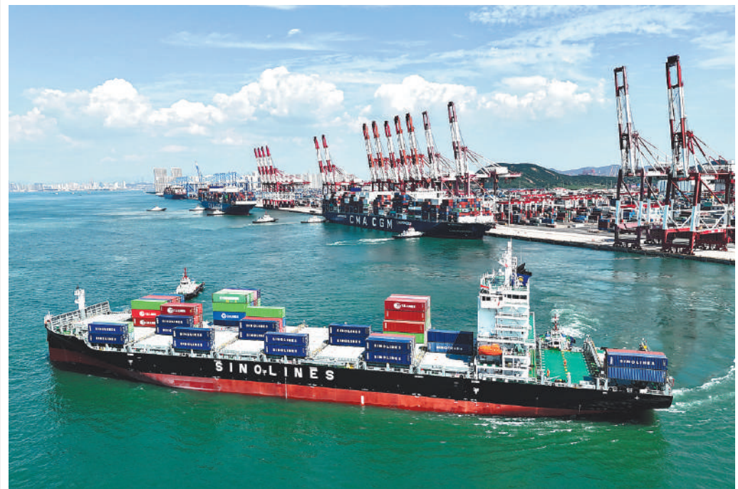
В порту Циндао (провинция Шаньдун, Восточный Китай) 30 августа 2023 года состоялась церемония открытия морского маршрута в восточную Индию компании Sinocontainers Container Lines Co., Ltd. Первое судно отправляется из Циндао в индийский порт Ченнаи. В этом году порт Циндао открыл 10 морских маршрутов в страны и регионы вдоль «Пояса и пути», а количество контейнеров, которые отсюда отправляются, выросло двукратно.

трудничества, взаимодействия в сфере производственных мощностей, а также сотрудничества в области энергетики и ресурсов.