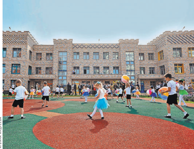
Самый необычный детский садик в Свердловской области — в виде большого замка. Под крышей с башенками уютно разместились 300 малышей.