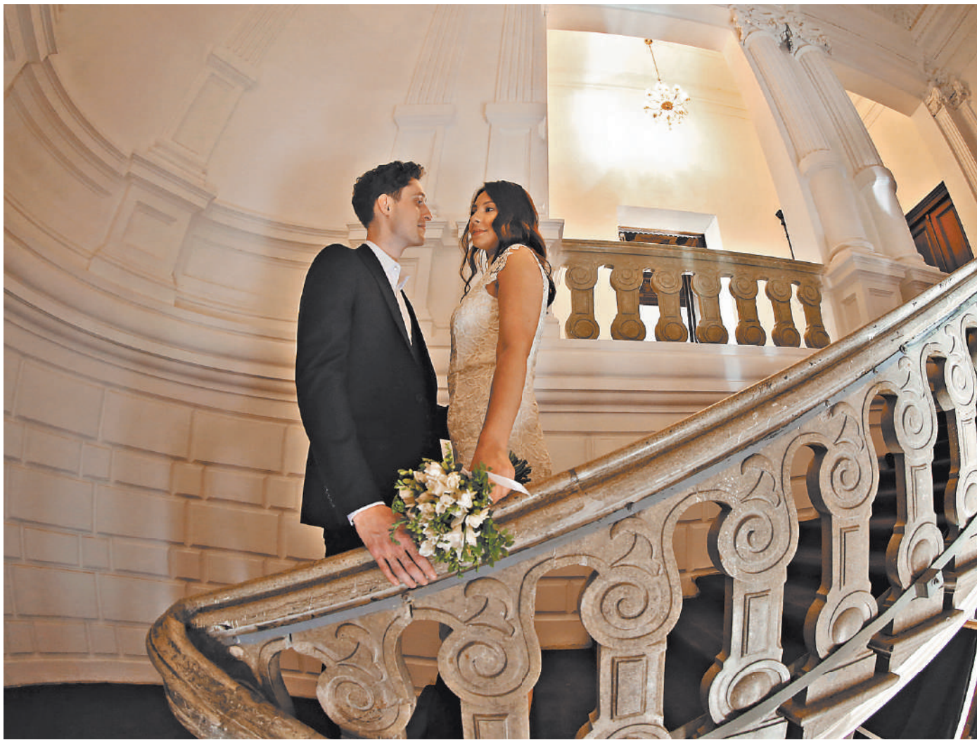
Сегодня можно зарезервировать дату свадьбы, не выходя из дома. На портале госуслуг надо выбрать категорию «семья», затем «регистрация брака»...