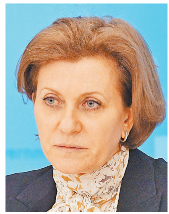
Анна Попова: Приобретенный иммунитет к коронавирусу есть у 20 процентов медработников в Москве.

Меры ограничительного характера в России носят превентивный характер и вводились поэтапно с учетом эпидемической ситуации в мире и в стране, напомнила глава Роспотребнадзора. Любое отклонение от режима ограничений приведет к возврату жестких мер, указала она. По числу заразившихся коронавирусом на 100 тысяч жи-