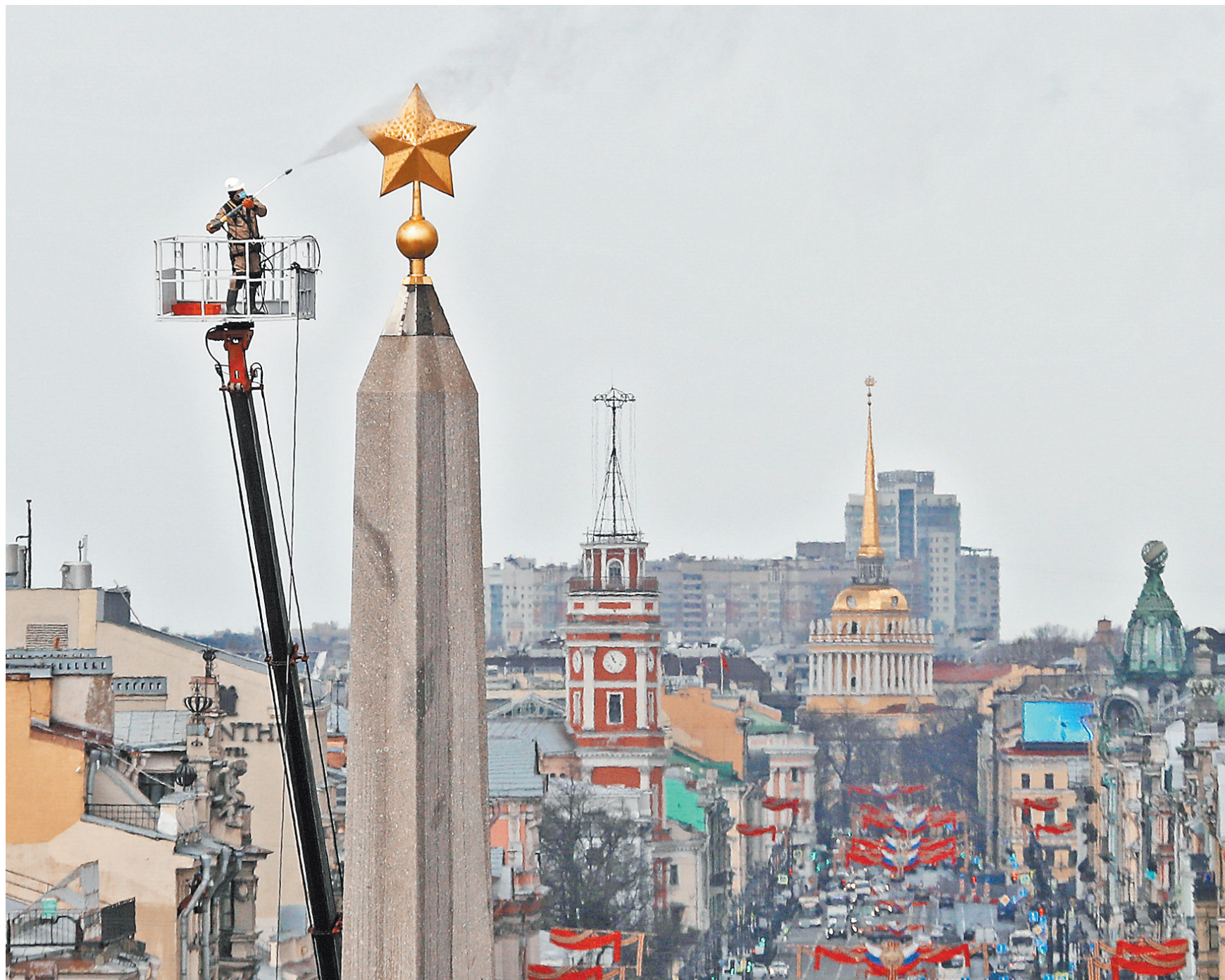
Акция «Бессмертный полк» в этом году пройдет в режиме онлайн, ее будут транслировать сотни медиаэкранов, онлайн-кинотеатры и портал «Бессмертного полка России». Но звезды на Невском проспекте в Санкт-Петербурге, как и на улицах других городов будут сняты по-настоящему. Коммунальные службы проводят генеральную уборку перед праздником Победы. Помимо регулярной промывки улиц дезинфицирующими растворами, тщательно чистят памятники.

СИТУАЦИЯ В Москве протестировали уже 50 тысяч медработников на иммунитет к COVID-19