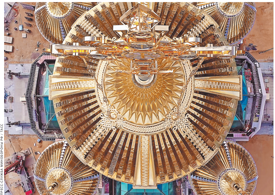
Главный храм Вооруженных сил России станет третьим по величине в России и четвертым — в мире.

ПРОГНОЗ Ждут ли нас исчезновение ряда профессий и переход на удаленку