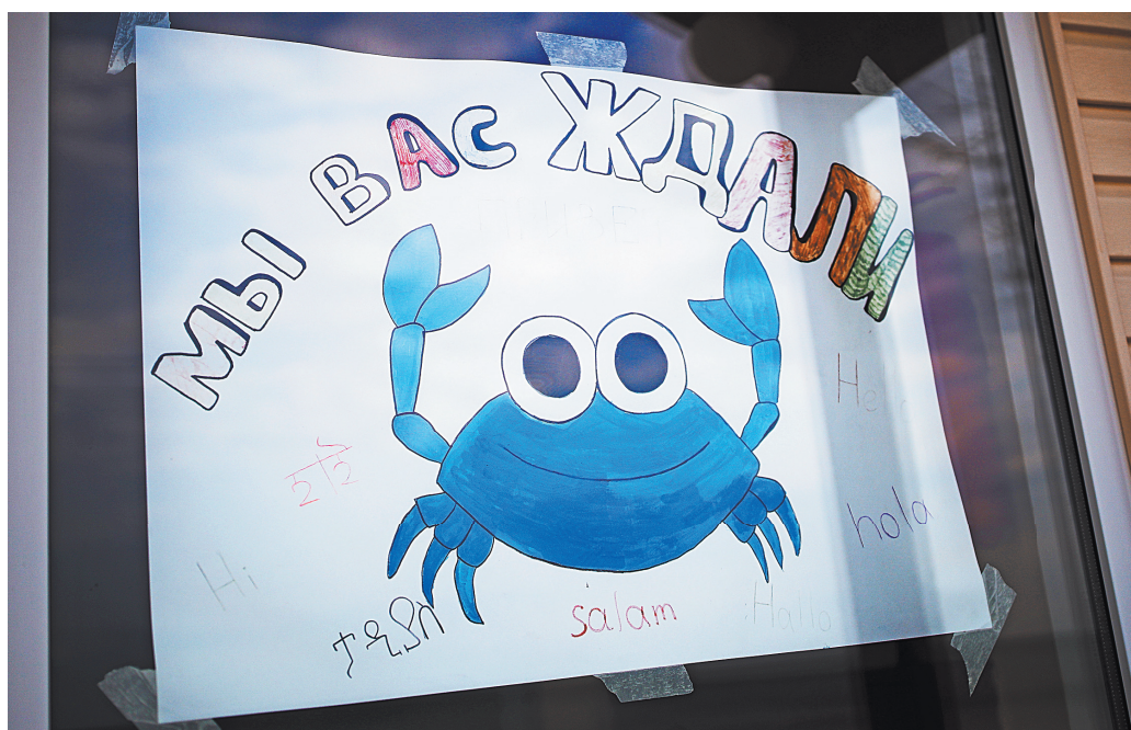
В «Орленке» скачуют по детям: вот такой плакат висит на окне лагеря, где отменили смену на апрель...