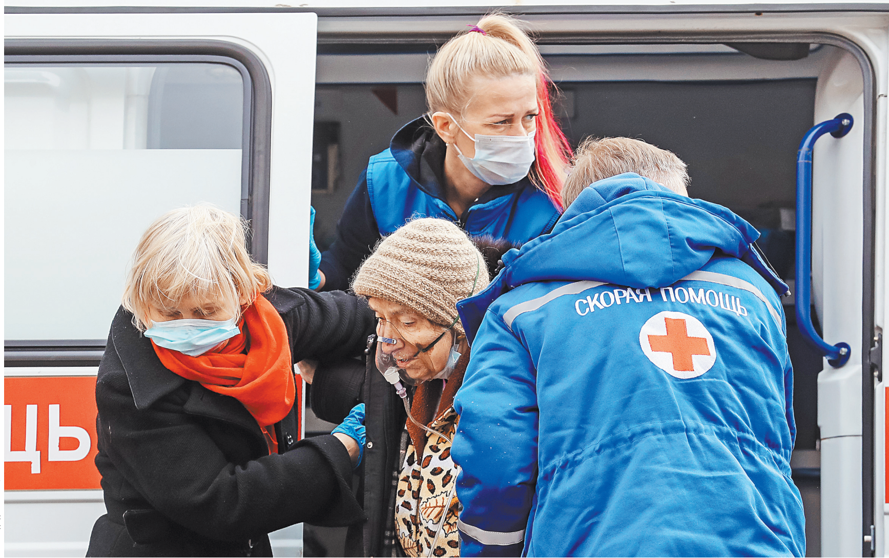
Президент предложил установить День работника скорой помощи 28 апреля.

Даже с учетом принятых мер, ошутимого роста собственного производства и крупных импор-