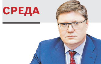
Андрей Исаев, первый заместитель руководителя фракции «Единая Россия» в Государственной Думе