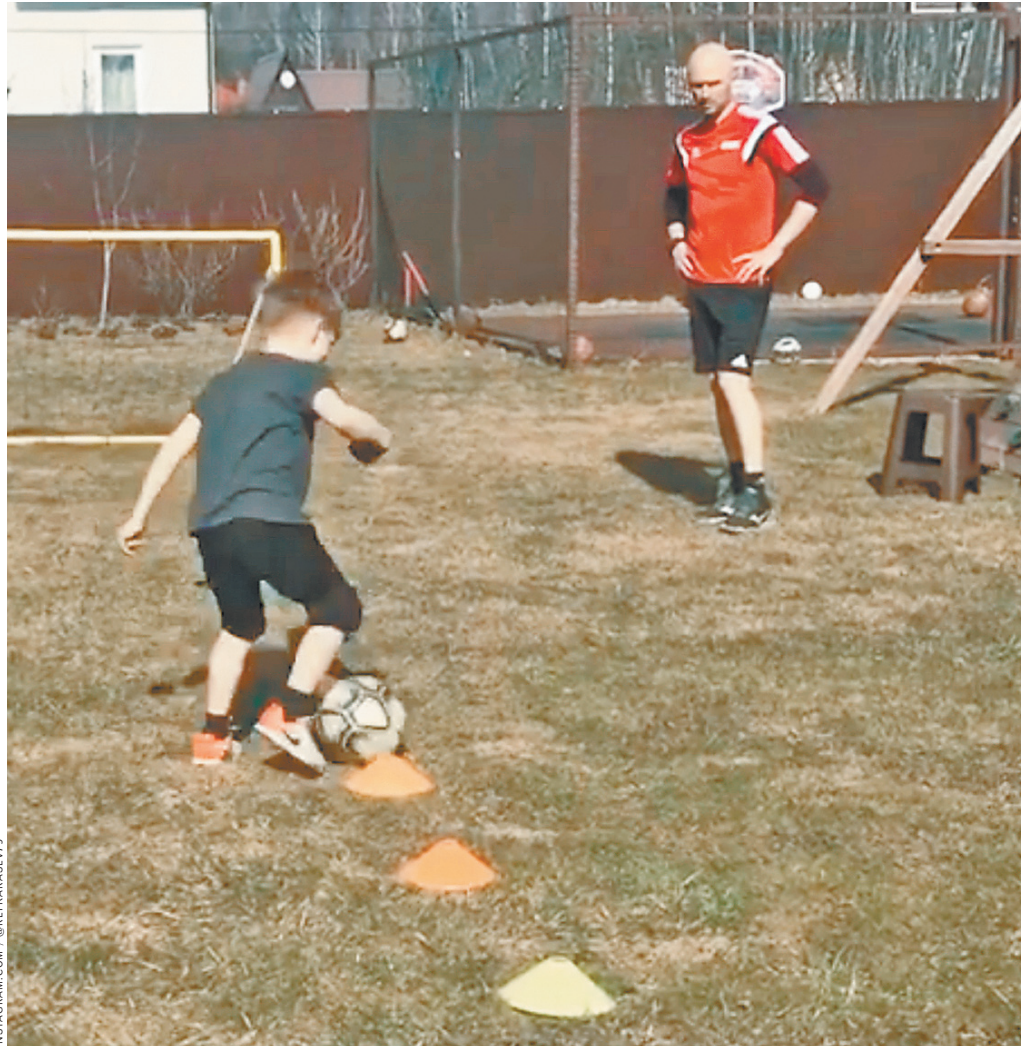
Как вы поддерживаете судейскую форму?