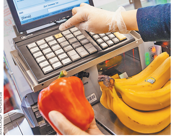
Умные весы за секунду распознают овощи, фрукты и конфеты, выдавая точный вес и ценник.

Пока умные весы установлены в 10 магазинах Москвы, но в ближайшее время появятся еще в ста торговых точках.