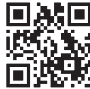
Последние новости о коронавирусе — на сайте «РГ».

По данным оперативного штаба по мониторингу и контролю за ситуацией с коронавирусом, 28 апреля в России выявлено 6411 новых случаев заражения в 83 регионах. Больше всего — 3075 — в Москве. Всего в России зарегистрировано 93 558 случаев коронавирусной инфекции в 85 регионах. С начала эпидемии выздоровели 8456 человек. Скончались 867 человек.