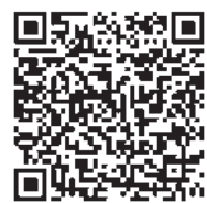
Глава Следственного комитета Александр Бастрыкин — о том, как идет борьба с нарушениями в лесной отрасли — читайте на сайте «РГ».

«Серьезные» компании больше не смогут продавать грубо обработанные бревна под видом пиломатериалов