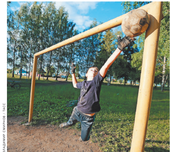
Сельских ребятшек будут обучать спорту профессиональные тренеры, если программа будет принята.

Позитивно повлиять на рынок могут данные по госзакупкам, которые в пандемию производились в особом порядке и пока не видны в общей статистике. А также востребованность препаратов от COVID-19 на рынке, что связано со статистикой заболеваемости.