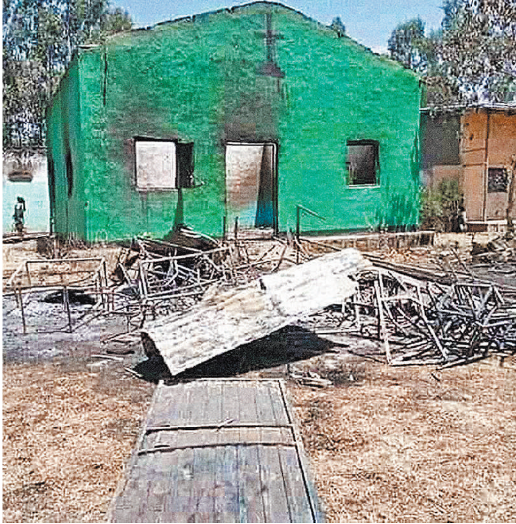
Сгоревший храм канонической Эфиопской церкви.

А кто? Почему эти жестокие злодеяния происходят именно в Эфиопии?