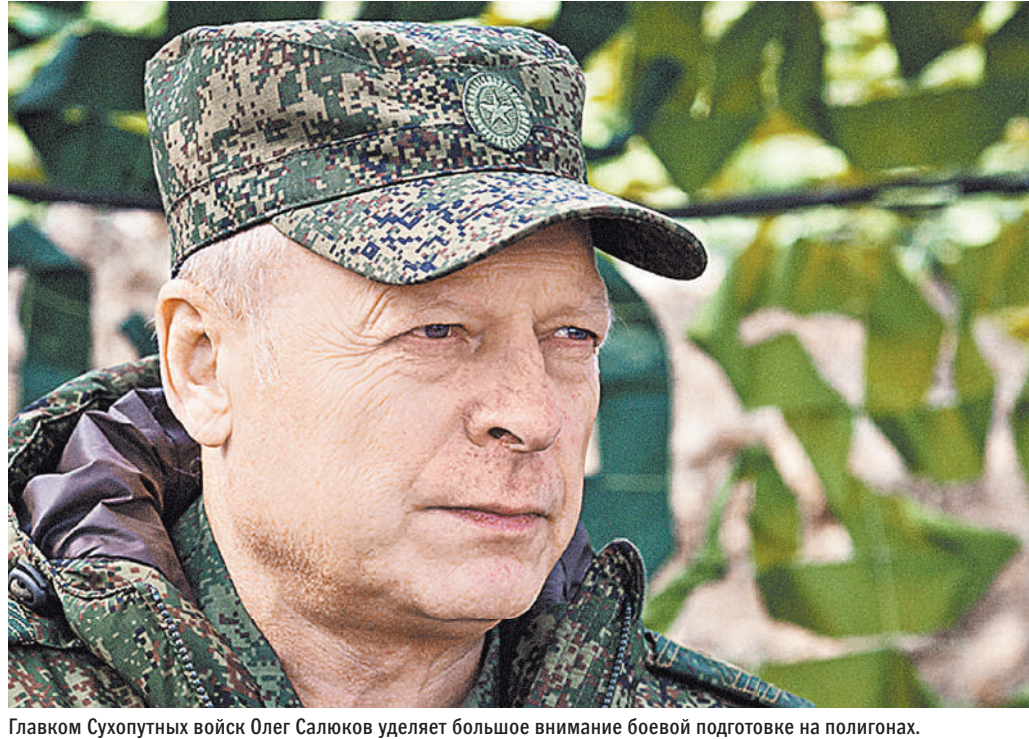
Главком Сухопутных войск Олег Салюков уделяет большое внимание боевой подготовке на полигонах.