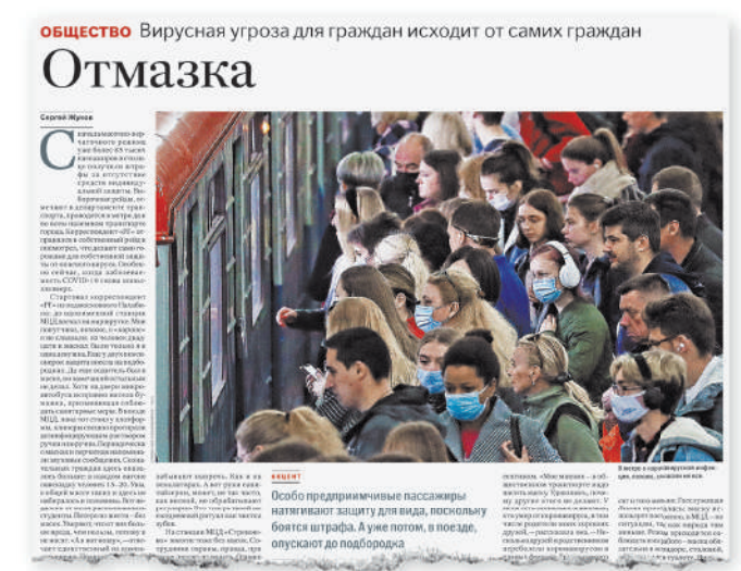
Не считают нужным надевать маски, о чем ранее писала «РГ», и многие пассажиры подземки.

PS: Устроители Московского кинофестиваля общаются зрителям безопасный просмотр. Но как будет на самом деле — покажет время. (Подробности на с.11)