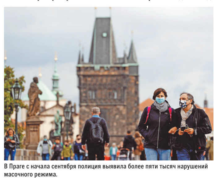
В Праге с начала сентября полиция выявила более пяти тысяч нарушений масочного режима.

Функции все остальные государства Европы, а число зараженных может составить до восьми тысяч человек в день.