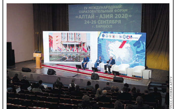
Форум прошел в дистанционном формате.

Форум «Алтай—Азия 2020», несмотря на вызовы, обусловленные эпидемиологической обстановкой, вновь показал свою востребованность в образовательном сообществе России и стран Азии, доказав возможность успешного проведения мероприятий подобного уровня при соблюдении необходимых мер безопасности. Восстановление коммуникации между вузами разных стран после периода самоизоляции сегодня актуально и для студентов, и для преподавателей, и для экспертов в области образования. ●