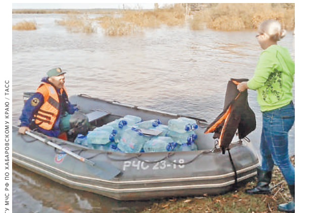
МЧС организовало доставку предметов первой необходимости в отрезанные села. Звонкируются там никто не желает.

По сообщению МЧС, работа по наполнению мешков песком для возведения насыпных дамб и защитных сооружений не прекращается ни на минуту. Спасателями Амурского спасцентра и волонтерами создан резерв почти в 12 тысяч мешков. Работу по откачке воды осуществляют 17 мощных насосов. ●