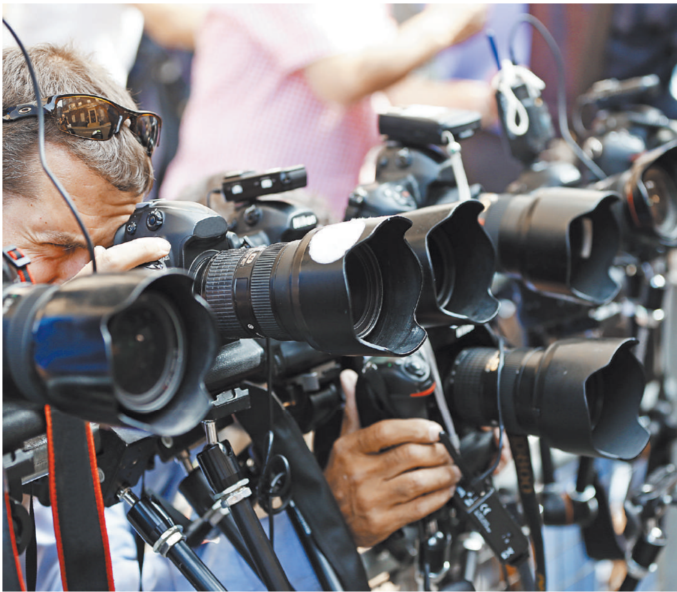
С 1 октября вступает в силу обязательная маркировка парфюмерной продукции и фототехники. На каждом товаре должен быть нанесен код в формате Data Matrix, исключение сделано только для кинокамер, фотовспышек и ламп-вспышек. Для участников рынка это означает, что отгрузка и приемка продукции будут производиться через электронный документооборот. Данные с кодами промаркированных товаров передаются в систему «Честный знак». В системе обязаны зарегистрироваться все импортеры, дилеры, розничные торговые точки.

За нарушение правил использования ящиков для пожертвований предлагается установить штрафы. •