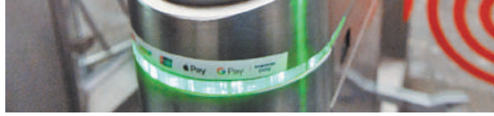
Проезд на «фиолетовой» и «розовой» ветках подземки в определенные часы будет вдвое дешевле.

Проводить эксперимент с пониженными тарифами необходимо, вреда от него никому не будет. По данным 2019 года, на «фиолетовой» ветке загрузка вагонов в час пик доходила до 200 пассажиров, уменьшение этого числа хотя бы на 15–20 процентов уже будет отличным результатом—людям будет комфортнее и можно говорить о разумной социальной дистанции», — говорит Блинкин. Сейчас же проверить разгрузку пиковых часов сложно—многие москвичи перешли на удаленку. Но это не мешает провести тестирование техники.