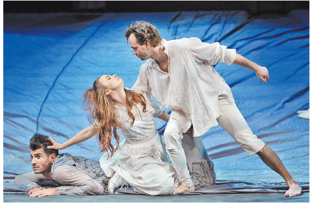
Буффонады и трюки имели в этой феерической комедии не меньшее значение, чем диалоги актеров.