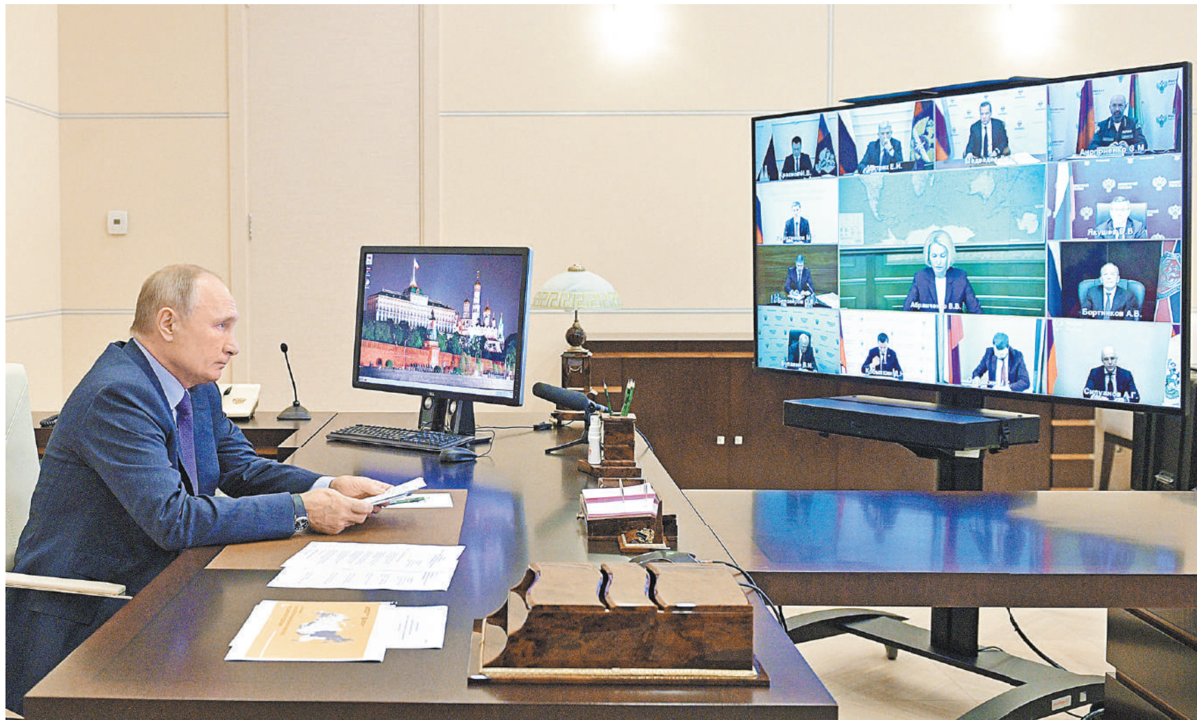
ВЛАДИМИР ПУТИН