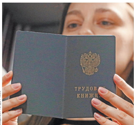
Бумажные трудовые книжки становятся атрибутом ретрогадов или музейным экспонатом.

До 31 октября работодатели еще могут уведомить своих сотрудников о том, что те должны до конца года определиться с самым удобным способом формирования сведений о трудовом стаже — в бумажном или электронном виде. Первоначально работодатели должны были уведомить сотрудников не позднее 30 июня 2020 года. Однако из-за эпидемии срок был продлен до 31 октября включительно. Для выбора способа ведения трудовой каждой работницей должен лично написать заявление и передать в отдел кадров. Если человек выбрал электронную книжку, но потом передумал, вернуть бумажную не получится. А вот если работник сначала оставил бумажный вариант, но через какое-то время «дозреет» до электронной книжки, закон позволяет это сделать.