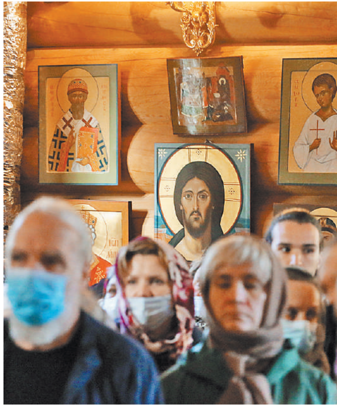
Храм в честь Андрея Рублева построен на деньги жертвователей, в числе которых много мастеров из прилегающего «городка художников».

Сегодня среди прихожан много художников, скульпторов, представителей православных храмов в Москве строятся исключительно на пожертвования. Но без помощи нескольких крупных благотворителей, которым после службы были вручены патриаршие грамоты, стройка была бы невозможна.