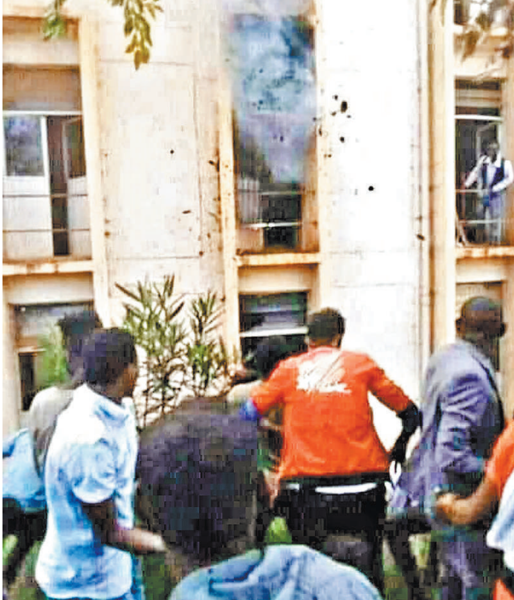
Христиан Эфиопской Церкви преследуют и дома.

ков — третья по величине христианская община мира и самая крупная в Африке, общее число ее верующих более 65 миллионов человек, это примерно 2/3 населения Эфиопии.