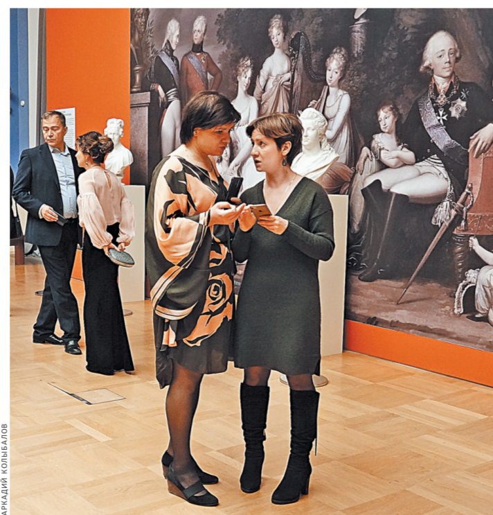
На выставке представлены экспонаты из 20 музеев и частных коллекций.

В Большом дворце Царицыно открылась грандиозная выставка «Российская благотворительность под покровительством Императорского дома Романовых».