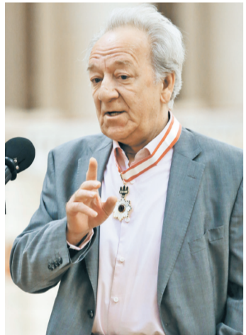
Маэстро Темирканов интересуется классикой, и он почти отказался от исполнения современной музыки.

Ежегодно накануне открытия своего зимнего фестиваля «Площадь искусств» Юрий Темирканов дает пресс-конференцию. Фестиваль откроется 14 декабря выступлением Николая Луганского и Вадима Репина, а 15 декабря состоится большой концерт к 80-летию маэстро. В этот день в зале филармонии ожидается визит президента. Но заслуженным коллективом России будет дирижировать не юбиляр, а Марис Янсонс. Концерт транслирует в прямом эфире канал «Культура».