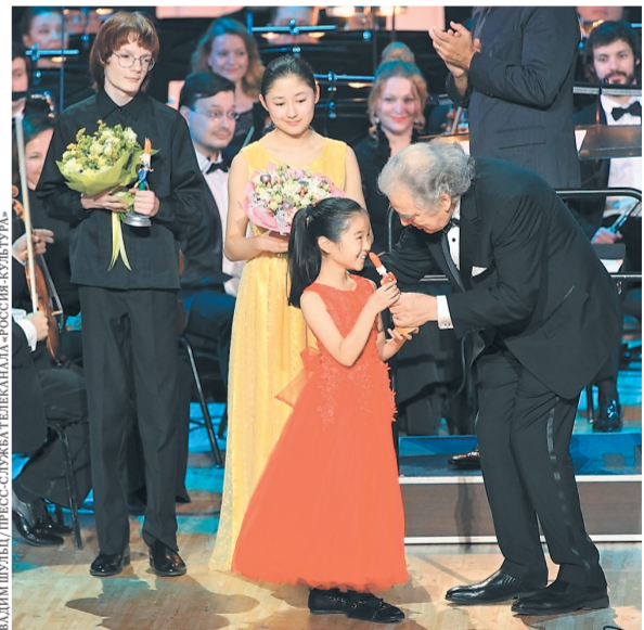
Чтобы реализовать свой талант, ребенок должен научиться себя слышать — научиться самоконтролю.

Какой смысл вы вкладываете в свои слова «бескартисный профессионализм», когда говорите о детях? ЗАХАР БРОН: Самый прямой. Чтобы ребенок мог реализовать свой талант, нужно с детства преодолеть самое трудное: научиться самоконтролю, «самослышанию».