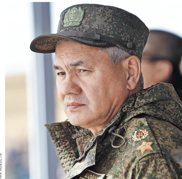
Сергей Шойгу: по сравнению с 2015-м в этом году количество стран — участниц Армейских игр возросло с 16 до 32.