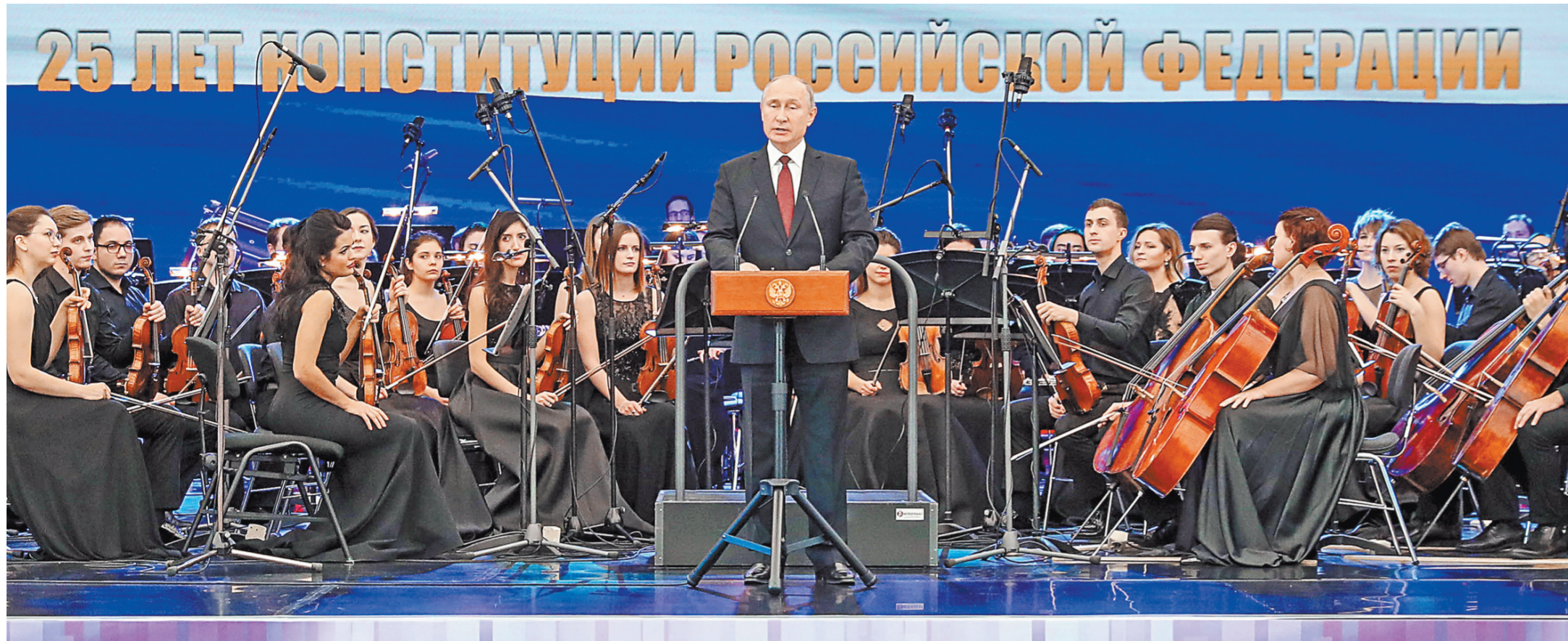
Президент пообещал, что все проблемы и трудности в стране будут преодолеваться при соблюдении и уважении норм Основного Закона.