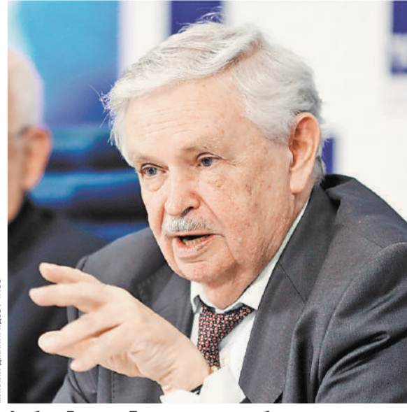
Альберт Лиханов: Поведение — это вообще не о еде и не о бытовом комфорте, это прежде всего про отношения.

АЛЬБЕРТ ЛИХАНОВ: Тогда было нечем. Мы слушали сказки по радио, замечательные народные артисты читали эти сказки, мы заслушались. В кинотеатрах фильм шел по три месяца, «Чапаев» я смотрел за 40. И было у нас еще одно чудо — книги. Сейчас невозможно себе представить, чтобы целый класс после уроков летел в развалку, одевался и бежал в городскую библиотеку, чтобы успеть захватить в читальном зале два экземпляра «Трех мушкетеров» и один «Десять лет спустя». Остальные стояли в очереди, книги давали только на час в день. Я, кстати, был записан в пяти библиотеках. До десятого класса я прочитал столько, что мне до сих пор хватает. Если сегодня ребенка отключить от всего и дать ему только книги, он будет более развитым, чем с гаджетом в руках.