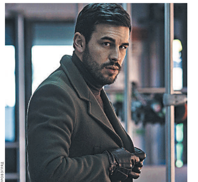
Актер Марио Касас легко и с удовольствием вжился в образ миллионера, обвиненного в убийстве подружки-красавицы.

И вот тут надо отдать Паоло должное — в «Невидимом госте» он настолько мастерски держит интригу, настолько эффектно кидает зрителю ложные намеки и неясные подсказки, насколько это вообще возможно. В третьем акте изощренность режиссера выливается в что-то невероятное. В какой-то момент, например, начинается настоящий «Расемон»: персонажи перечисляют свои версии случившегося, каждая из которых противоречит предыдущей. Все это виртуозно демонстрируется зрителю. И когда уже кажется, что ты понял, куда клонит режиссер, он вдруг наносит решающий удар. Уже не помню, когда я в последний раз так сильно удивлялся разгадке, которая хоть и донельзя мелодраматична, но провоцирует не сантименты, а чистое удовольствие, которое получается, осознавая наконец всю красоту авторского замысла.