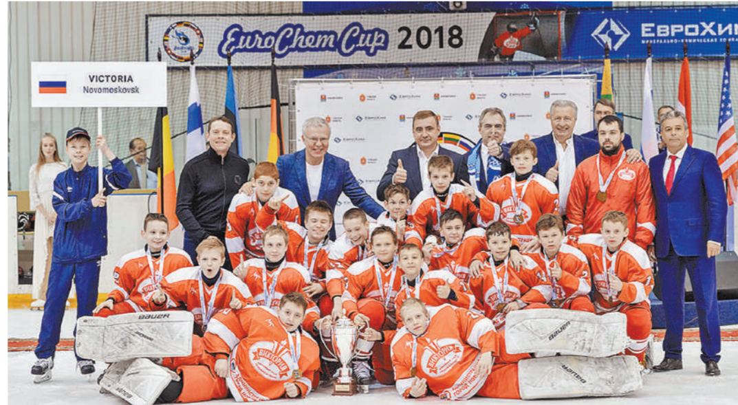
Победители турнира – команда «Виктория» из Новомосковска с губернатором Дюминым, генеральным директором «ЕвроХима» Нецаевым и звездами хоккея Буре, Фетисовым, Якушевым.

В этом году турнир проходил сразу на двух площадках – в городе благодаря химическим компаниям появился второй ледовый дворец. Стоит вспомнить, что год назад завершающим событием EuroChem Cup стала закладка первого камня в строительстве новой ледовой арены (дворец «Юбилейный» был построен компанией «ЕвроХим»). К ноябрю второй ледовый дворец в Новомосковске был возведен компанией «Полипласт», руководство которой заявило, что следует примеру «ЕвроХима».