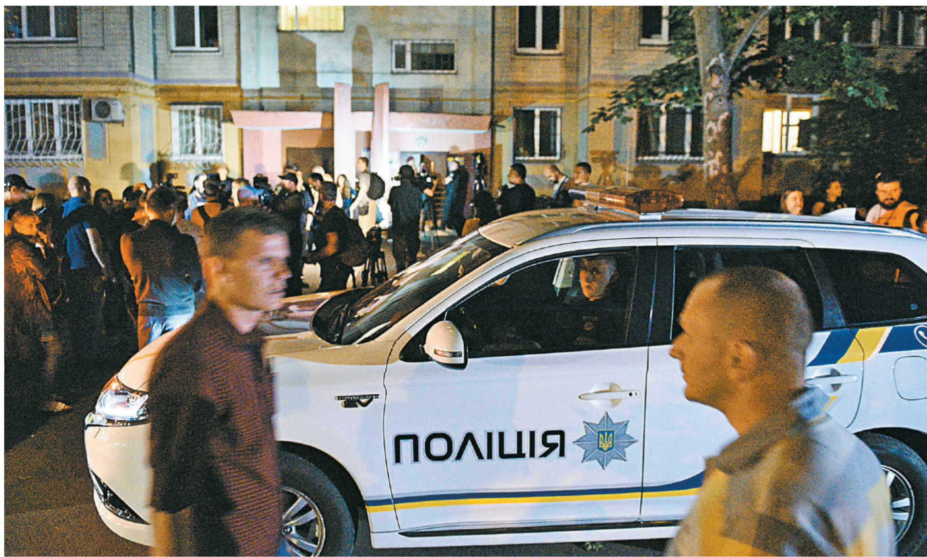
В полиции утверждали, что журналист Аркадий Бабченко был убит тремя выстрелами в спину. Но это оказалось фейком, придуманном спецслужбами Украины.

1 → В том, что подзабытому на родине Бабченко хотелось свою «минуту славы», ради чего он бесовесно подставил коллег по журналистскому цеху и даже родных, сомневаться не приходится.