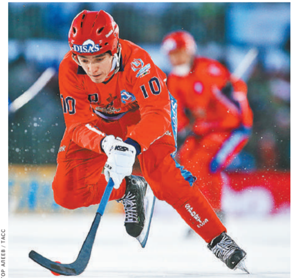
В новом сезоне болельщики ждут успехов от национальной сборной России на чемпионате мира.