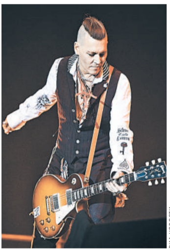
Не все из поклонников узнают Джонни Деппа, ставшего рокером.

Отчего Джонни Депп так любят, стало понятно еще перед первым концертом (Hollywood Vampires впервые приехали в Россию, зато сразу в два города — в Москву и в Санкт-Петербург). Артист сразу попросил отвести его в Музей поэта Владимира Маяковского. Там он был приветлив, улыбка, доброжелателен, эрудирован. Вряд ли кто из иных гастролеров, кстати, вообще знал про существование такого музея. Сотрудник музея поразило, что