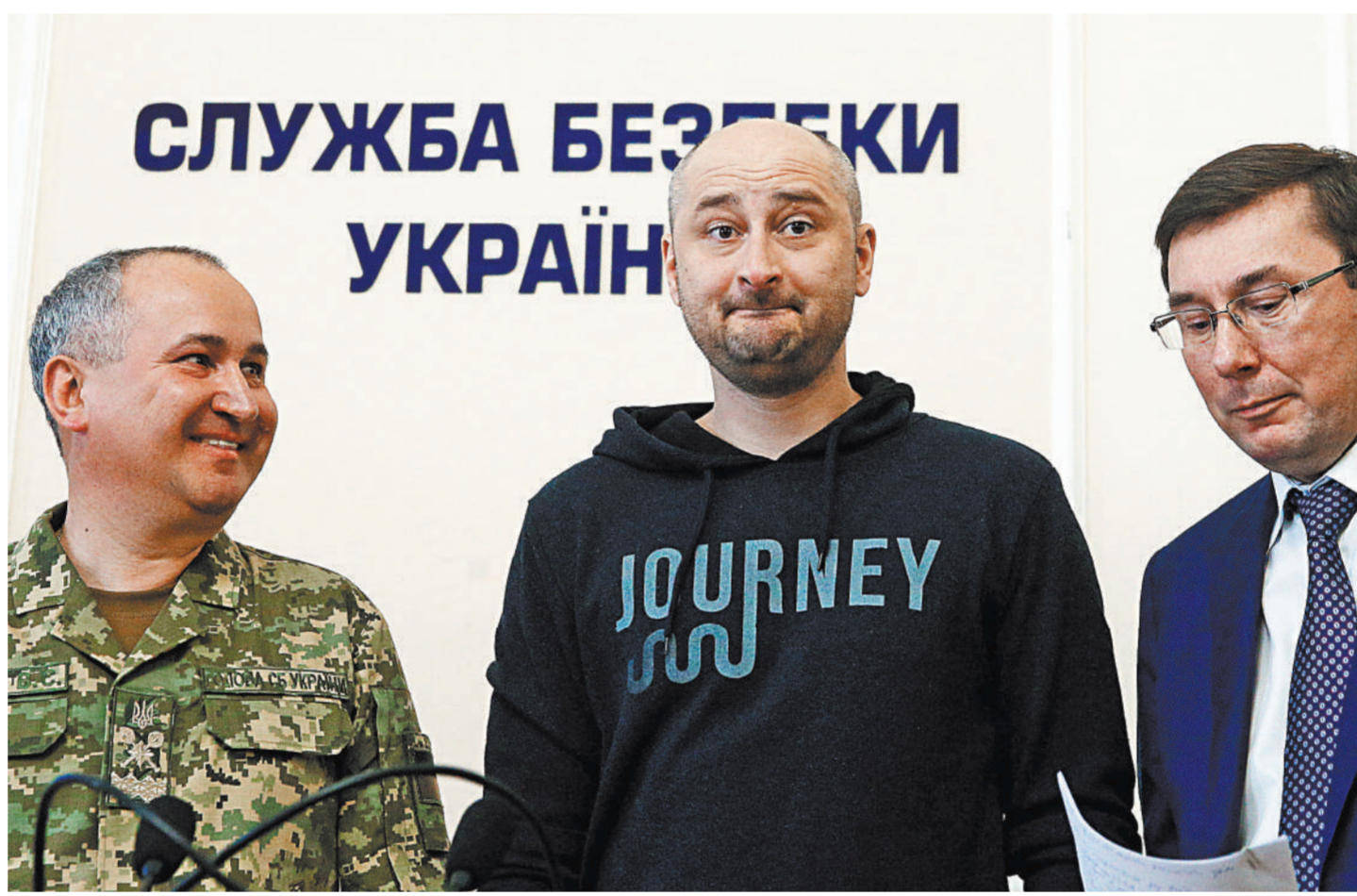
Аркадий Бабченко оказался живым и здоровым. Своё «убийство» он объяснил спецоперацией украинских силовиков.

Бросается в глаза, что чудесное воскрешение журналиста, уже успевшего за время пребывания