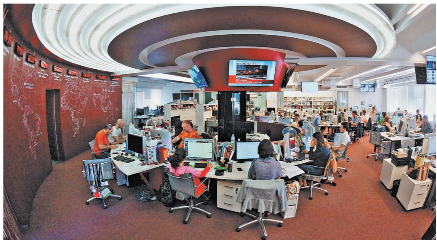
Когда температура на улице ниже 10 градусов тепла, в помещении должно быть 22–24 градуса. А если шумно — работникам обязаны выдать наушники.