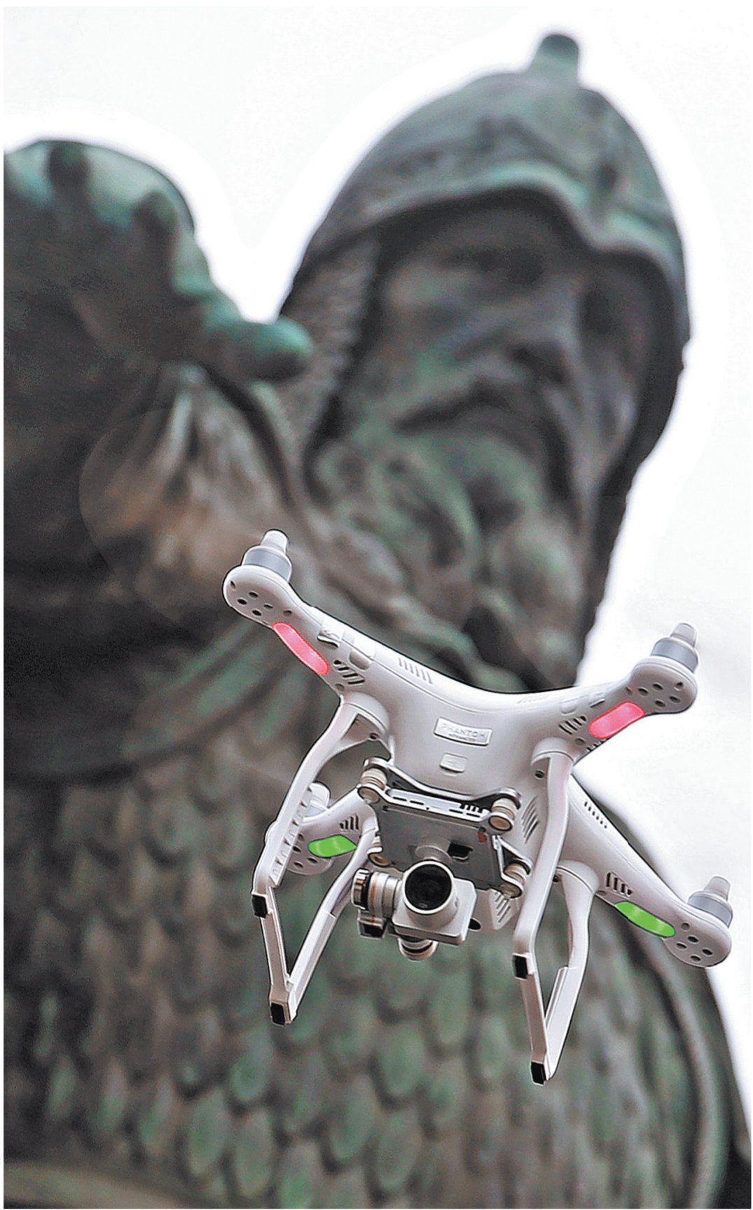
«Внешний пилот» проведет свой дрон так, что комар носа не подточит.