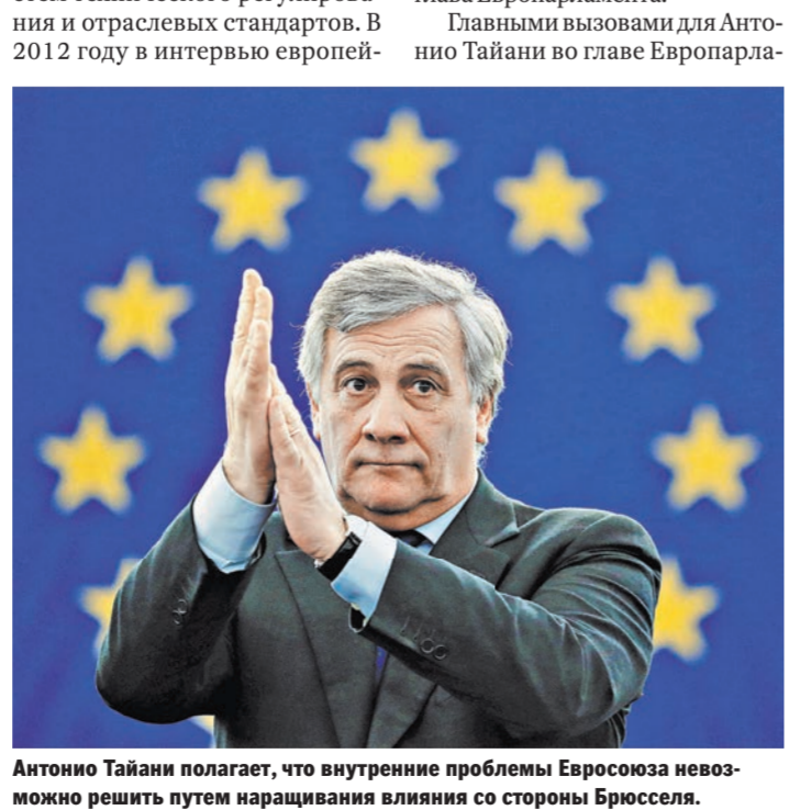
Антонио Тайани полагает, что внутренние проблемы Евросоюза невозможно решить путем наращивания влияния со стороны Брюсселя.

ли в 2008–2012 годах Виктором Христенко, многое сделал для развития и укрепления деловых связей между странами ЕС и Россией. В июне 2013 года он приехал в Москву во главе делегации, в состав которой вошли представители 120 малых и средних европейских компаний. А за два года до этого, отвечая на вопросы корреспондента «РГ», Тайани настаивал на необходимости сближения российской и европейской систем технического регулирования и отраслевых стандартов. В 2012 году в интервью европей-