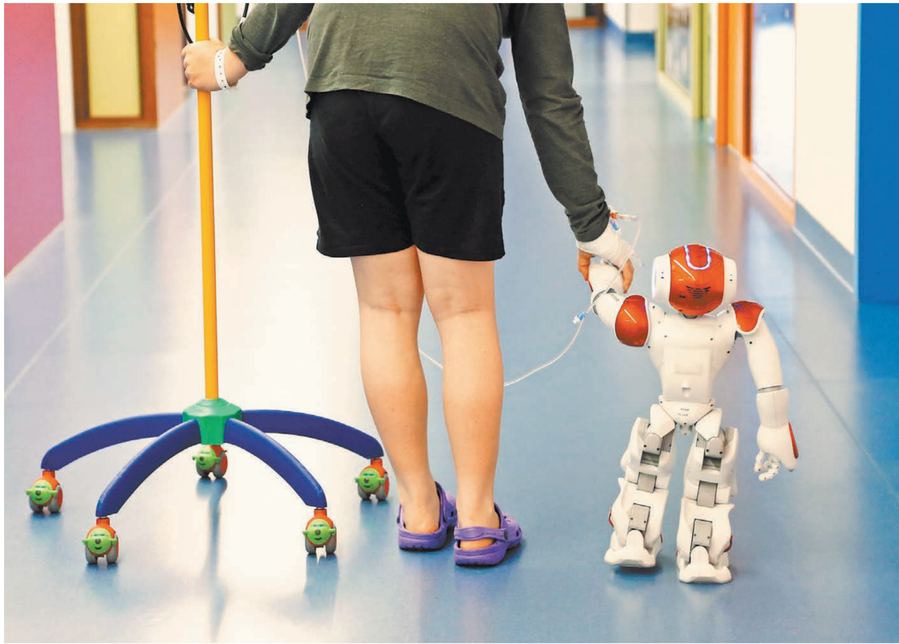
Роботы начнут помогать нам лечиться, но диагнозы по-прежнему будут ставить врачи.

1 И вы хотите ему послать свой рентген, спросить его что-то и заплатить ему за консультацию. Если доктор посчитает, что нужен личный прием, он посмотрит документы, и скажет — приезжайте. Не понадобится — назначит лечение. Это его право, я ему доверяю как академику или доктору наук.