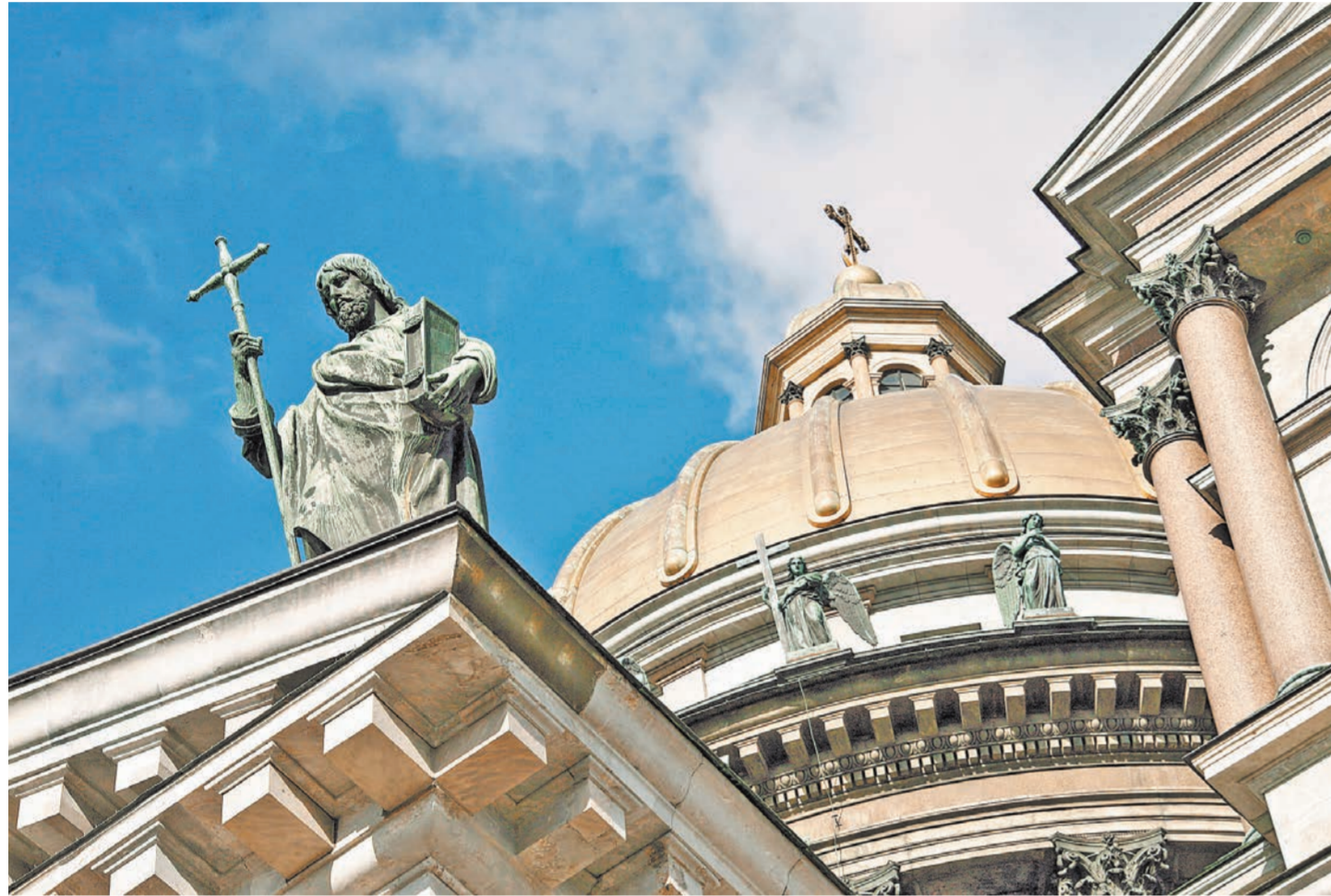
Хотелось бы верить, что вопрос о передаче Исакиевского собора Церкви — это не вопрос собственности и финансовых потоков.

Госдума готовится к второму чтению резонансного законопроекта «о шалкае». Смысл этого документа в том, чтобы из числа уголовно наказуемых преступлений исключить первые случаи побоев в отношении близких лиц. Перед вечерним заседанием Госдумы спикер Госдумы Вячеслав Володин прокомментировал критику в адрес поправки со стороны сенатора Совета Европы Турберна Яганда. «Когда между первым и вторым чтением начинается такое давление по вопросу, который относится исключительно к национальному законодательству, к праву депутатов, это давление, и оно недопустимо», — заявил Володин. При рассмотрении нацумованных поправок депутаты будут учитывать в первую очередь мнение общества, подчеркнул он.