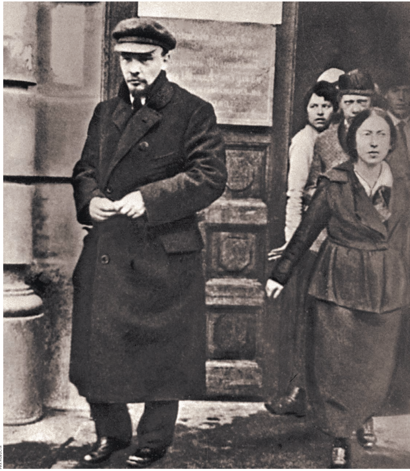
Владимир Ильич в 1918-м у здания Высших женских курсов: идет к Всероссийский съезд по просвещению.

неалогические тайны были разгаданы к концу 1980-х: евреи, немцы, шведы, русские, калмыки, такой набор. Единственный вопрос, который остается, это соотношение русской и калмыцкой крови у отца.