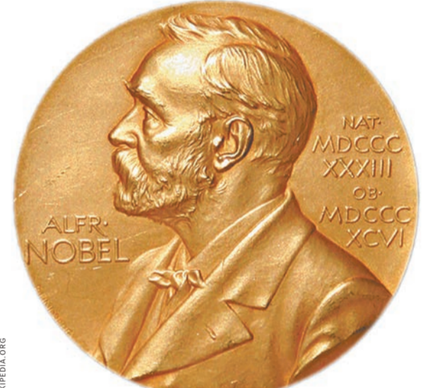
Новые правила не будут распространяться на спортивные и научные награды, в том числе и на нобелевские премии.

Для доработки документа у сенаторов есть еще около двух недель. Планируется, что новый порядок будет утвержден на заседании Комитета по регламенту и организации парламентской деятельности 31 января.