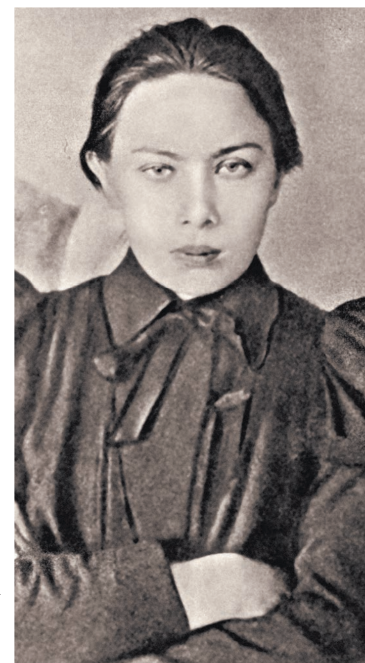
Надежда Крупская, спутница жизни Ленина, действительно была его Прекрасной и Пиковой дамой.

Это важно для биографа — прогуляться 10 км от дома Фонаевой до Смольного таким же вот ноябрьским вечером или прокатиться на велосипед от парка Монсури до Лонжюмо. Чувствуешь клиента.