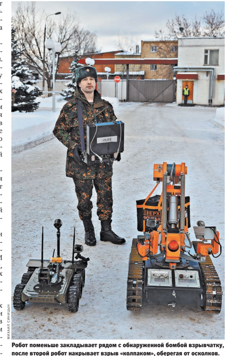
Робот меньшего закладывает рядом с обнаруженной бомбой взрывчатку, после второй робот накрывает взрыв «коллапом», оберегая от осколков.

«По всей стране 120 наших групп выезжают от трех до семи раз в день по вызовом органов местной власти либо по сигналам населения, при этом обезвреживая от 7 до 15 различных взрывных устройств», — рассказал офи-