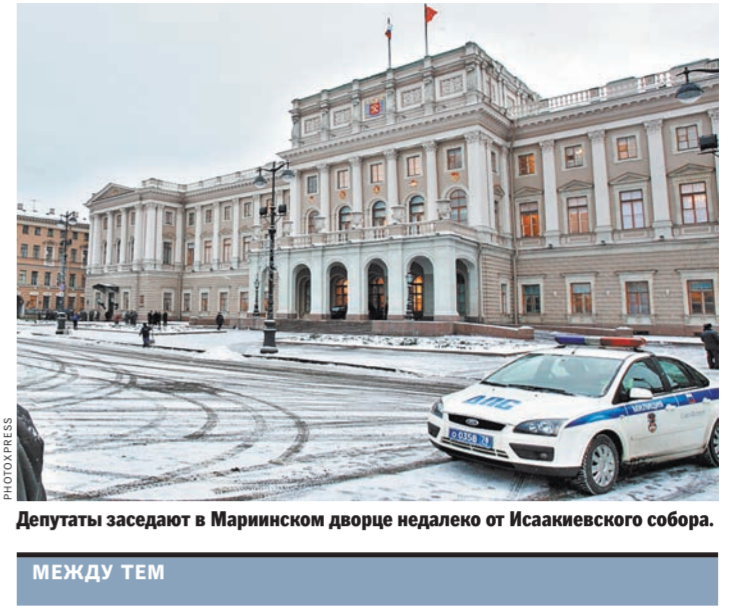
Депутаты заседают в Маринском дворце недалеко от Исакиевского собора.

И там, где люди живут творением молитвы или сохранением реликвий истории, а часто сочетают молитву и искусствоведческий труд — находят общий язык между собой. А где думают лишь о финансовых потоках — там всегда разлад. Как всегда, всё зависит от людей. Очень хотелось бы верить, что вопрос о передаче Исакиевского собора церкви это не вопрос собственности, финансовых потоков. Можно будет взобраться на смотровую площадку, окинуть взглядом нашу Северную столицу, послушать лекцию об истории храма, а потом помолиться за здоровье всех нас.