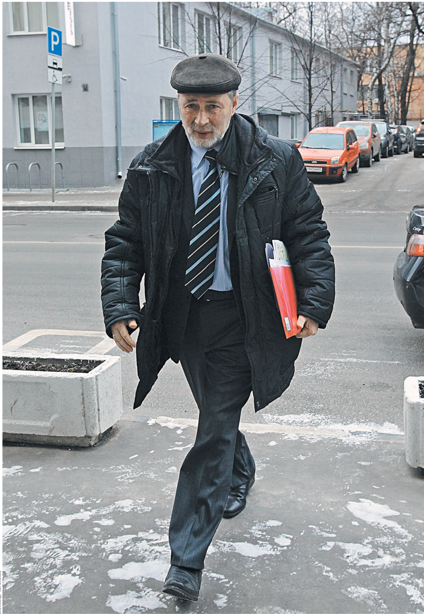
Роман Вильянд пообщал россиян морозную новогоднюю ночь.

Администрация президента США «решила оградить от электронной слежки со стороны Агентства национальной безопасности лидеров Германии, Франции и ряда других союзников по НАТО». «При этом администрация разрешила АНБ работать по их высокопоставленным советникам», — отмечается в публикации. Но часть лидеров стран-союзников не попала в число «неприкасаемых» для АНБ, в их числе израильский премьер Биньямин Нетаньяху и турецкий президент Реджеп Тайип Эрдоган. Спецслужбы США на протяжении десятилетия внедряли технические и электронные инструменты в коммуникационные линии. Их ликвидация после разоблачений Сноудена грозила окончательной утерей контроля. Поэтому Обама приказал остановить перехват телефонных разговоров и электронной почты, но не уничтожить технические возможности. Это позволяло иметь доступ к коммуникациям в офисе премьера Израиля. Особое внимание Нетаньяху стали уделять в 2011–2012 годах, когда Белый дом начал секретные переговоры