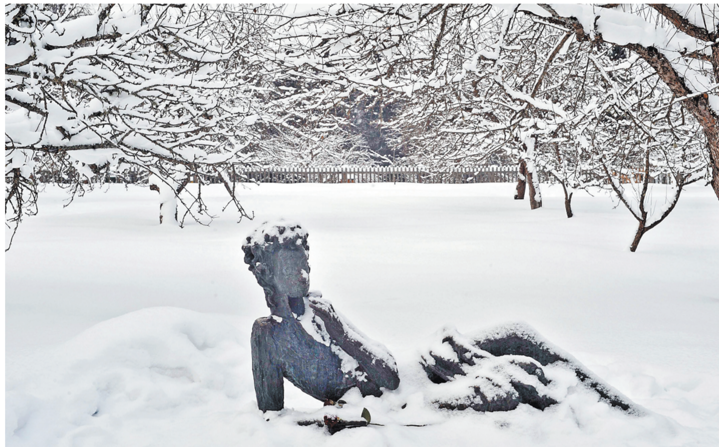
Сильных снегопадов, по прогнозам синоптиков, в январе не будет.