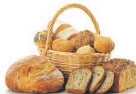
График работы: 5/2, 2/2. Достойная оплата труда, без задержек, 2 раза в месяц, премии по итогам работы.