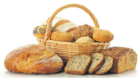
График работы: 5/2, 2/2. Достойная оплата труда, без задержек, 2 раза в месяц, премии по итогам работы.