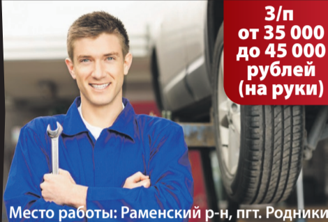
График работы: сменный, 2/2, д/н; Обязанности: ремонт и техническое обслуживание легковых автомобилей Лада Ларгус (Рено) и грузовых автомобилей Газель, МаЗ, Ивеко Оформление по ТК РФ, спецодежда, ежегодная индексация оклада за выслугу лет, бесплатные обеды

З/п от 35 000 до 45 000 рублей (на руки)