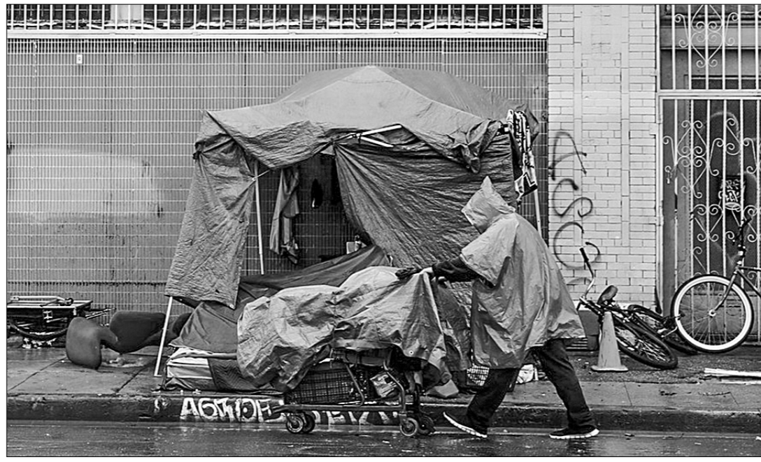
Бездомный под дождём в центре Лос-Анджелеса, с 1992 года.

«Рост уровня бедности, самый большой за последние 50 лет как в целом, так и среди детей, подтверждает решающую роль, которую политический выбор играет в вопросе уровня бедности и тягот населения в стране», — заявила президент центра Шэрон Парротт.