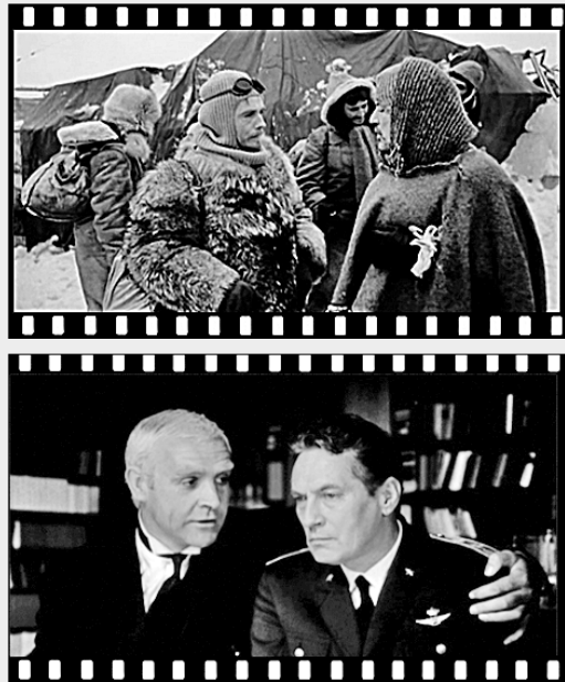
Кадры из фильма «Красная палатка».

Спустя сорок лет после крушения дирижабля «Италия» генерал Нобиле заново переживает случившееся в мучительных попытках найти ответ: мог ли он предотвратить трагедию? Достаточно ли он сделал для того, чтобы все участники арктической экспедиции после катастрофы были спасены? В своём воображении он ведёт бесконечные беседы с очевидцами тех событий, но к однозначному выводу так и не приходит. Так начинается фильм «Красная палатка». О ленте сразу же заговорили как об этическом фильме, который, несомненно, войдёт в классику киноискусства. Это будет грандиозный международный проект, в котором заняты звезды мирового кино: Шон Коннери, Клаудия Кардинале, Питер Финч, а также замечательные советские актёры Эдуард Марцевич, Юрий Соломин, Донатас Банюонис. Съёмки длились почти шестьдесят недель на разных широтах — от Рима до Земли Франца-Иосифа в Северном Ледовитом океане. «Красная палатка» стала последней работой режиссёра Михаила Калатозова.