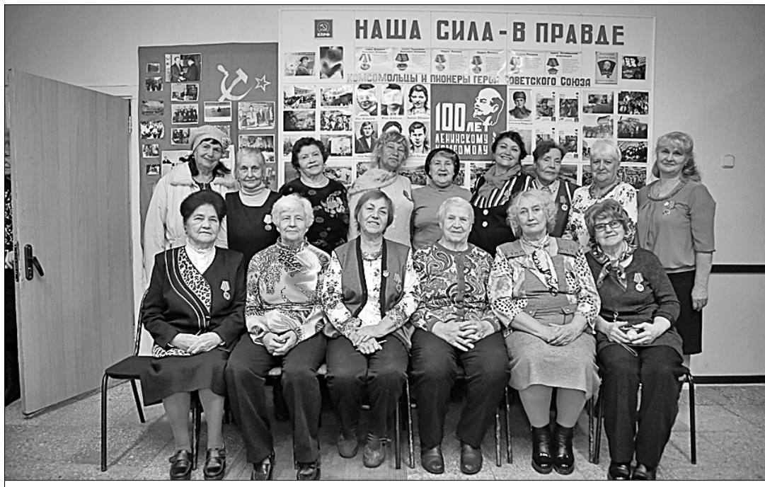
● Жигулёвские активистки «ВЖС — «Надежда России».

Месяца через три деньги на ремонт детской поликлиники городская власть всё-таки нашла, и от продажи социального значимого медицинского учреждения решено было отказаться. Сейчас она успешно работает. В детском дневном стационаре лечатся пятнадцать ребятишек. К услугам девочек и мальчиков плавательный бассейн.