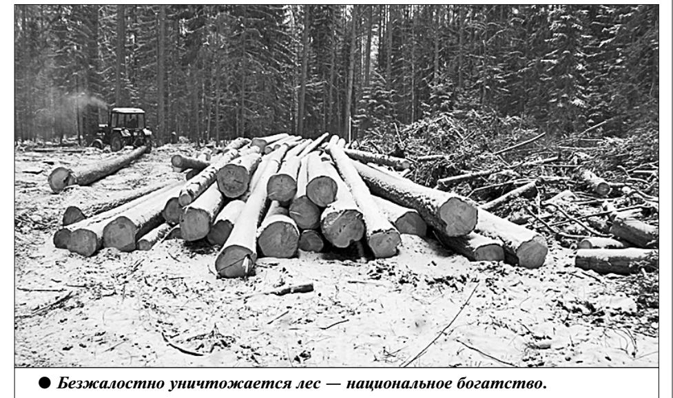
Безжалостно уничтожается лес — национальное богатство.

Тверская область, Торопецкий район. Федеральная трасса М-9 «Балтия». 392-й километр от Москвы. Съёмочная группа телеканала «Красная Линия» считает проезжающие мимо тяжёлые грузовики: за тридцать минут прошло около полусотни. Из них 12 — лесовозы. Брёвна везут в сторону Твери. Обратно, на делянки и вырубку, машины идут порожками.