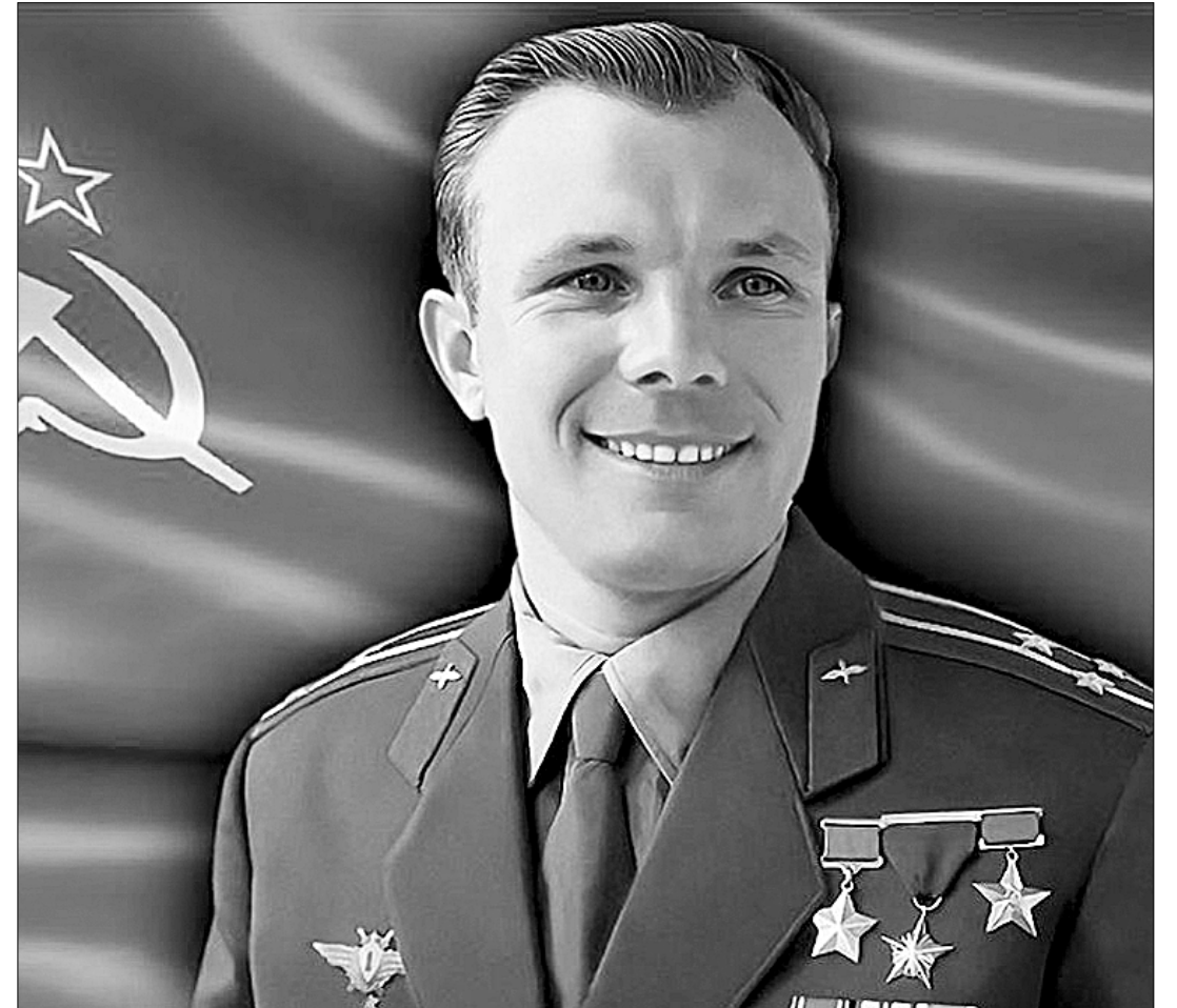
● 85 лет тому назад, 9 марта 1934 года, родился лётчик-космонавт СССР, Герой Советского Союза Юрий Алексеевич Гагарин.