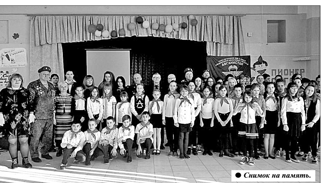
Стишок на память.