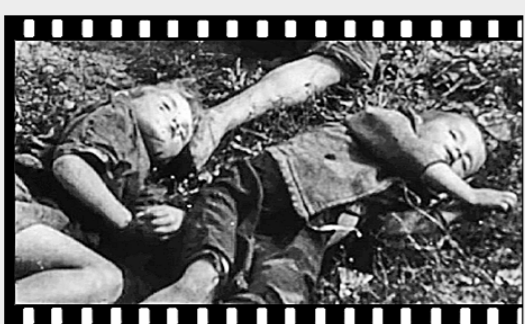
● Кадры из фильма «Обыкновенный фашизм».

В фильме использованы материалы немецких архивов, кадры, снятые личным фотографом Гитлера, съёмки из концлагерей, где находились тысячи людей, впоследствии замученных и уничтоженных нацистами. Сегодня фильм Михаила Ромма, к горькому сожалению, не утратил своей актуальности. Фашизм вновь поднимает голову: эссовские марши на Украине, снос памятников советским солдатам в Польше и Прибалтике, возрождение культа Гитлера и гитлеровских коллаборационистов. Это явление живо и по сей день, как живут в человеческом теле метастазы рака, если вовремя не ликвидирована злокачественная опухоль.