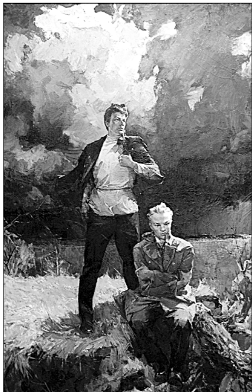
● «Братья Ульяновы». 1969—1970. Картина Н.П. Карачаркова. Чувашский государственный художественный музей.

Искровец Н.Л. Мещеряков, приезжавший из России к Ленину в 1901 году, писал, что