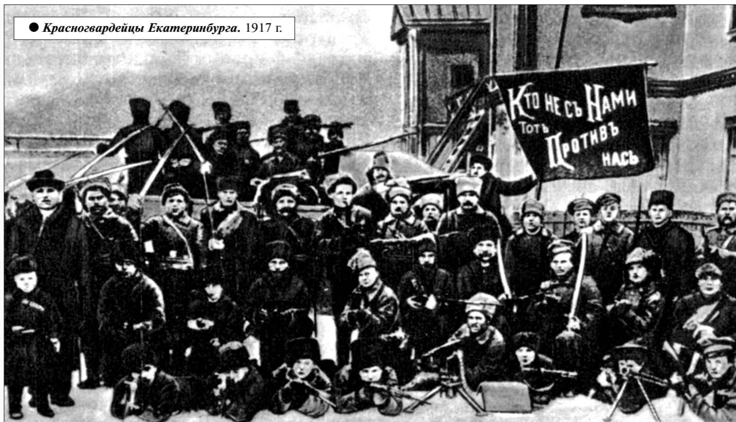
● Красногвардейцы Екатеринбурга. 1917 г.

С 1880-х годов чем дальше, тем мощнее заявлял о себе рабочий вопрос. Если в 1895 году насчитывалось примерно 350 выступлений рабочих с 89 тысячами участников, то в 1902 году соответственно было 694 массовых выступления рабочих со 147,2 тысяч участников. Только во всеобщей политической стачке на