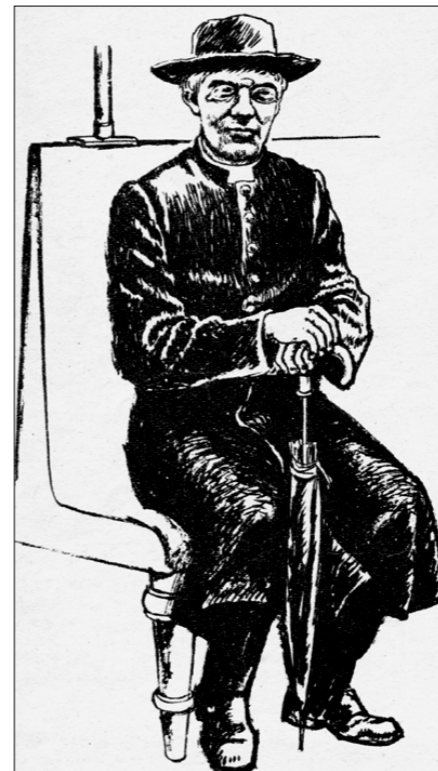
● Ленин — пастор. Рисунок из финского журнала «Uusi Ruvallehti».