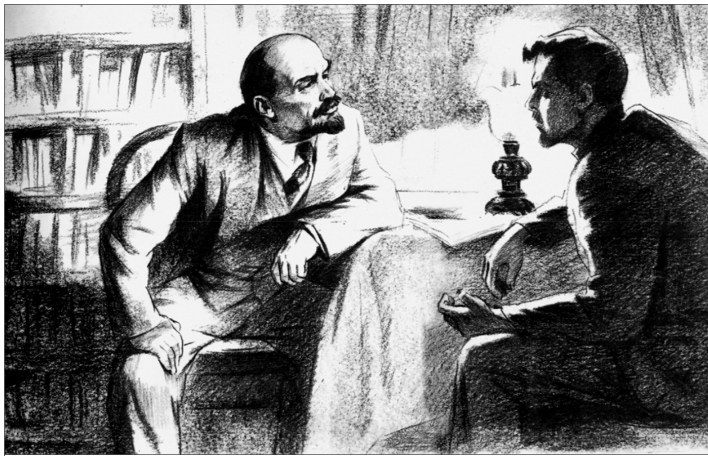
● Ленин и Латукка (финский коммунист). Рисунок Д. Боровского.