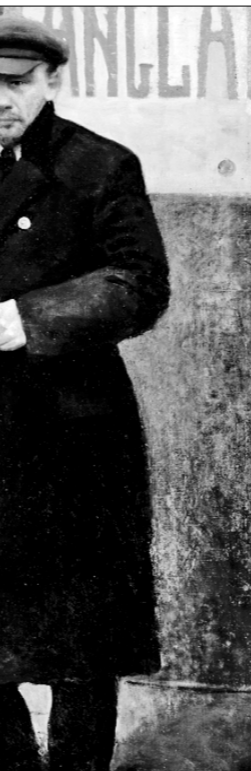
● «В.И. Ленин в эмиграции. 1905—1907 годы». Картина Э.О. Визеля. Государственный исторический музей.