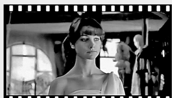
Кадр из фильма «Сказки старого Арбата».