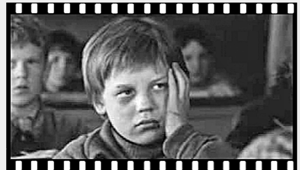
Кадр из фильма «Уроки французского».

«Уроки французского» — фильм-правда, которому веришь сразу и безоговорочно. Доброта, милосердие, самопожертвование — авторы рассуждают о самых главных жизненных правилах, таких простых и таких трудных... И это особенно ценно сегодня, когда нам так необходимы уроки человечности.