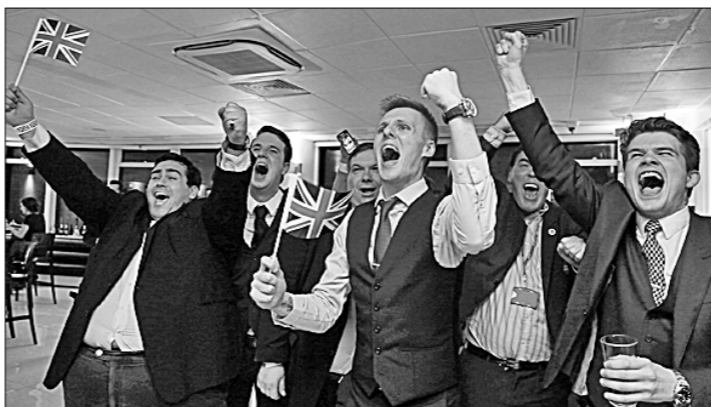
● Год Обезьяны запомнился сразу двумя событиями, исход которых полностью опроверг предсказания аналитиков, социологов и букмекеров. Так, британцы на всенародном референдуме о выходе из Евросоюза вопреки ожиданиям проголосовали за брэкзит — полный отказ от членства в ЕС. Итоги плебисцита породили панику на биржах из-за обвала фунта и повлекли за собой смену состава консервативного правительства Соединённого Королевства, у руля которого вместо ушедшего в отставку премьера Дэвида Кэмерона встал бывший глава МВД Тереза Мэй.