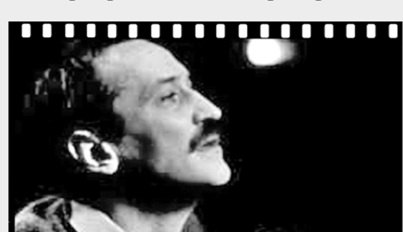
Кадр из фильма «Успех».