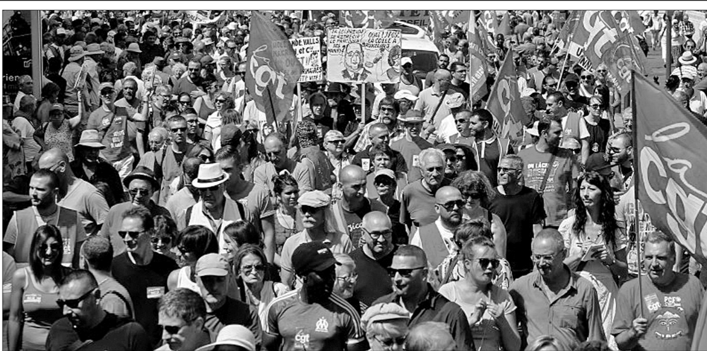
● Бюджетно-долговой кризис, испытывающий Европу на прочность с конца 2008 года, вновь заставил руководство ряда стран Старого Света прибегнуть к антинародным мерам для снижения госрасходов. Наиболее непопулярной оказалась реформа Трудового кодекса, утверждённая правительством Франции в обход парламента. Новый закон, в частности, предусматривает заметное упрощение процедуры увольнения персонала и полагает на одно из ключевых достижений французской социальной системы — 35-часовую рабочую неделю (отныне её можно увеличивать до 60 часов). Беспрецедентная атака «социалистического» правительства на трудовое законодательство спровоцировала многотысячные демонстрации и волну забастовок по всей стране.