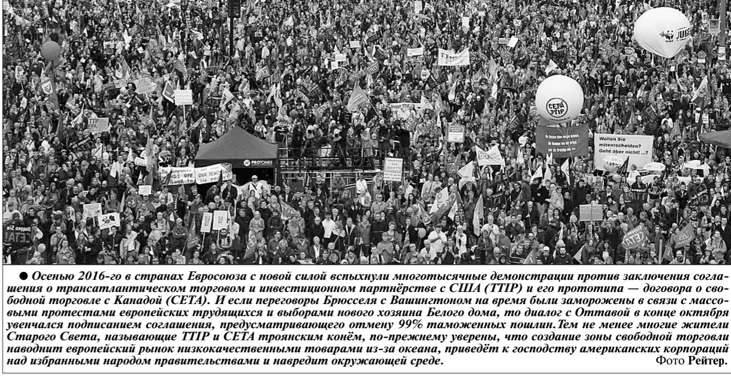
● Осенью 2016-го в странах Евросоюза с новой силой вспыхнули многотысячные демонстрации против заключения соглашения о трансатлантическом торговом и инвестиционном партнёрстве с США (ТТП) и его прототипа — договора о свободной торговле с Канадой (СЕТА). И если переговоры Брюсселя в Вашингтоне на время были заморожены в связи с массовыми протестами европейских трудящихся и выборами нового хозяина Белого дома, то диалог с Оттавой в конце октября увеличился подписанием соглашения, предусматривающего отмену 99% таможенных пошлин. Тем не менее многие жители Старого Света, называющие ТТП и СЕТА транснациональным конём, по-прежнему уверены, что создание зоны свободной торговли наводит европейский рынок низкокачественными товарами из-за океана, приведёт к господству американских корпораций над избранным народом правительствами и навредит окружающей среде.

Сергей КОЖЕМАКИН. (Соб. корр. «Правды») г. Бишкек.