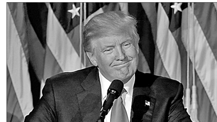
● Не оправдались и прогнозы в отношении победителя президентской гонки в США: триумф 70-летнего республиканца Дональда Трампа, не имеющего политического опыта эксцентричного медиамагната-миллиардера с репутацией балбута и скандалиста, застал врасплох большинство экспертов, предсказавших успех ставленнику демократов экс-госсекретарю Хиллари Клинтон — первой в истории страны женщине — кандидату на главный пост страны. Помимо Белого дома, республиканцам удалось захватить сенат и, таким образом, получить контроль над обеими палатами конгресса.