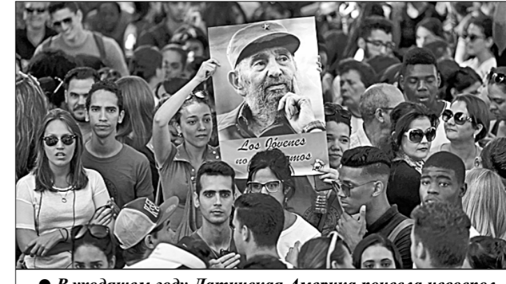
● В уходящем году Латинская Америка понесла невосполнимую утрату: 25 ноября в Гаване в возрасте 90 лет скончался один из выдающихся политических деятелей XX столетия, главнокомандующий Кубинской революцией Фидель Кастро. На церемонии прощания с бесменным лидером острова Свободы с 1959 по 2006 год, ставшим для народов многих стран мира идеологом борьбы с американским империализмом, собралось около миллиона человек. Почтить память великого Команданте прибыли президенты и представители руководства 50 государств.