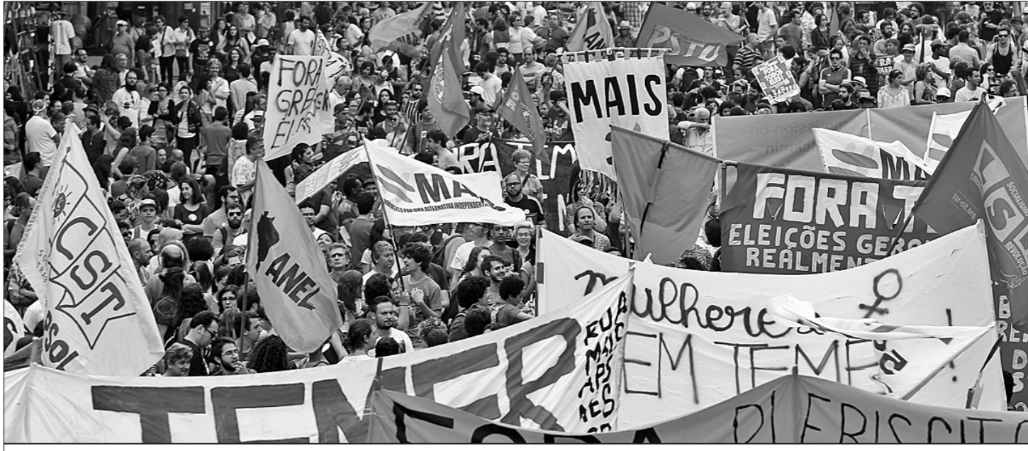
● Дестабилизация политической ситуации в ряде латиноамериканских государств стала одной из основных информационных тем уходящего года. Наибольший международный резонанс вызвал импичмент президента Бразилии Дилмы Руссефф, названный её многочисленными сторонниками в стране и за рубежом незаконной смелой властью. Ключевым моментом в свержении представительницы левой Партии трудящихся послужил громкий коррупционный скандал вокруг нефтяной госкорпорации «Петробрас»: в нём оказалась замешана вся политическая элита Бразилии, включая ближайших соратников главы государства. Расследованием хищений воспользовалась правая оппозиция, обвинившая президента в присвоении бюджетных средств. Массовые акции протеста приверженцев Руссефф, которые требовали отставки нового лидера страны Мишела Темера и его правительства, взявших курс на сокращение госрасходов путём урезания социальных программ, сотрясли страну более полугода.