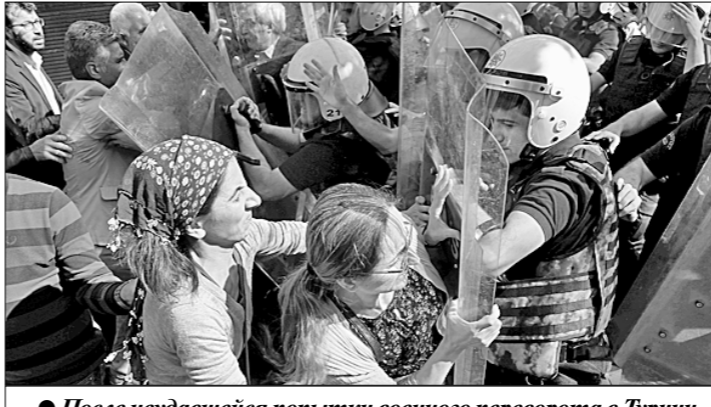
● После неудавшейся попытки военного переворота в Турции, в ходе которой погибли 270 человек, правительство президента Реджепа Тайипа Эрдогана развернуло широкомасштабную карательную операцию, окрещённую «большой чисткой». За пять месяцев с момента введения 15 июля 2016 года чрезвычайного положения 110 тысяч человек были арестованы, уволены, сокращены или отстранены от должностей. Репрессии затронули политиков, журналистов, юристов, учёных, судей, военных, заподозренных в пропаганде терроризма и связях с запрещённой в стране Рабочей партией Курдистана.