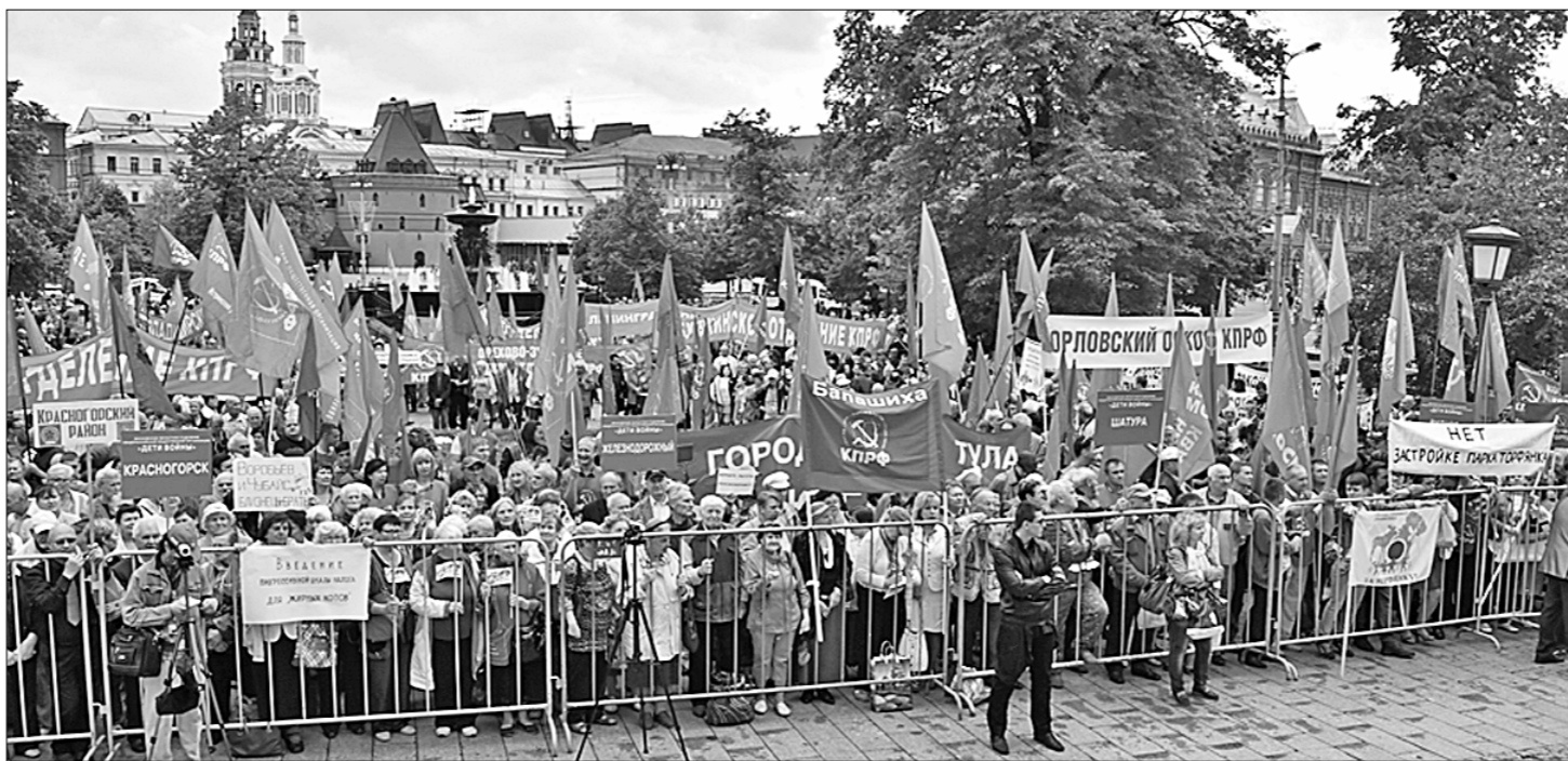
На призывы ЦК КПРФ провести 29 августа Всероссийскую акцию протеста против антинародной социально-экономической политики властей откликнулись граждане по всей стране, а на митинг в Москве вышли не только жители столицы, но и Подмосковья, Курской, Тульской и других областей.