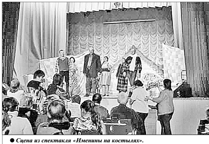
Сцена из спектакля «Именины на костылях».