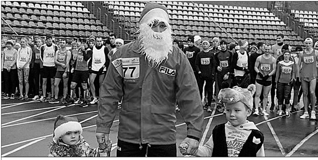
● В белорусском городе Гродно седьмой год подряд легкоатлетический сезон завершается необычным новогодним забегом. Главная его особенность — костюмированный забег на 400 метров. К старту допускаются лишь те, кто решил поучаствовать в соревнованиях в костюме Деда Мороза или Снегурочки. Вторую дистанцию — 4 тысячи метров — могут преодолевать все желающие.