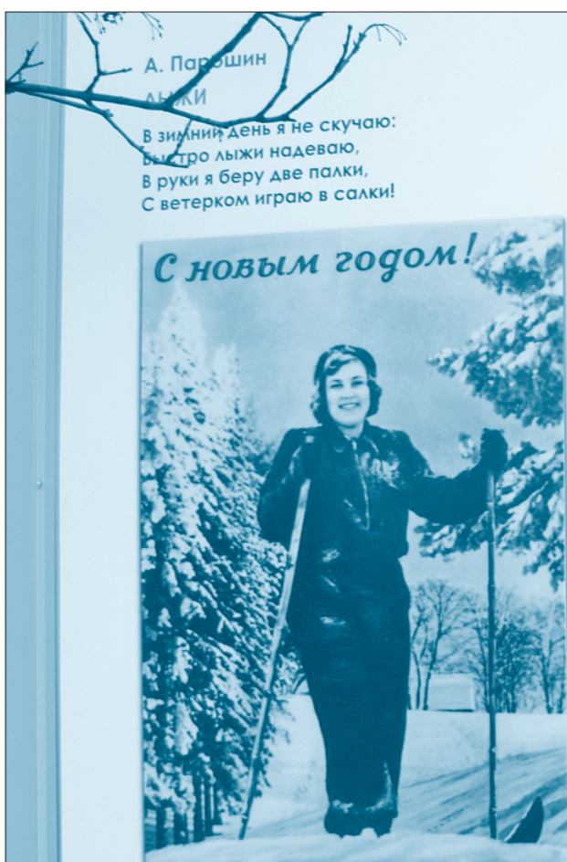
А. Парашин. «Метки». В зимний день я не скучаю: быстро лыжи надеваю, в руки я беру две палки, с ветерком играю в салки! С новым годом!