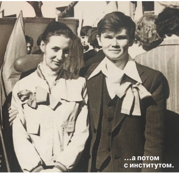
...а потом с институтом.