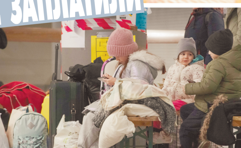
В одночасье маленькие украинцы потеряли и Родину, и родителей.