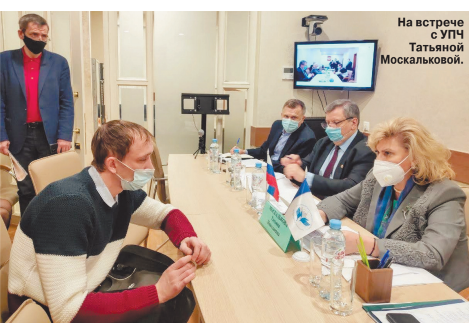
На встрече с УПЧ Татьяной Москальковой.