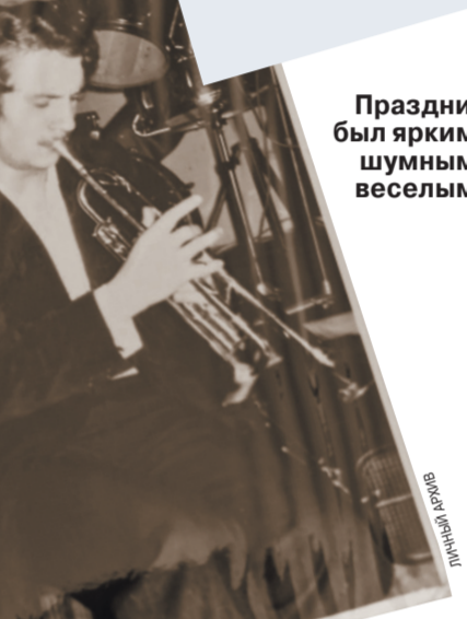
Праздник был ярким, шумным, веселым.

«Голуби, марши, «сорокаградусная» во внутреннем кармане: как отмечали Первомай в советское время