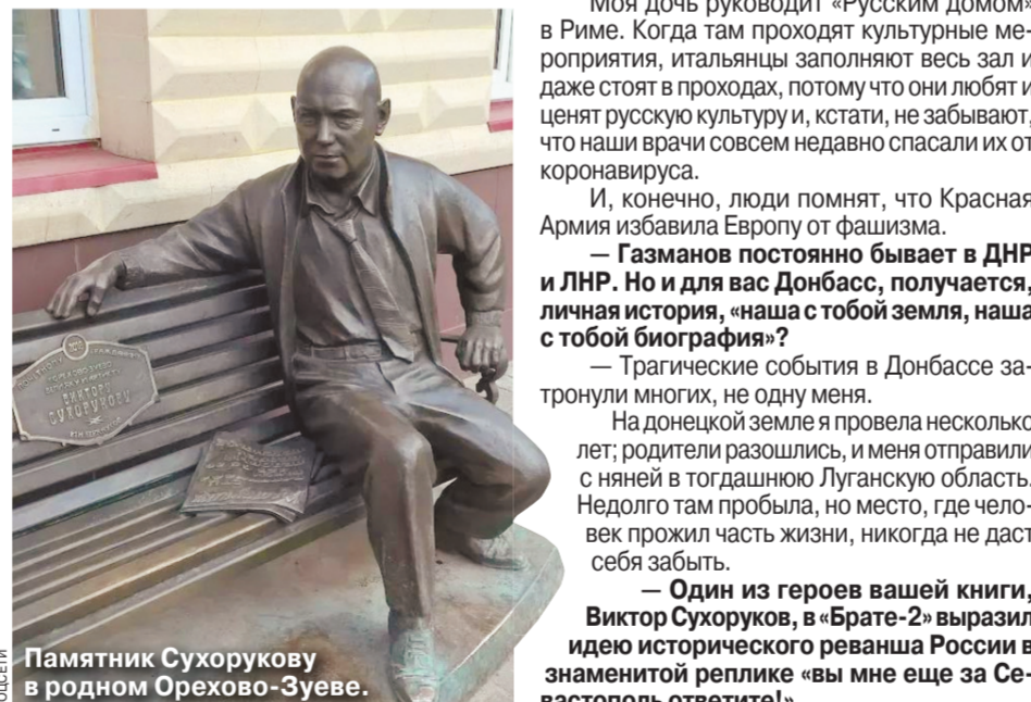
Памятник Сухорукову в родном Орехово-Зуеве.