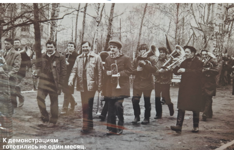
К демонстрациям готовились не один месяц.