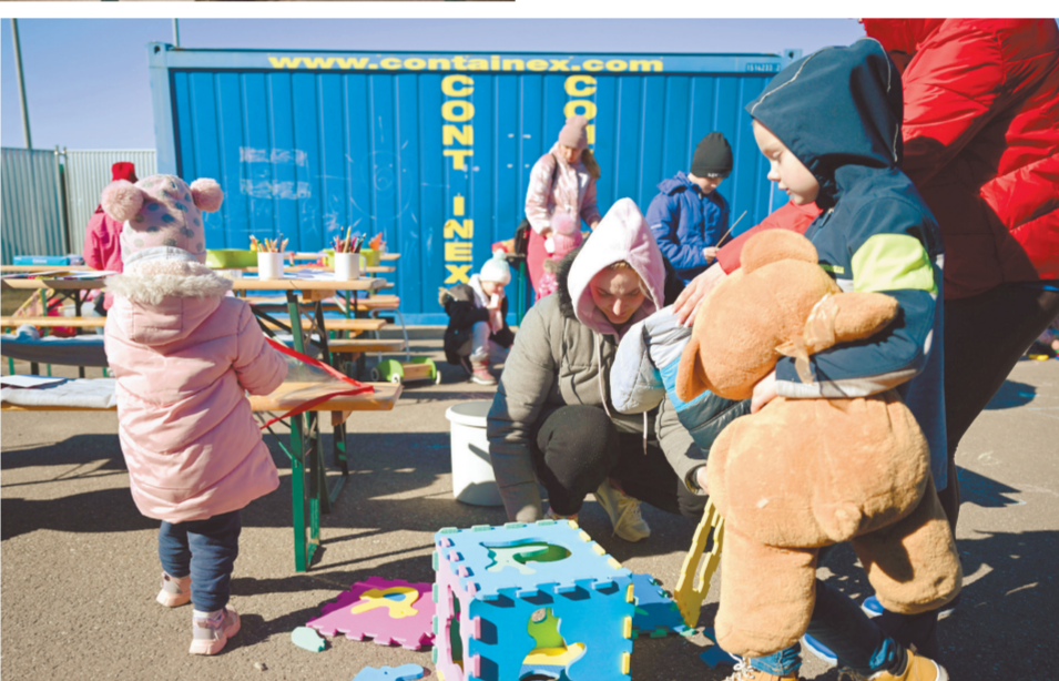
Европа приняла миллионы украинских беженцев.