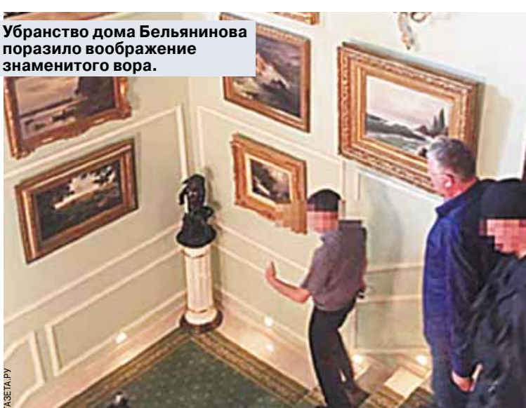
Убранство дома Бельянинова поразило воображение знаменитого вора.