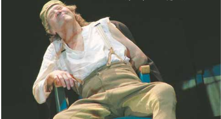
Кадр из фильма «Дрейден-сюита».