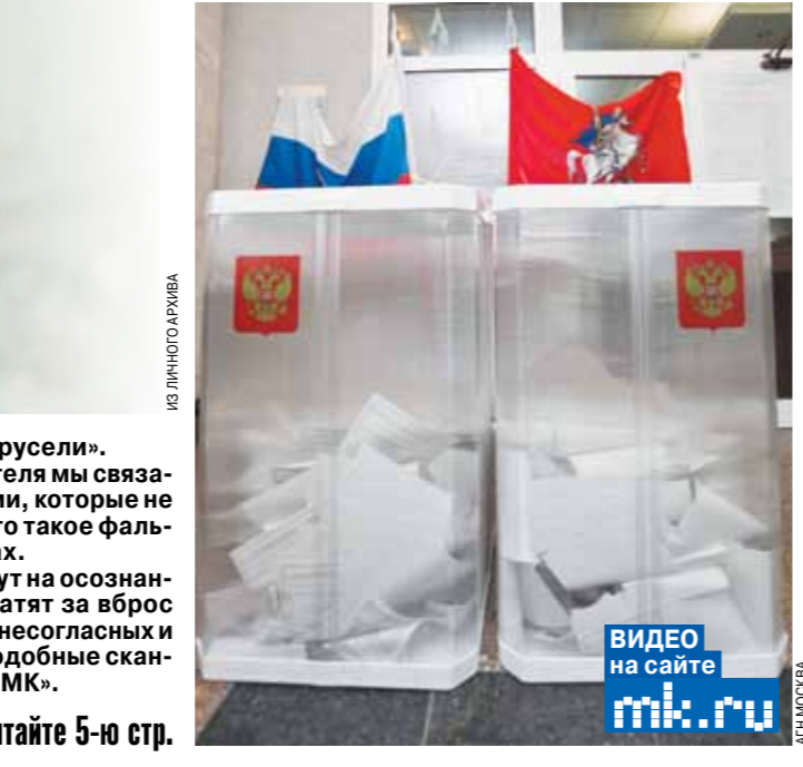
ВИДЕО на сайте mk.ru

На следующей неделе страна отметит День учителя. Но в этот раз не все педагоги смогут принять подарки и поздравления от благодарных воспитанников. Более того, некоторые преподаватели еще не скоро смогут переступить порог учебного заведения, если вообще смогут. Подкосили этих учителей минувшие выборы депутатов в Госдуму. Сегодня праздник омрачен для тех, кто был пойман с поличным на операции «вбросы-стеночка-карусели».