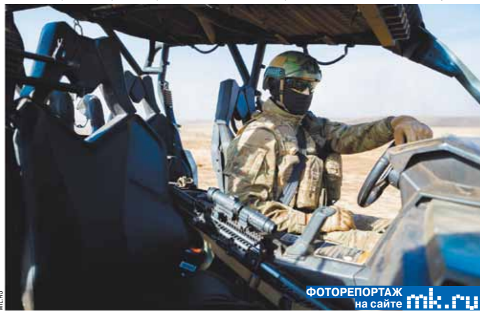
ФОТОРЕПОРТАЖ на сайте mk.ru

Второй по важности вопрос самообеспечения — снабжение водой, и для таких целей были разработаны и внедрены пункты полевого водообеспечения. Встретившие нас военнослужащие Инженерных войск первым делом предложили попробовать результат своих трудов — питьевую воду, прошедшую многоступенчатую очистку. На вкус — ничем не хуже бутылочной, продающейся в магазинах, даже более свежая и живая. Процесс работы очистного комплекса выглядит обманчиво просто: к любому водоему, да хоть к болоту, подгоняются четыре установки, смонтированные на шасси «КамАЗов», опускается