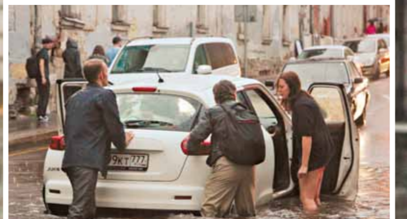
Субботняя непогода принесла Москве новый климатический рекорд — за сутки в столице выпало 31,7 мм дождя, что почти на 10 мм выше предыдущего максимума в 1933 году.

Ливневая канализация в столице снова «вышла из берегов»