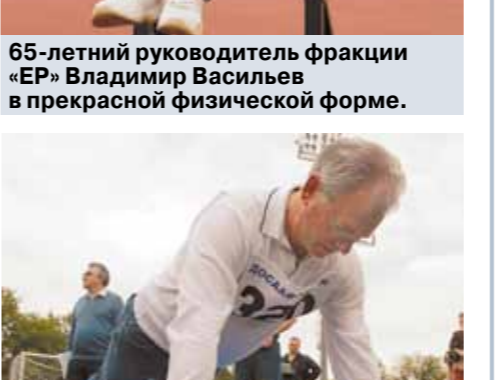
65-летний руководитель фракции «ЕР» Владимир Васильев в прекрасной физической форме.