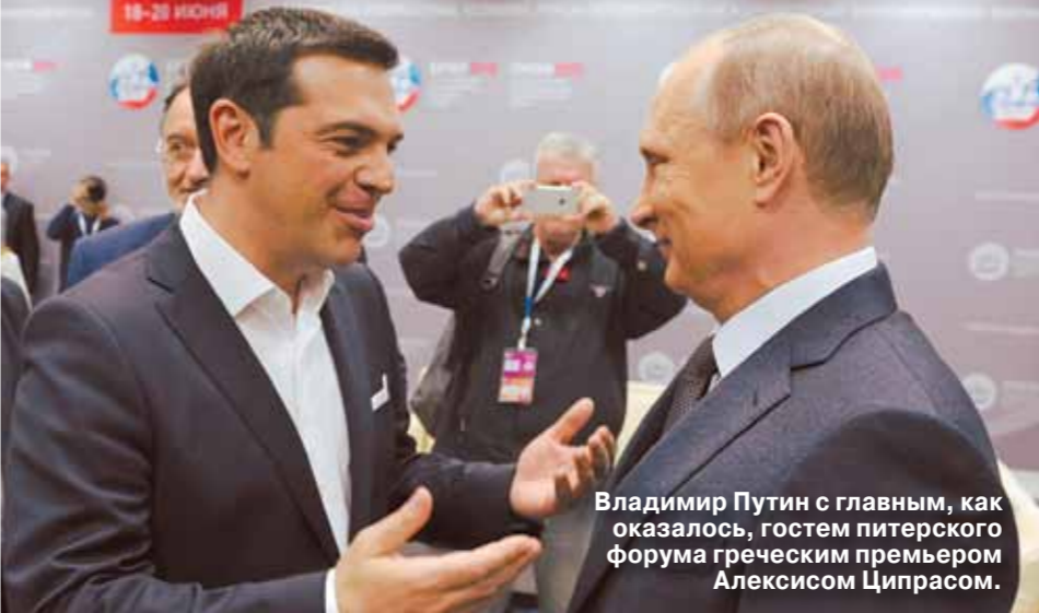
Владимир Путин с главным, как оказалось, гостем питерского форума греческим премьером Алексисом Ципрасом.