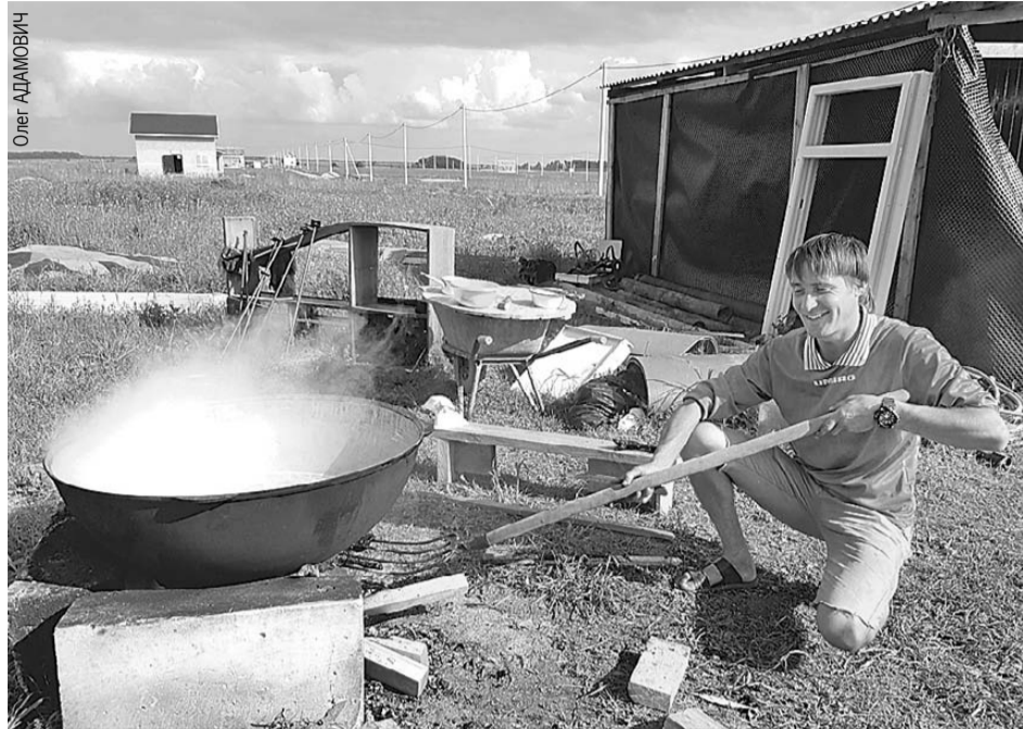
В деревне киргизов еду готовят сразу на всех. Шурпы из такого казана хватает минимум на день. Дежурство по кухне поручают самому незанятому человеку.

Сходство с Америкой на этом не заканчивается. Сейчас строящаяся община похожа на городок в прерии Дикого Запада. Поле, трава по пояс, грунтовка, ведущая от асфальта, и