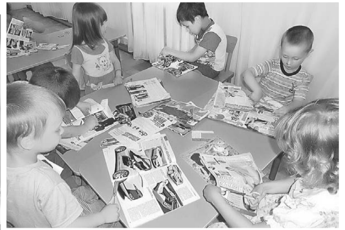
ГКУ РК «СРЦН Усть-Вымского района»