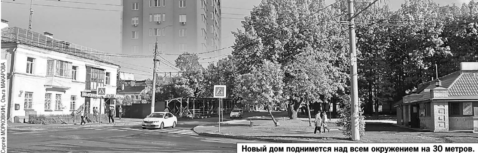
Новый дом поднимется над всем окружением на 30 метров.

Застройщик уверил, что все замечания людей учтут. Правда, ему еще предстоит перевести землю, которая сейчас позволяет лишь возводить малоэтажные дома, в зону застройки среднеэтажными жилыми домами.