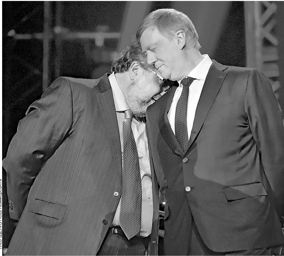
Как же хорошо, когда рядом есть надежное плечо!