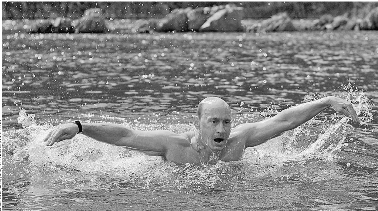
Кадры, на которых Владимир Путин во время отпуска демонстрирует прекрасную физическую форму, не дают покоя политикам и журналистам на Западе. Завидуют? (На фото - Путин во время заплыва по горной реке в Туве в 2009 году.)