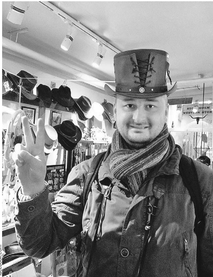
Казус Бабченко: говорит про родную страну гадости и зарабатывает на этом рейтинг и гонорары.

Одна дама, гордящаяся дедом-ветераном, объясняла мне, что фетишизировать оружие не надо, ветераны, мол, так не делали. Вскоре после войны сослуживец ее деда якобы забыл пистолет