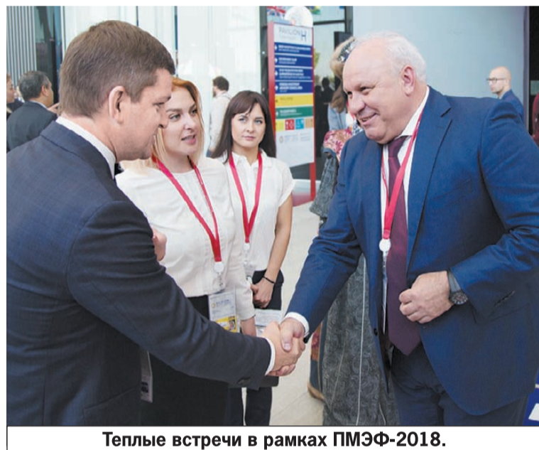
Теплые встречи в рамках ПМЭФ-2018.

Последние полтора года республика жила в режиме жесткой экономии. Но тут