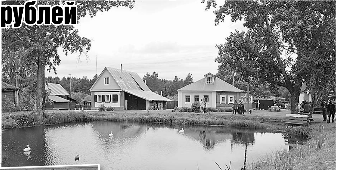
Вежболово гордится «открыточными» видами.