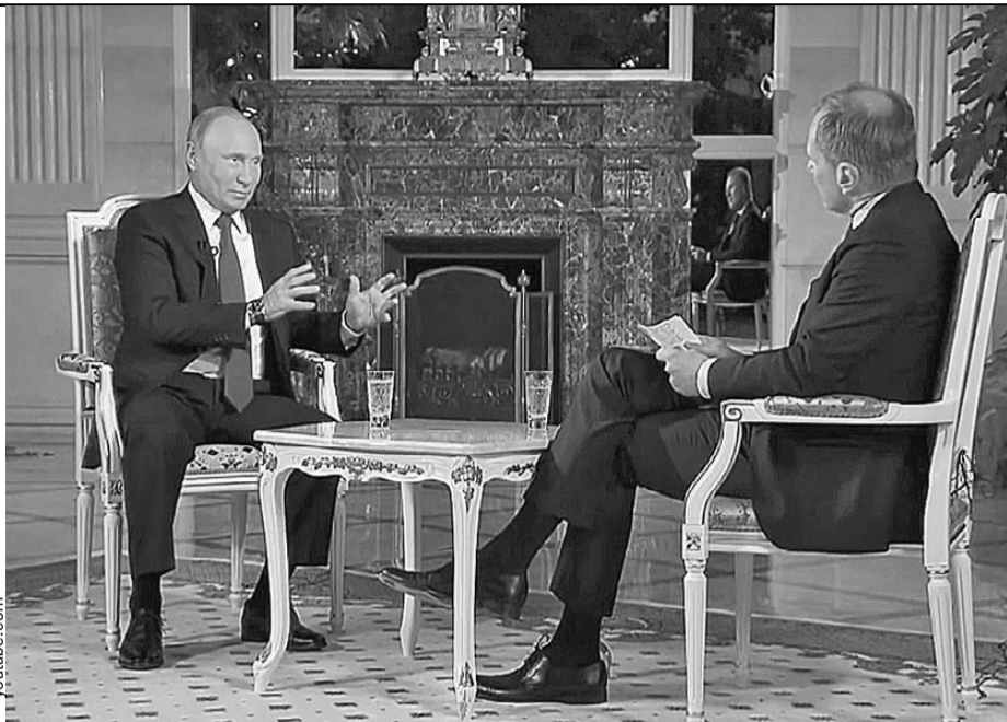
Разговор получился таким энергичным, что австрийский журналист пытался перебить Путина 11 раз (такая «модная» западная манера). И президенту приходилось даже переходить на немецкий, чтобы его остудить.

Мы не хотим, чтобы нам подсунили еще одного, второго, третьего или пятого Саакашвили, бывшего президента Грузии. Мы не