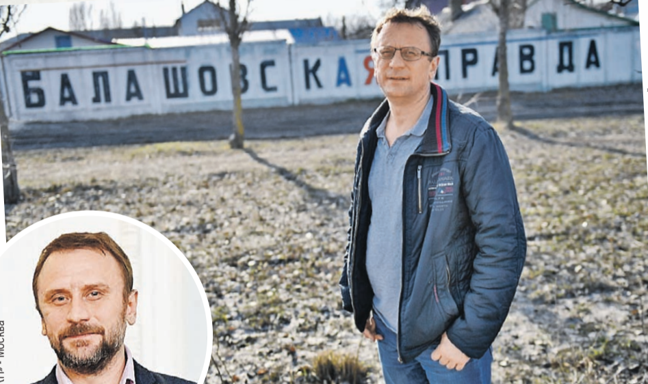
Виктор Гусейнов / «КП» - Москва