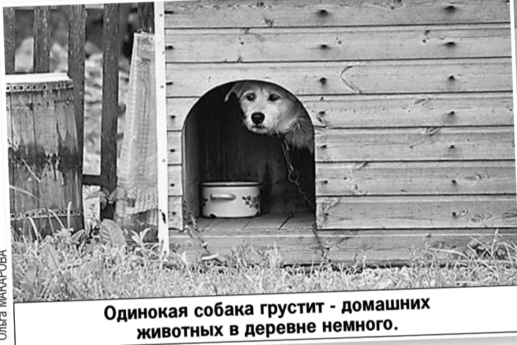
Одинокая собака грустит - домашних животных в деревне немного.