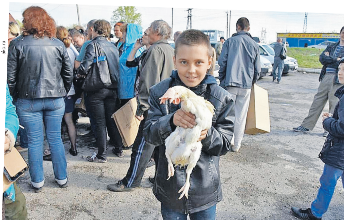
В город Юрга привезли кур для раздачи. Такие бесплатные «подарки от Тулеева» случались в населенных пунктах области чуть ли не каждый месяц.

...Пойду положу гвоздику на ту скамейку в знак окончания эпохи Амангельды Тулеева.