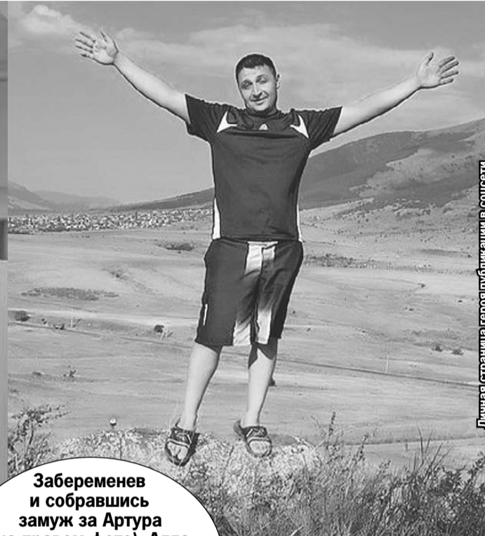
Личная страница героя публикации в соцсети