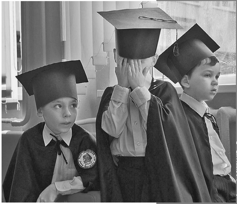
Может, это последнее фото, на котором школьники в ужасе от оценки.

А выглядит она, например, так (цитирую дословно): «Оценка: прочитала эпизод из рассказа «Лошадина фамилия». Достижения: чтение эмоциональное и выразительное. Смогла выбрать интерес-