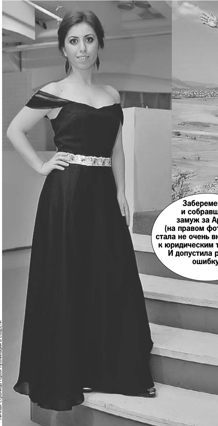
Личная страница героя публикации в соцсети