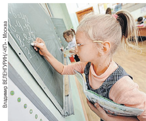
Владимир ВЕЛЕНТУРИН/«КП» - Москва

Подробности читайте на > страницах 3, 8-9.