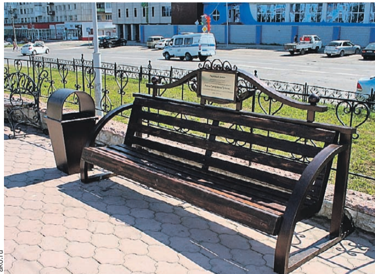
Таблички на лавочках областного центра извещают горожан, что и эти городские удобства появились благодаря неусыпной заботе о земляках со стороны Амана Гумировича.

Я не говорю, что деньги заменят людям детей, но лгать про 5724 рубля на фоне этой суммы низко: так же низко, как постить старые фотографии человека в болезни.