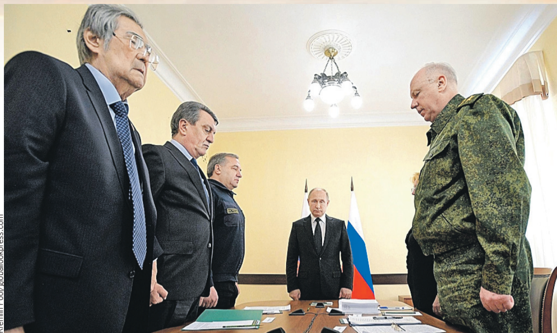
Последняя встреча губернатора Тулеева (на снимке крайний слева) с Владимиром Путиным состоялась 27 марта, когда президент прилетел в Кемерово после страшного пожара в торговом центре «Зимняя вишня». На встрече также присутствовали полпред президента в Сибирском федеральном округе Сергей Меняйло (второй слева), глава МЧС Владимир Пучков (третий слева) и председатель Следственного комитета Александр Бастрыкин (справа).

Но вот в 2016 году случился слом системы: в июле администрация Кемеровской области стала «работать» с собственником разреза «Инской», у которого две смены