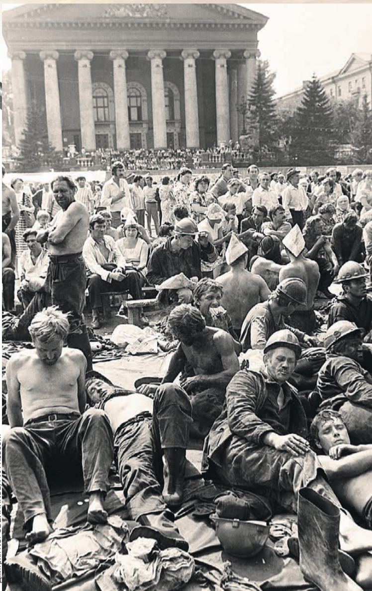
Когда Тулеев возглавил Кузбасс, бастующие шахтеры на центральной площади Кемерова были обычной картиной.

что эти фото - старые, годовой давности, когда сибирского казаха почти одолел сахарный диабет, а теперь Тулеев - сухонький и седой.)