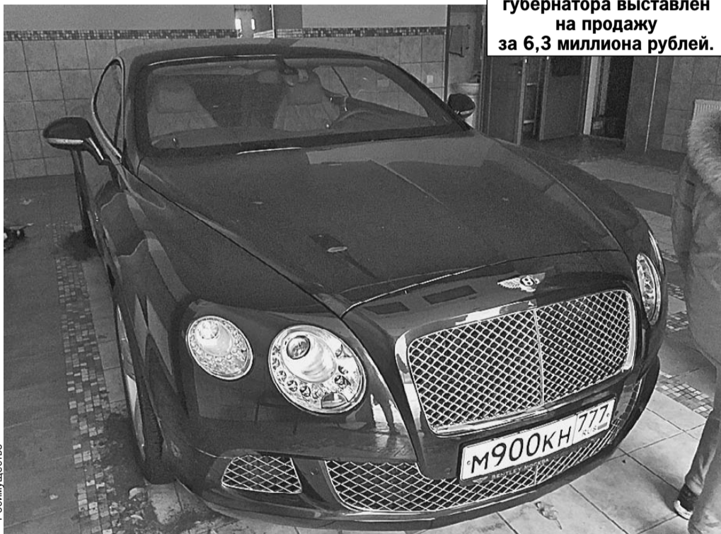
«Бентли» экс-губернатора выставлен на продажу за 6,3 миллиона рублей.

Напомним, Хорошавин 9 февраля был осужден Южно-Сахалинским городским судом на 13 лет колонии строгого режима со штрафом 500 миллионов рублей за взятки.