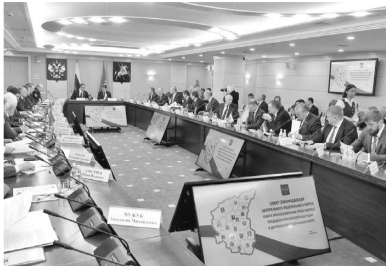
Законодатели обсудили первоочередные меры по повышению уровня жизни граждан.

Обсудили региональные парламентарии и законодательное регулирование добровольческой деятельности. Объявление Президентом России 2018 года Годом добровольца открыло новые перспективы для развития в стране этого благотворитель-