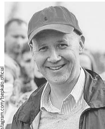
Валерий Цепкало - последний из реальных соперников Батяки, оставшийся на свободе.