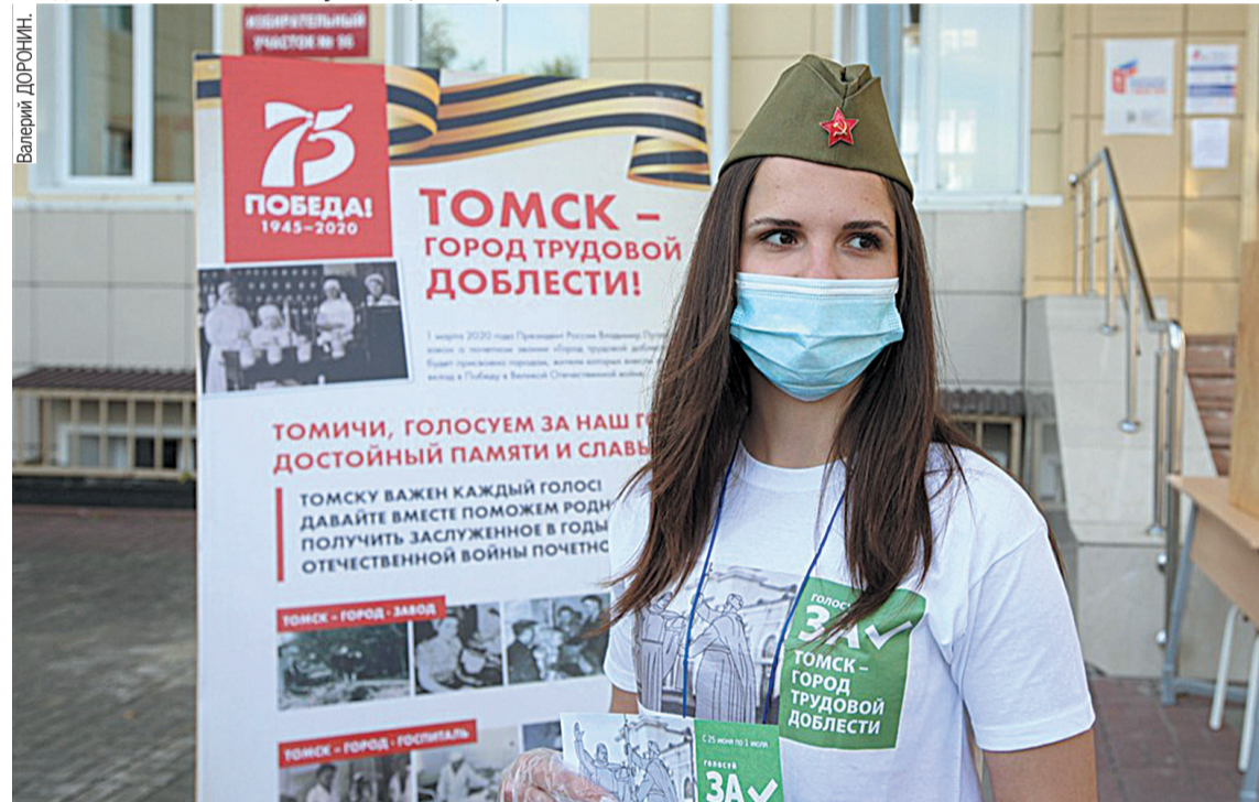
Больше 145 тысяч томичей подали голоса за присвоение областному центру звания «Город трудовой доблести».

Инициативу муниципальных властей о награждении Томска поддержали депутаты городской и областной Думы, советы ветеранов. С 25 июня по 1 июля