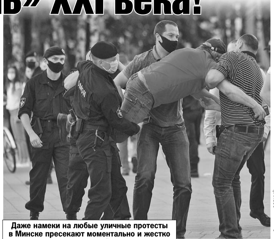
Даже намеки на любые уличные протесты в Минске пресекают моментально и жестко - просто пакуют людей в автозаки.

- (мрачнеет) Настроения в народе такие, что черт знает. Не исключаю, что бывшие коллеги и меня ударят.