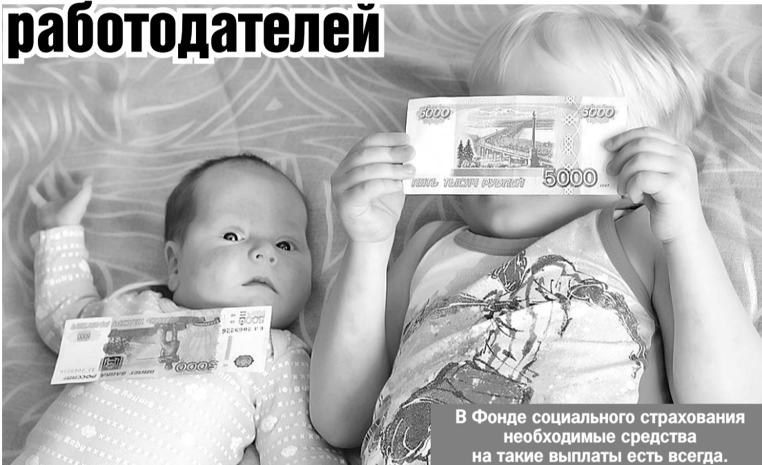
В Фонде социального страхования необходимые средства на такие выплаты есть всегда.

было уже 69. А с 1 июля «Прямые выплаты» начинают работать еще в восьми субъектах РФ. В их числе: республики Башкортостан, Дагестан, Краснодарский край, Ставрополье, Волгоградская, Ленинградская, Тюменская и Ярославская области.