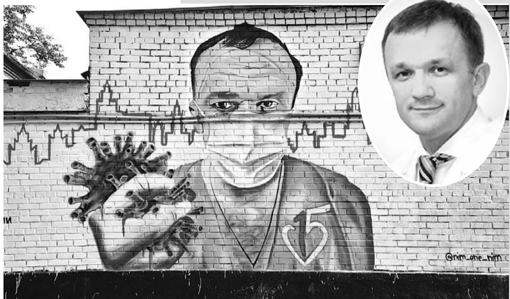
Владимир ВЕЛЕНГУРИН/«КП» - Москва

Нарисовал картину Роман Лозовой из Самары, когда гостил в Москве. Об этом его попросил товарищ, который работал волонтером в Филатовской больнице.