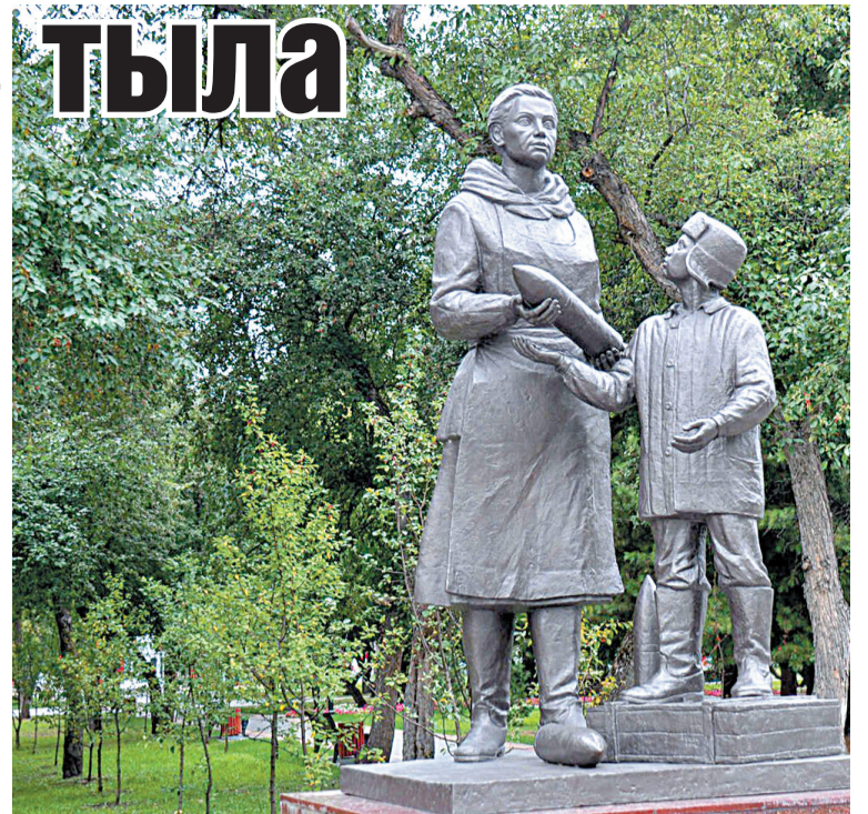
Памятник труженикам тыла был установлен в Томске на Новособорной площади осенью 2014 года.

И вот наступил момент истины: президент РФ Владимир Путин поддержал присвоение почетного звания сразу 20 городам из 28, подавших заявки. Об этом глава государства сообщил 2 июля на заседании российско-