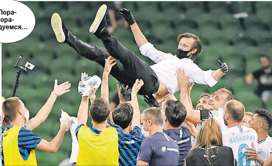
Игроки «Зенита» качали Сергея Семака, который в этот день не только выиграл свой второй чемпионский трофей в качестве тренера, но и впервые стал дедушкой.

- Равные были силы, - признал довольный артист. - Мне понравилось, как играл «Краснодар». Очень азартно, достойно. Хороший противник. «Зенит» рано расслабился, особенно после гола Азмуна. А потом собрались и сделали все здорово. Но, конечно, Азмун молодец! Его дубль во многом и помог нам выиграть. Ну и конечно, вратарь Лунев спас нас от гола, отбив пенальти при счете 1:1. Замечательная игра была. Достойные чемпионы. Будем отмечать в Петербурге. Нынешний состав