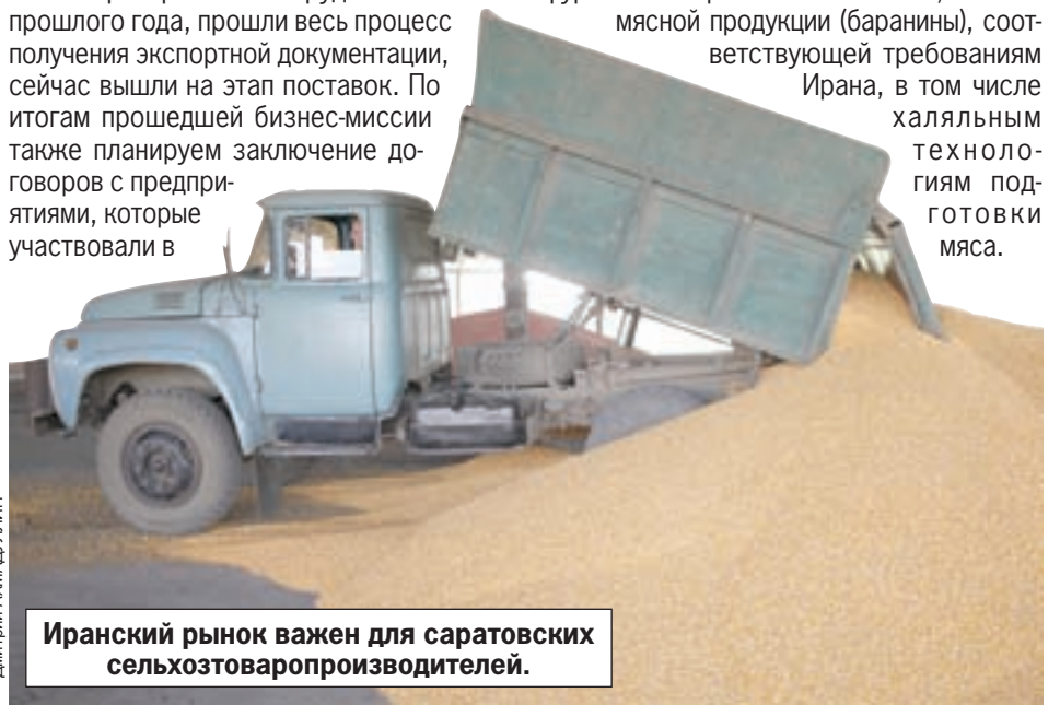
Иранский рынок важен для саратовских сельхозтоваропроизводителей.

В ходе деловых встреч саратовские и иранские предприниматели определили конкретные возможности по совместному строительству и эксплуатации элеватора на саратовской территории, прямым поставкам из Саратовской области продуктового и фуражного зерна любых объемов, а также мясной продукции (баранины), соответствующей требованиям Ирана, в том числе халяльным технологиям подготовки мяса.