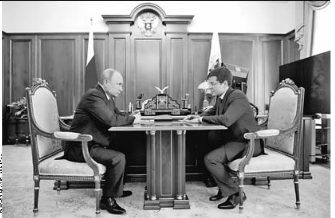
Прежде чем доверить управление богатого газом Ямало-Ненецкого округа молодому технократу Дмитрию Артюхову, Владимир Путин провел с ним личное «собеседование» в своем рабочем кабинете в Кремле.

А вот с назначением и. о. главы Ямало-Ненецкого автономного округа заместителя руководителя этого же региона по эконо-