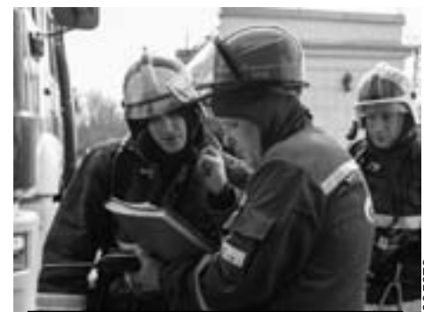
Тяжело в учении - легко в бою.

По тактическому замыслу в результате короткого замыкания электросветильника произошло возгорание оргтехники и мебели в помещении на шестом этаже. Площадь условного пожара составила 47 кв. м, создалась угроза распространения