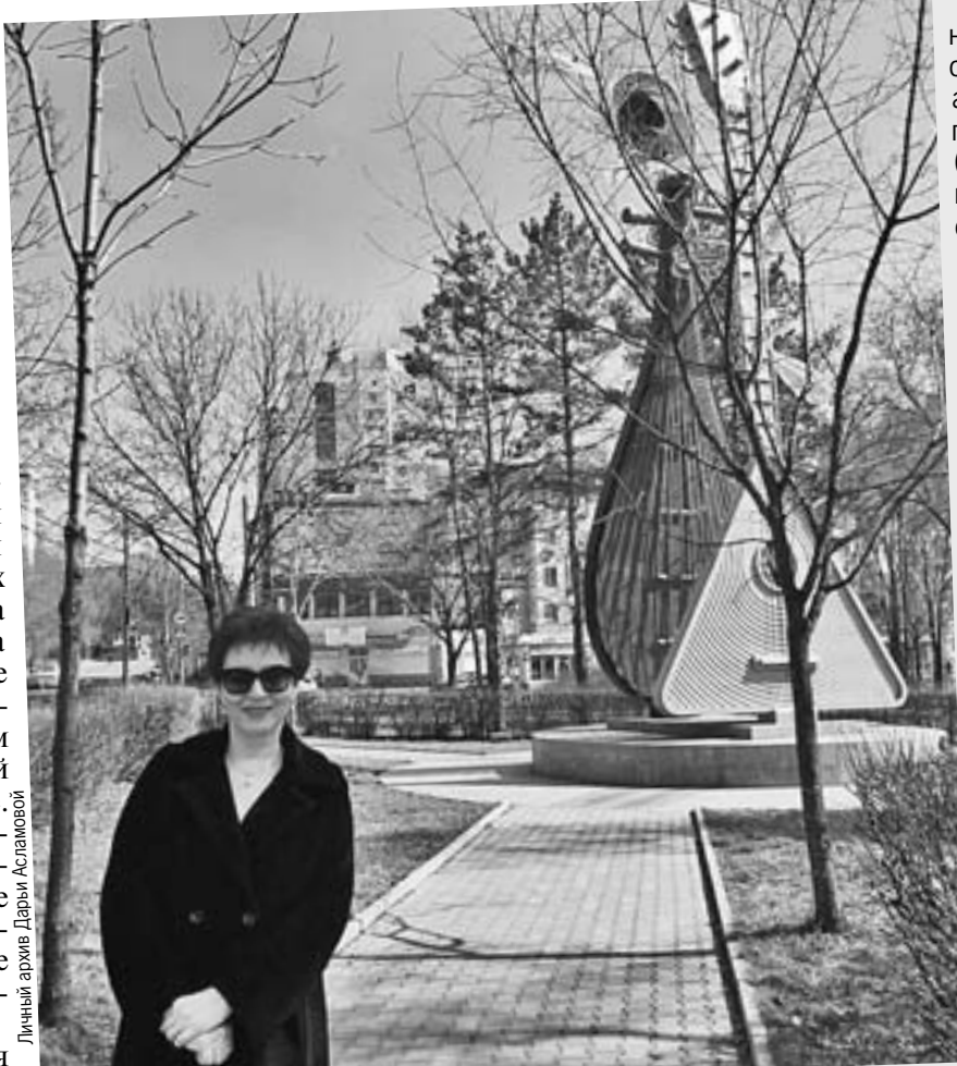
В Хабаровске наш корреспондент обнаружила странный памятник русской и китайской балалайкам. Сложится ли дуэт? Не сфальшивим ли при исполнении?

- Без родословной, болели всякой дрянью. Словом, только прирезать. А вот новые себя покажут.