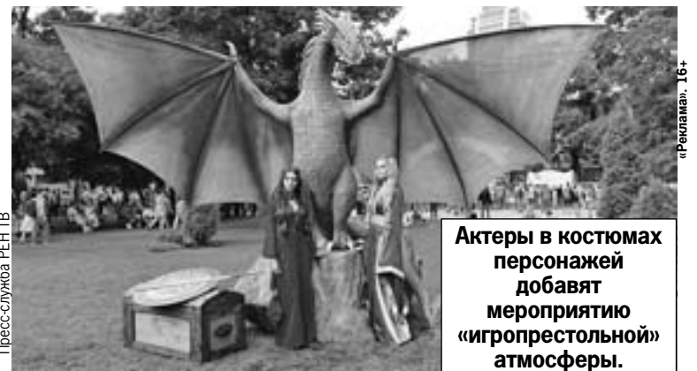
Актеры в костюмах персонажей добавят мероприятию «игропрестольной» атмосферы.

В каждом городе можно будет познакомиться с победителями конкурса «Двойники престолов», который REN TV провел в социальных сетях и на сайте ren.tv.