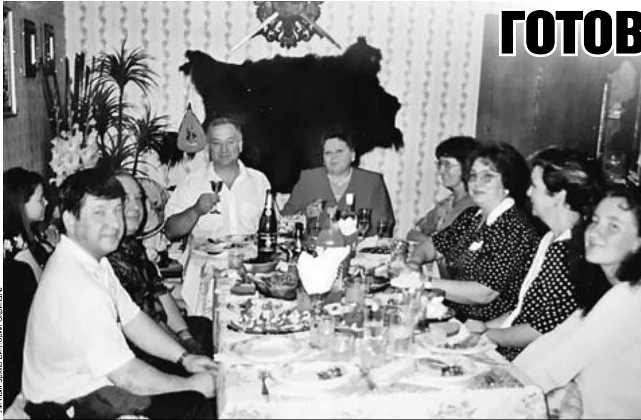
В центре семейного застолья - Сергей Скрипаль и его жена Людмила. Британские спецслужбы считают, что и ее смерть не была случайной. Тело женщины, захороненное в Солсбери, было эксгумировано для экспертизы.