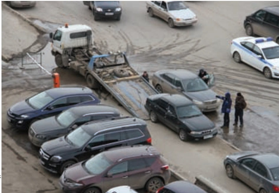
К работе эвакуаторщиков у водителей возникает немало претензий. И развод на деньги - одна из них.