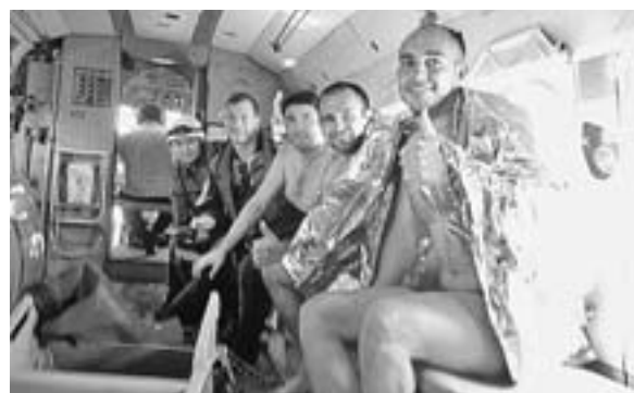
Спасенных туристов (на фото крайние справа) доставили на землю вертолетом.

нулись - скоро. Да только скоро не получилось.