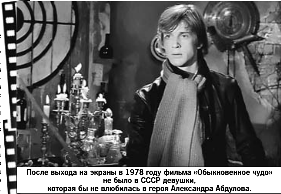
После выхода на экраны в 1978 году фильма «Обыкновенное чудо» не было в СССР девушки, которая бы не влюбилась в героя Александра Абдулова.

дены», - ответил Гинзбург. А там и правда был набран шикарный состав: Лавров, Райкин. Но я не отступила. Гинзбург сдался. «Ну хорошо, есть роль немецкого офицера, который тебя насилюет, - засмеялся он. - Но в кадре ты должна изображать, как тебе противно и горько рыдать». И после этой постельной сцены, где я рыдала, а герой Абдулова осыпал меня монетами, я сказала Саше: «Знаешь, я ведь мечтала о встрече с тобой!» Абдулов был тронут. Он был свободен - только развелся с Ириной Алферовой. Красивый, статный. Я ему сразу понравилась. Так начался наш бурный роман.