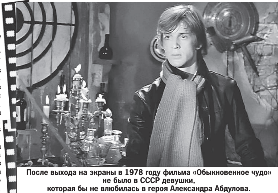
После выхода на экраны в 1978 году фильма «Обыкновенное чудо» не было в СССР девушки, которая бы не влюбилась в героя Александра Абдулова.

дены», - ответил Гинзбург. А там и правда был набран шикарный состав: Лавров, Райкин. Но я не отступила. Гинзбург сдался. «Ну хорошо, есть роль немецкого офицера, который тебя насилует, - засмеялся он. - Но в кадре ты должна изображать, как тебе противно и горько рыдать». И после этой постельной сцены, где я рыдала, а герой Абдулова осыпал меня монетами, я сказала Саше: «Знаешь, я ведь мечтала о встрече с тобой!» Абдулов был тронут. Он был свободен - только развелся с Ириной Алферовой. Красивый, статный. Я ему сразу понравилась. Так начался наш бурный роман.