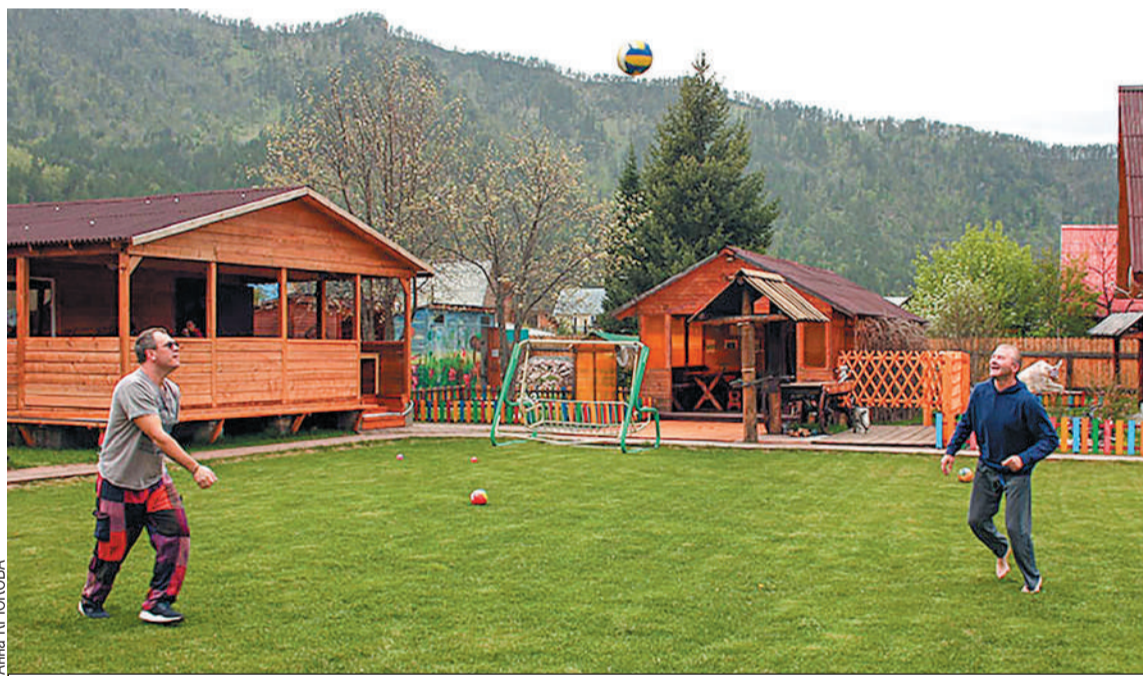
«Сушу LTD» путешественники наградили своей наклейкой.