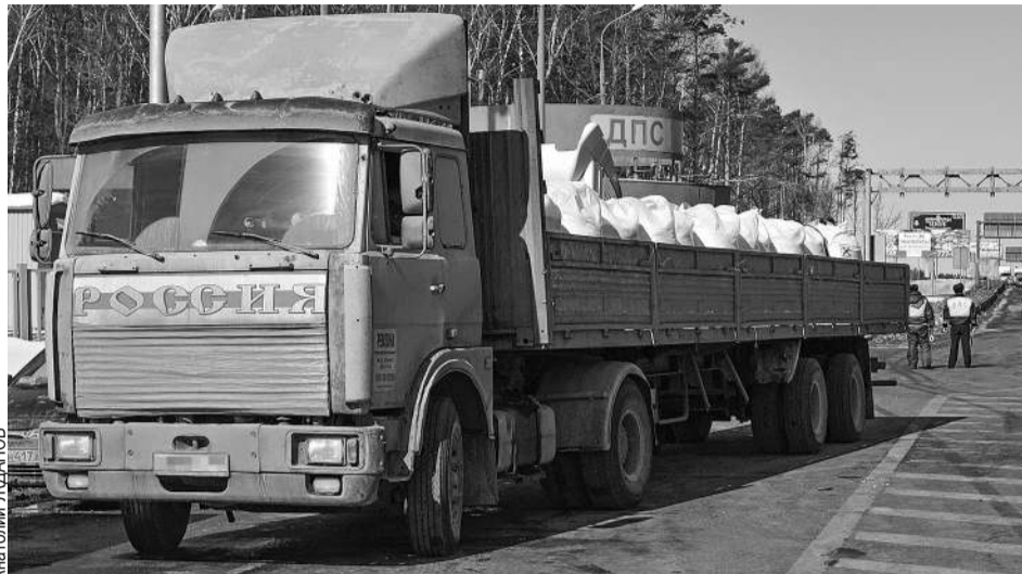
За четыре года КамАЗ превратился в жалкую развалину и стал не нужен банку.