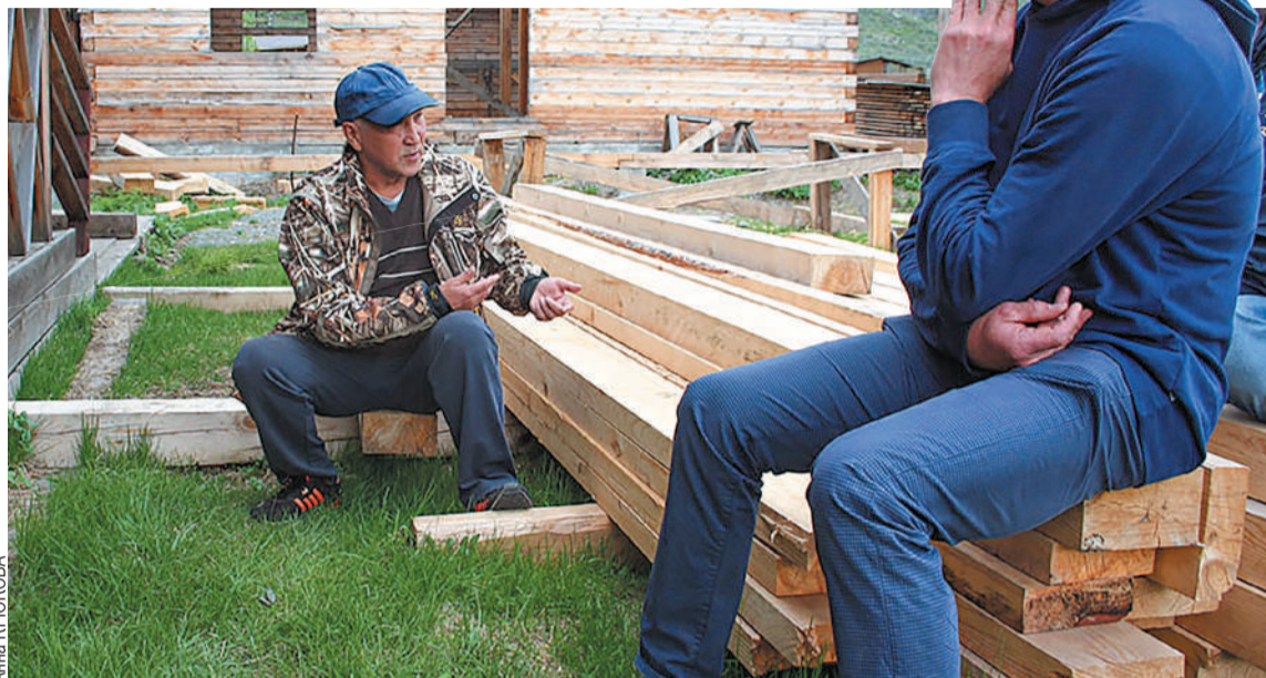
Герман открыл свои способности после 30 лет.