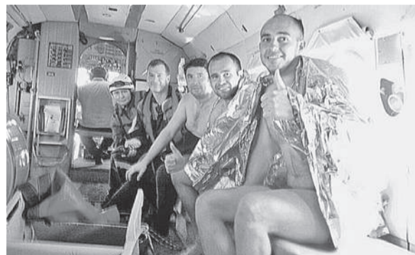
Спасенных туристов (на фото крайние справа) доставили на землю вертолетом.

нулись - скоро. Да только скоро не получилось.