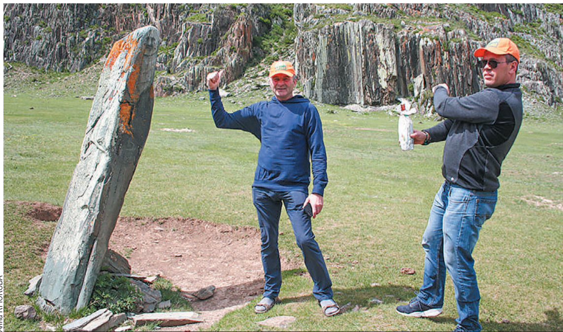
Бутылка с деньгами ждет своего победителя.