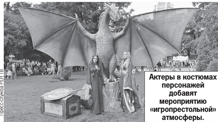
Актеры в костюмах персонажей добавят мероприятию «игропрестольной» атмосферы.

В каждом городе можно будет познакомиться с победителями конкурса «Двойники престолов», который РЕН ТВ провел в социальных сетях и на сайте ren.tv .