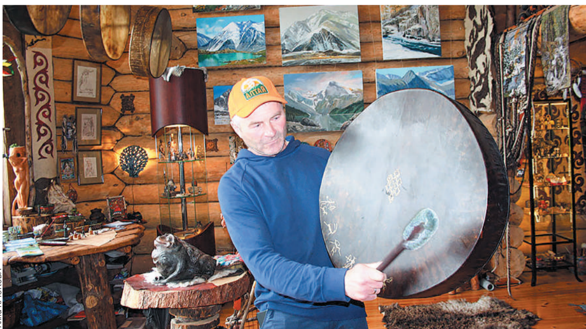
«Шляпники» приобрели для своего музея несколько музыкальных инструментов. В частности, гигантский барабан.