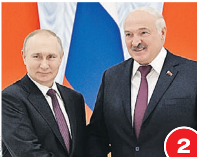
Владимир Путин и Александр Лукашенко: