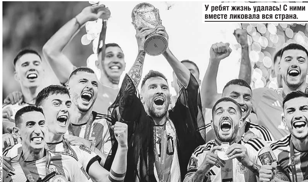
У ребят жизнь удалась! С ними вместе ликовала вся страна.

Далее были призывы бойкотировать мундиаль из-за «тоталитарности режима Катара, поддержки экстремизма и нарушения прав человека» и скандал с запретом капитанам команд УЕФА надевать повязки с радужным символом ЛГБТ-сообщества. Из за чего представители последнего требовали от европейских команд отказаться от участия в «нетолерантном» чемпионате. К счастью, футболу удалось одолеть политику. В выигрыше остались все, кроме ЛГБТ.