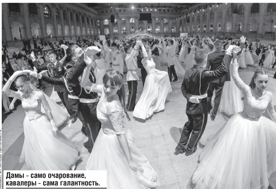
Дамы - само очарование, кавалеры - сама галантность.

А ребята из Полоцкого кадетского училища получили награду в номинации «Лучшая презентация среди зарубежных делегаций». Они уехали домой довольные собой: успели не только потанцевать, но еще и посмотреть Москву во время экскурсии.