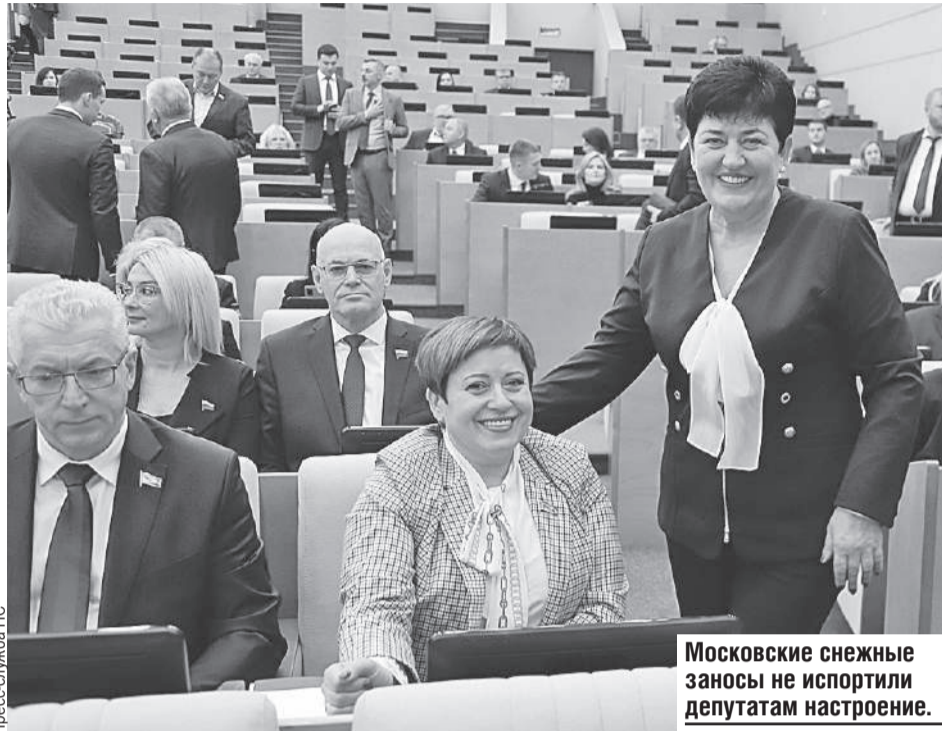
Московские снежные заносы не испортили депутатам настроение.

дая область, каждый район будет понимать, что в рамках Союзного государства эти вопросы находятся на контроле, они финансово обеспечены.