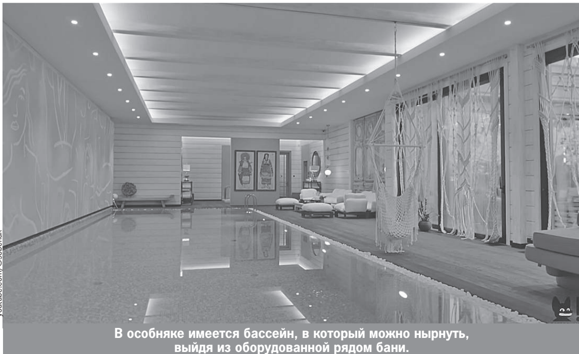
В особняке имеется бассейн, в который можно нырнуть, выйдя из оборудованной рядом бани.

А еще есть просторная баня с выходом к бассейну: «Бассейн всегда был моей мечтой, потому что я человек брезгливый, в общественных бассейнах плавать не могу».