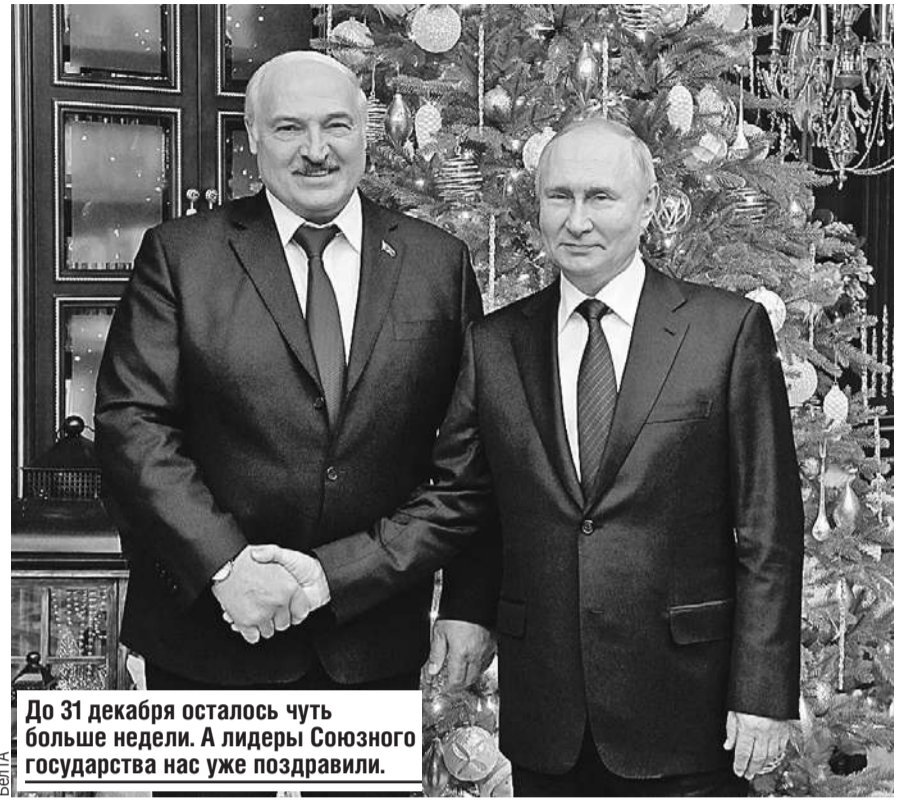
До 31 декабря осталось чуть больше недели. А лидеры Союзного государства нас уже поздравили.

- То, что мы производим, процентов на шестьдесят мы можем потребить. Все остальное производится на экспорт. Когда западные партнеры ушли, мы оказались для огромной России востребованными. Мы идем туда и замещаем тех, кто ушел. Мы вместе с россиянами - учеными, конструкторами - создадим такие образцы, которых не видел мир. Это не замашки какие-то нереальные - мы уже многое сделали.