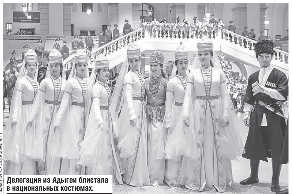
Делегация из Адыгеи блистала в национальных костюмах.