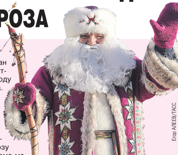
Тол Бабай бережно относится к природе и учит этому всех своих гостей.

и ушли. Но самый маленький не успел за всеми. С тех пор великан стал бродить по окрестностям, изучать природу и набираться ума-разума. Это и есть Тол Бабай - встретив однажды детей, он подружился с ними и с тех пор каждую зиму дарит им подарки. А помощницу удмуртскому Деду Морозу соткала из снежинок сама метель.