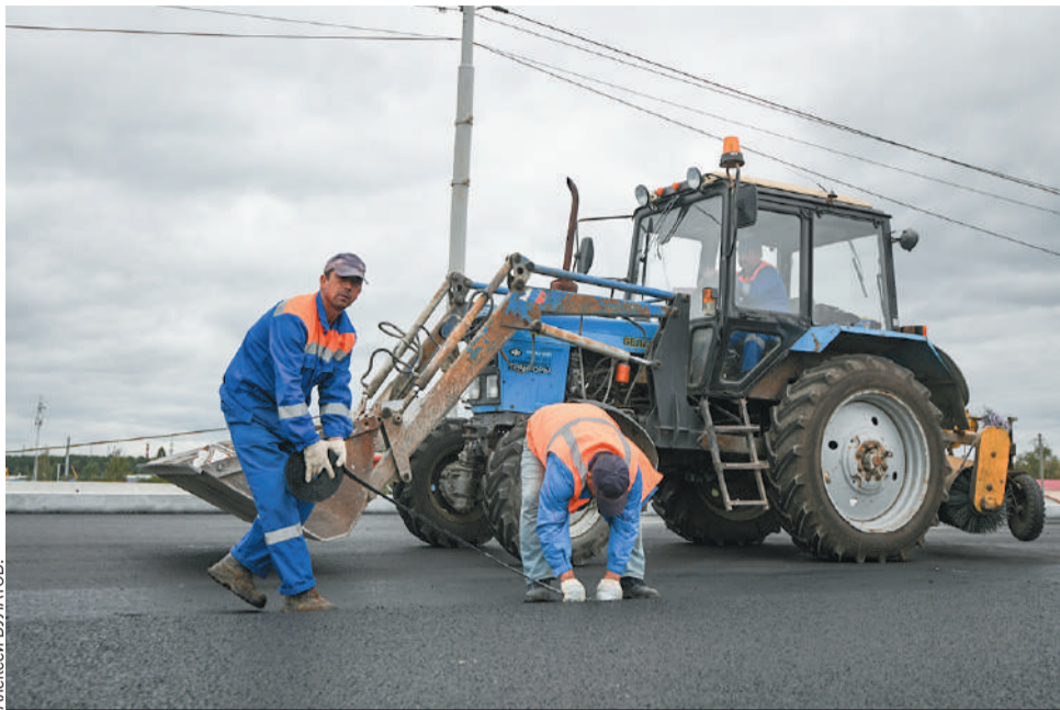
Хорошие дороги – необходимое условие развития региона.

Из 120 километров дорог часть приходится на участки улиц в городах Кузбасса. Так, в Кемерове отремонтируют более 14 километров проезжей части на проспекте Ленинградском, улицах Волгоградской и Камышинской. Так-