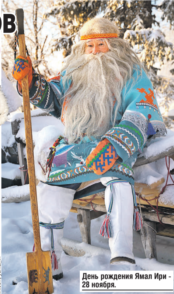
День рождения Ямал Ири - 28 ноября.