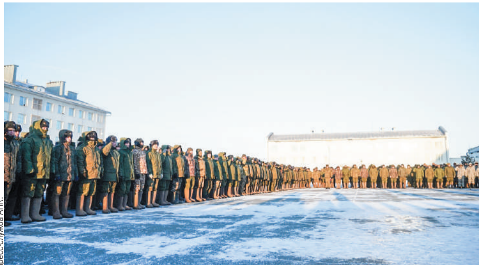
Власти Кузбасса обеспечили мобилизованных мужчин перед отправкой всем необходимым снаряжением.

Также отмечается, что на полигонах Центрального военного округа, мобилизованные выполняли боевые стрельбы из гранатометов, автоматов и пулеметов Калашникова, совершенствовали навыки метания гранат, проходили «обкатку бронетехникой», а также прошли полный курс по дисциплинам боевой и специальной подготовки.