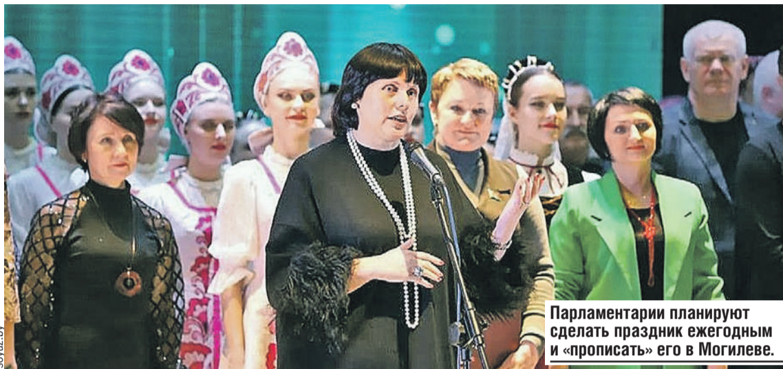
Парламентарии планируют сделать праздник ежегодным и «прописать» его в Могилеве.

уверены, что к фестивалю с каждым годом стоит приобщать все больше людей. С коллегами перед церемонией открытия говорили о кохлеарно имплантированных детках (имеющих протезы для восстановления слуха. - Ред.). Как они поют, какие мюзиклы ставят - это достойно большой сцены! А в Могилеве именно такая: на открытии фестиваля видим тех, кто танцует, вышивает, рисует. В зале им аплодирует огромная аудитория - это важно.