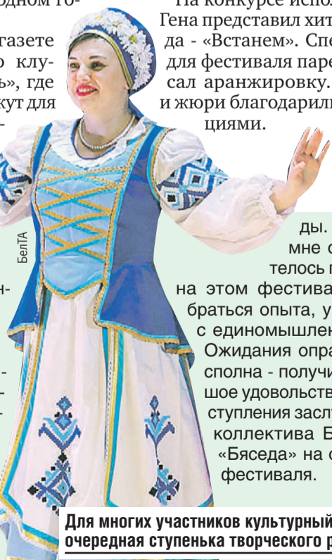
Для многих участников культурный форум - очередная ступенька творческого роста.