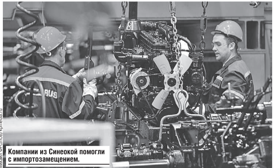
Компании из Синеокой помогли с импортозамещением.