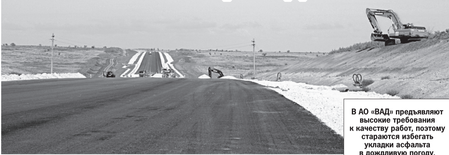
Пресс-служба АО «ВАД». На правах рекламы.

В АО «ВАД» предъявляют высокие требования к качеству работ, поэтому стараются избегать укладки асфальта в дождливую погоду.