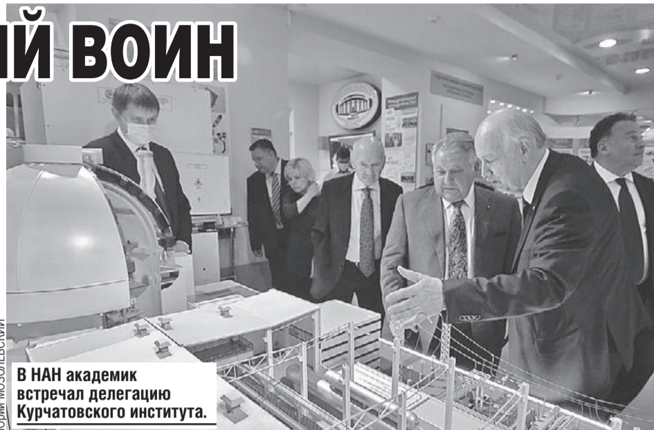
В НАН академик встречал делегацию Курчатовского института.

- Квантовый мир наполнен особой магией. Его законы, на первый взгляд, кажутся неприменимыми к нашей реальности. За взаимодействием и превращениями микрочастиц наблюдаю вот уже больше пятидесяти лет. И это удивительный, другой реальный мир, фантастическая terra incognita, - рас-