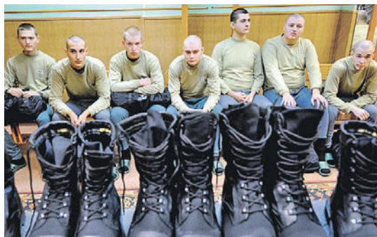
Владимир ВЕЛЕНУРИН/«КП» - Москва