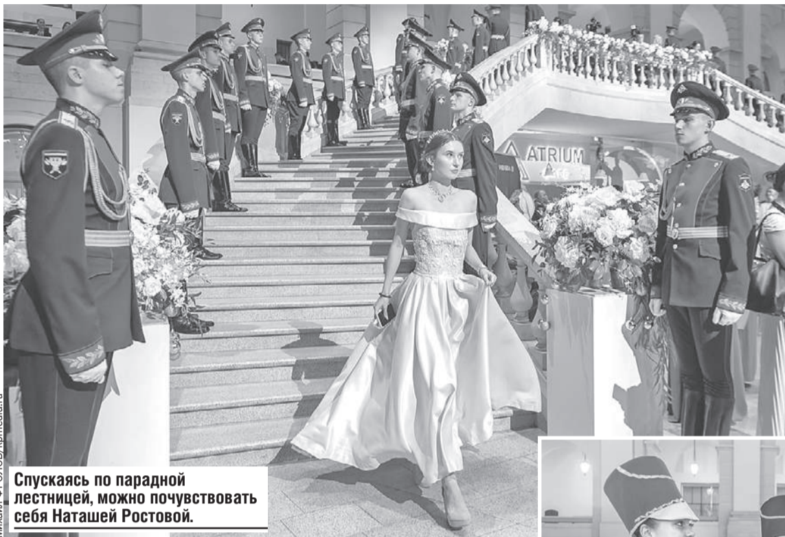
Спускаясь по парадной лестницей, можно почувствовать себя Наташей Ростовой.

Закружиться под звуки вальса - детская мечта девочек.