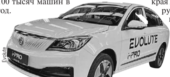
Седан Evolute i-PRO. Владельцы электрокаров в РФ получают право не платить за платные городские паркинги.

В Липецкой области начали сборку российских электрокаров Evolute. Первая модель - седан - называется i-PRO. В ней 163-сильный мотор и аккумулятор с запасом хода на 420 км. Запланирована сборка кроссоверов i-JOY и минивэнов i-VAN. Расчетная мощность завода свыше 100 тысяч машин в год.