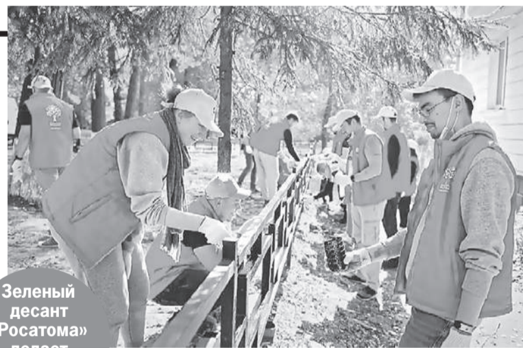
Зеленый десант «Росатома» делает природу чище.

«Росатом» реализует проекты в городах присутствия. В этом году к ним присоединился Энергодар, в котором располагается самая крупная в Европе атомная электростанция - Запорожская АЭС. Жители Энергодара переживают непростые времена, и семья «Росатом» решила их поддержать проведением марафона «Росатом вместе с Энергодаром». Так сотрудники Госкорпорации оказывают поддержку жителям