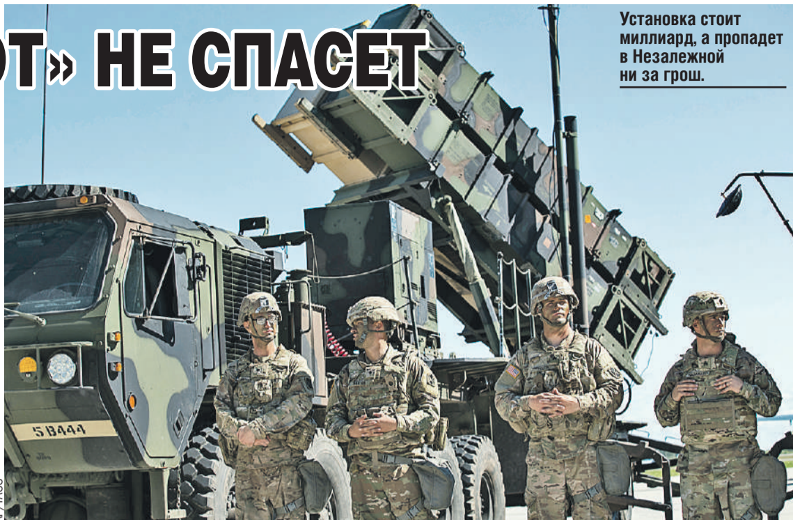
Установка стоит миллиард, а пропадет в Незалежной ни за грош.