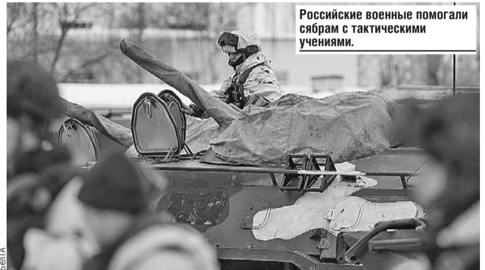
Российские военные помогли сямрам с тактическими учениями.