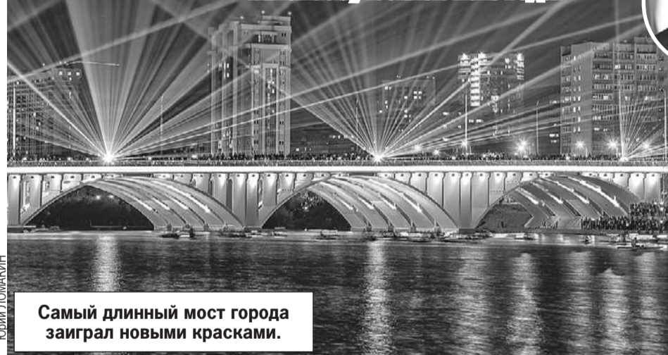
Самый длинный мост города заиграл новыми красками.

В Екатеринбурге готовятся к главному юбилею 2023 года.