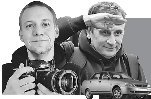
Владимир ВОРСОБИН (текст)

Продолжение. Начало в предыдущих номерах «КП» и на сайте KP.RU.