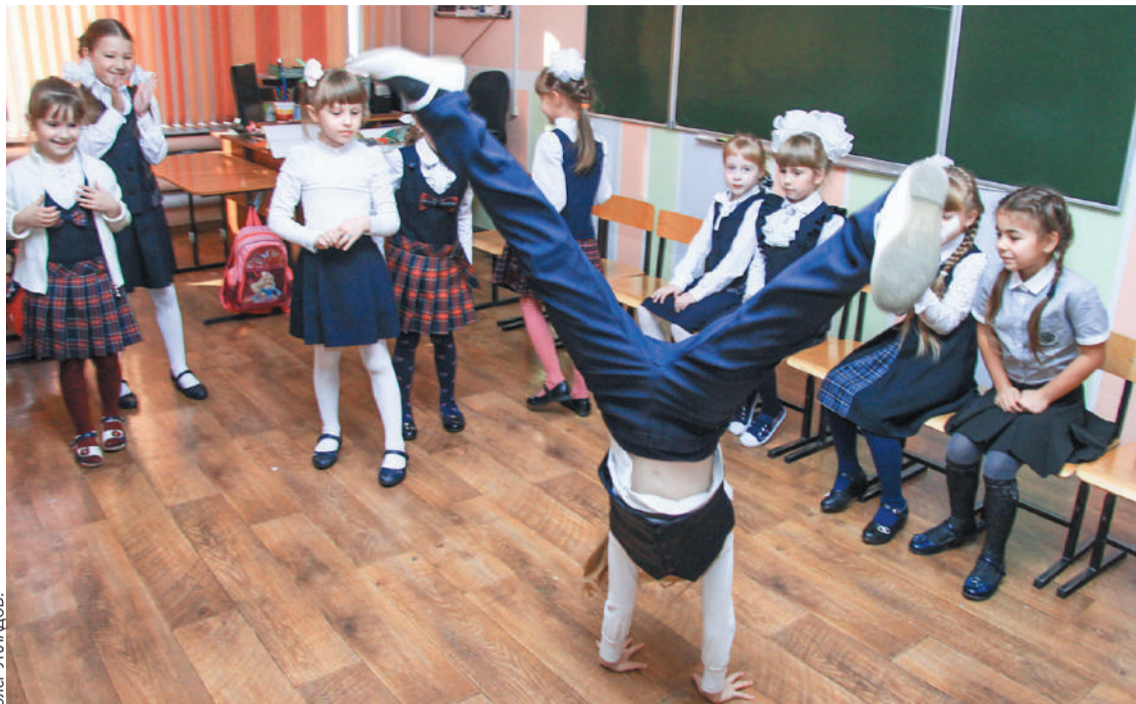
Сотрудники школы, принятые на новую должность, должны будут оказаться на одной волне с детьми, чтобы организовать им досуг по интересам.

Следующий год в России объявлен Годом педагога и наставника, а в Кузбассе - еще и Годом ребенка. В регионе планируют уделить особое внимание повышению престижа профессии