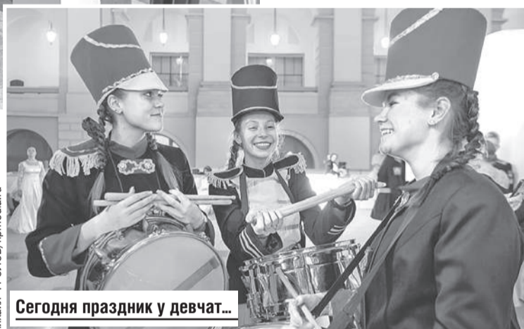
Сегодня праздник у девочек...