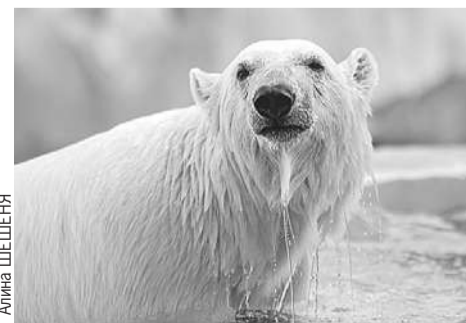
Медведицу Хатангу нашли на Северной Земле истощенным медвежонком. Теперь она живет в новом вольере в Екатеринбургском зоопарке.

будут проходить масштабные фестивали, выставочные проекты и театральные премьеры. А вот программу самого Дня города пока держат в секрете. Но без концертов, спектаклей и мультимедийных инсталляций точно не обойдется.