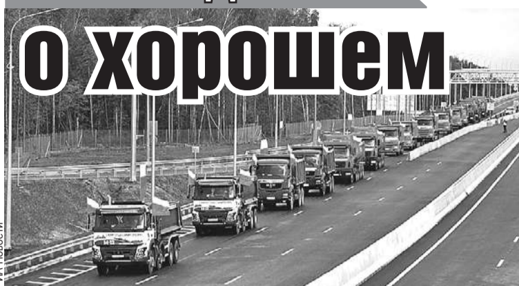
Названия у новой скоростной автомагистрали М-12 пока нет. Озвучивались различные варианты, например «Евразия», «Восток», «Казань».