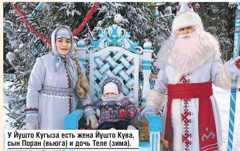
У Йушто Кугыза есть жена Йушто Кува, сын Поран (вьюга) и дочь Теле (зима).

На языке народа мари Йушто Кугыза означает «Холодный дедушка». Внешне он напоминает традиционного Деда Мороза, хотя есть и отличия. У него большая белая борода, длинный теплый белоснежный тулуп, а рукавицы украшены национальным марийским орнаментом.