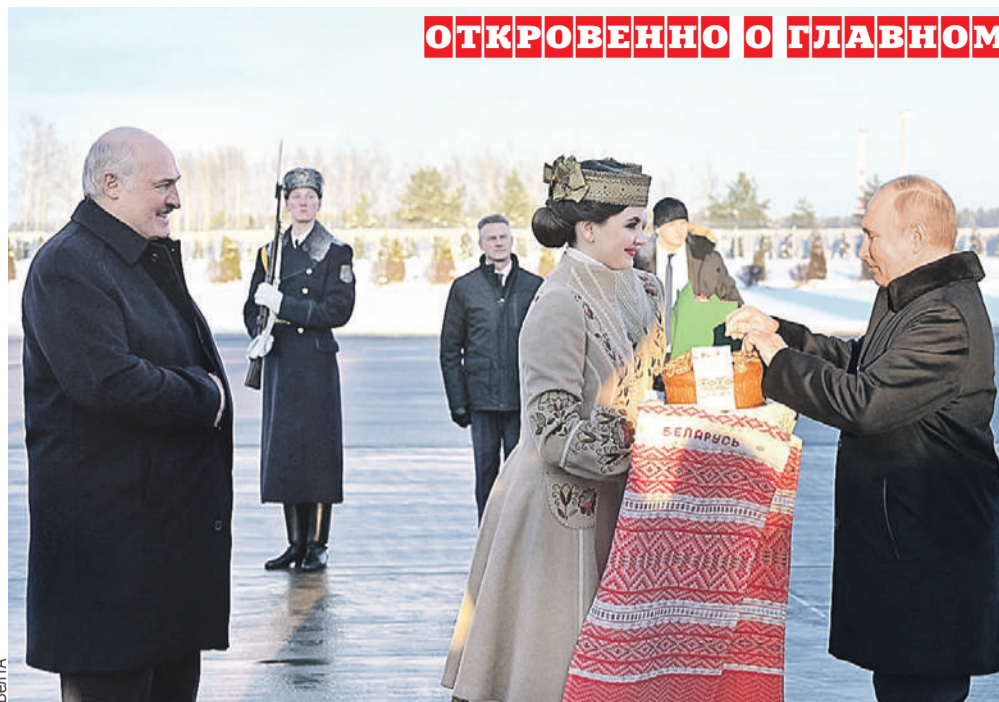
По доброму обычаю Владимира Путина встречали хлебом-солью.